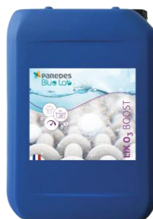
LIX O3 BOOST Réf. 388945