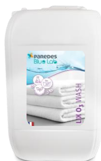
LIX O3 WASH Réf. 388940