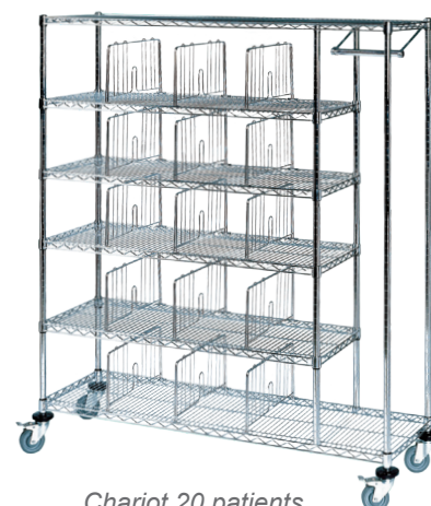
Chariot 20 patients avec penderie