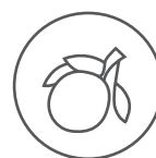
ORANGE & CITRON FRAIS