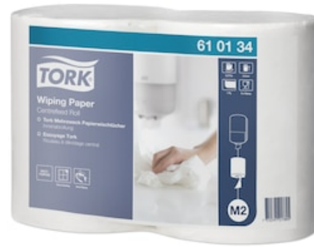
Ess Tork C&C 1p roul 275m M2 610134