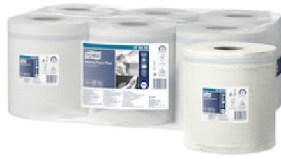
Tork ess Plus DC 450f blanc 473414