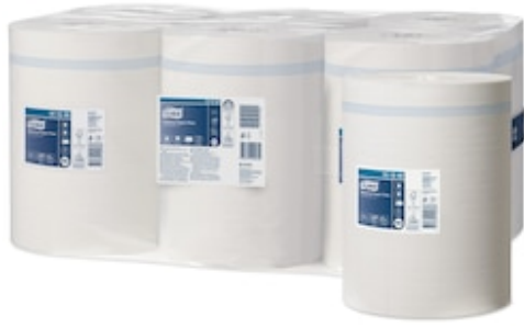
Tork Wiping Paper Plus Cfeed M2 101240