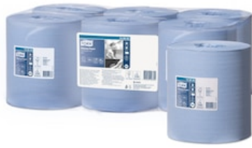
Tork Essuyage bleu DC M2 130035