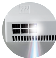
ÉCLAIRAGE DE LA ZONE DE SÈCHAGE

1 Unité logistique (nombre d'unités par colis).