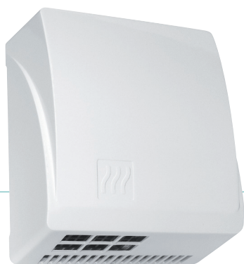
REF 8 11 413 Master automatique blanc UL 1 : 4