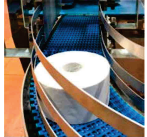
La ouate est le produit le plus vendu par Paredes.