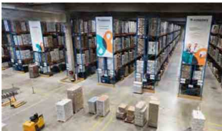
Paredes vise à doubler de taille en atteignant les 500 millions de chiffre d'affaires d'ici 2030.

Numéro deux français de la distribution dans le secteur de l'hygiène professionnelle, l'ETI lyonnaise Paredes, pilotée depuis 2017 par François Thuilleur, s'embarque désormais dans un plan de développement ambitieux pour doubler de taille d'ici 2030.