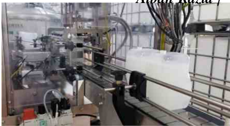
Alban Razia /

La savon est conditionné dans des poches en plastique recyclable 30 % plus légères qu'auparavant. A. R.