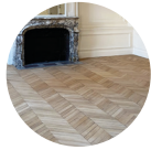
parquets (sols fragiles à considérer comme protégés)