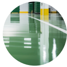
béton et résine