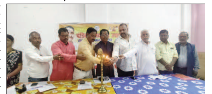
दीप जलाकर प्रशिक्षण शुभारंभ करते अतिथि।