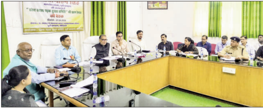
समीक्षा करते सांसद, डीएम, एडीएम एवं डीडीसी व अन्य।

बैठक के दौरान सबसे पहले पिछली बैठक की कार्यवाही की पुष्टि की गई और संबंधित विभागों को आवश्यक दिशा-निर्देश दिए गए। इसके बाद जिले में हुई सड़क दुर्घटनाओं के आंकड़ों की विस्तृत समीक्षा की गई। दुर्घटनाओं में कमी लाने के लिए राष्ट्रीय राजमार्ग, पथ निर्माण विभाग तथा ग्रामीण कार्य विभाग को आवश्यक कदम उठाने का निर्देश दिया गया। समिति ने जिले के दुर्घटना-प्रवण क्षेत्रों की भी समीक्षा की। इन स्थानों पर सुरक्षा के दृष्टिकोण से स्पीड ब्रेकर, रम्बल स्ट्रिप, साइन बोर्ड और अन्य