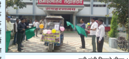
हरी झंडी दिखाते डीएम।