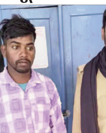
बदमाश को जेल लकर जाती पुलिस।