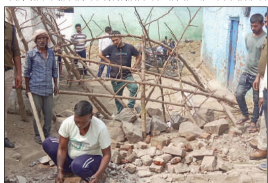
अवैध रास्ता को बंद करवाते रेल प्रशासन।

जमालपुर (मुंगेर) (एनएसबी) । रेल कलोनी रामपुर में पिछले दिनों अवैध रास्ते के कारण हो रहे आवा जाहि को लेकर दो समुदाय के बीच हुए विवाद को तो रेल एवं जिला प्रशासन के पहल से सुलझा लिया गया। लेकिन शनिवार को रेल प्रशासन की ओर से उक्त अवैध रास्ते को