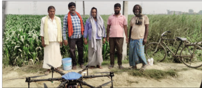
सप्रे मशीन से खेत में कीटनाशक का छिड़काव करते किसान।