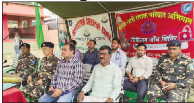
कार्यक्रम में पदाधिकारी ।