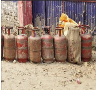
गैस की किल्लत से लोगों की बड़ी परेशानी।

इस संबंध में अभी तक किसी प्रकार की आधिकारिक पुष्टि नहीं हुई है, लेकिन इलाके में इस तरह की चर्चाएं आम हैं और कई उपभोक्ता इस तरह की बातों का दावा भी कर रहे हैं। गृहिणियों का कहना है कि अचानक गैस खत्म हो जाने के बाद उन्हें खाना बनाने में काफी दिक्कतों का सामना करना पड़ रहा है। कई परिवारों को मजबूरी में लकड़ी या अन्य वैकल्पिक साधनों का