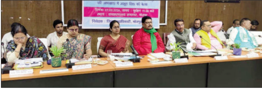
जिला विकास समन्वय एवं निगरानी समिति (दिशा) की बैठक में सांसद, मंत्री, विधायक व अधिकारी।

समीक्षा के दौरान डॉ. अंबेडकर समग्र सेवा अभियान, महिला संवाद, बिहार स्टूडेंट क्रेडिट कार्ड योजना, मुख्यमंत्री निश्चय स्वयं सहायता भत्ता योजना, कुशल युवा कार्यक्रम, हर पंचायत में प्लस टू विद्यालय, उच्चतर शिक्षा हेतु महिलाओं को प्रोत्साहन योजना, आयुष्मान भारत योजना, प्रधानमंत्री ग्राम सड़क योजना, मुख्यमंत्री ग्राम सड़क योजना, मुख्यमंत्री ग्रामीण सोलर स्ट्रीट लाइट योजना, पंचायत