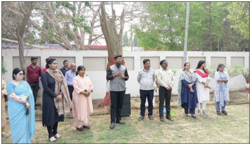
महिला दिवस कार्यक्रम को संबोधित करते जिलाधिकारी।