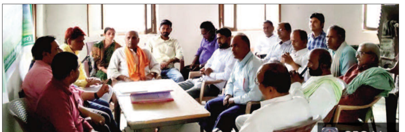
बैठक करते ।