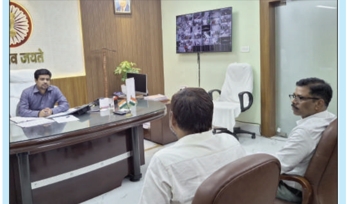
पदाधिकारियों के साथ समीक्षा करते डीएम।

सुपौल (एनएसबी) । डीएम सावन कुमार, के द्वारा ग्रामीण कार्य विभाग से संबंधित योजनाओं की प्रगति की समीक्षात्मक की गई। बैठक के दौरान जिलाधिकारी द्वारा ग्रामीण कार्य विभाग के अंतर्गत संचालित विभिन्न योजनाओं एवं निर्माण कार्यों की प्रगति की विस्तृत समीक्षा की। उन्होंने संबंधित पदाधिकारियों को निर्देश दिया कि सभी योजनाओं का कार्य गुणवत्तापूर्ण निर्धारित समय-सीमा के भीतर पूर्ण कराया जाए। साथ ही निर्माण कार्यों में पारदर्शिता एवं गुणवत्ता मानकों का विशेष ध्यान रखने को कहा गया। उक्त बैठक में कार्यपालक अभियंता, ग्रामीण कार्य विभाग, सुपौल एवं त्रिवेणीगंज उपस्थित थे।