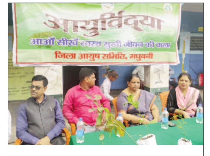
कार्यक्रम में उपस्थित ।