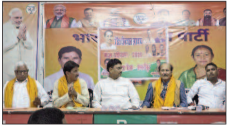
मंचासीन भाजपा नेता।