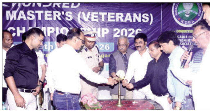
हंड्रेड मास्टर्स वेटरन बैडमिंटन चैंपियनशिप का उद्घाटन करते अतिथि।