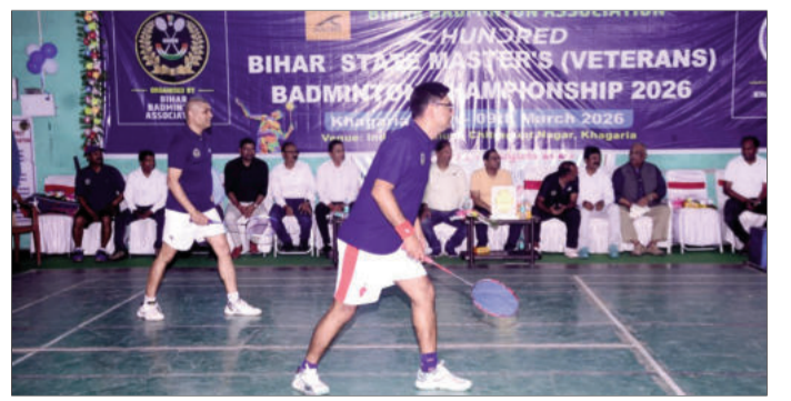
डबल्स वर्ग के एक मैच में भाग लेते वेटरन खिलाड़ी।