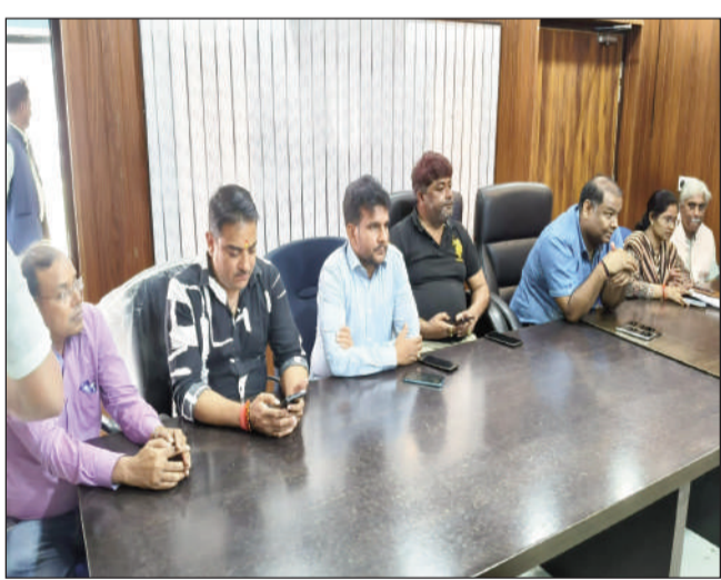
बैठक में शामिल प्रमुख, बीडीओ व सदस्य।

पंचायत प्रतिनिधियों ने विभिन्न विमारियों से मुक्ति के लिए ससमय डीडीटी छिड़काव