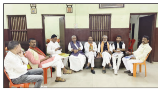
कार्यशाला में बैठे विधायक के साथ अन्य।

चकिया (एनएसबी)। शहर के रानीगंज मोहल्ला स्थित मारवाड़ी धर्मशाला के सभागार में भाजपा द्वारा राष्ट्रीय स्तर पर संचालित श्रद्धेय पंडित दीनदयाल उपाध्याय प्रशिक्षण महाअभियान 2026 के तहत भाजपा चकिया नगर मंडल, ग्रामीण मंडल एवं पिपरा मंडल में मंडल स्तर पर कार्यशाला का आयोजन किया गया। कार्यशाला का उद्घाटन डॉ. श्यामा प्रसाद मुखर्जी एवं पंडित दीनदयाल उपाध्याय के तैल चित्र के निकट दीप प्रज्वलित व पुष्प अर्पित कर कि गई।