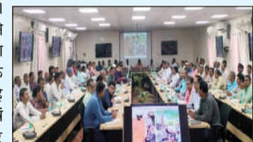
बैठक में उपस्थित मनरेगा पदाधिकारी।