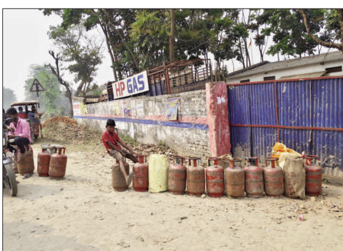
गैस के इंतजार में उपभोक्ता।

गैस नहीं मिलने के कारण घरों की दिनचर्या पूरी तरह से प्रभावित हो गई है। विशेष रूप से महिलाओं और बुजुर्गों को काफी कठिनाइयों का सामना करना पड़ रहा है। स्थानीय लोगों ने बताया कि सिलेंडर मिलने की उम्मीद में हर रोज सुबह से ही प्रखंड क्षेत्र में विभिन्न गैस गोदाम के बाहर लंबी कतार लग जाती है। दर्जनों लोग सुबह-सुबह नंबर लगाने के लिए