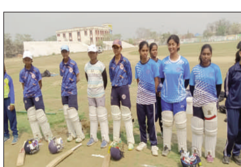
ट्रायल में भाग लेते खिलाड़ी।