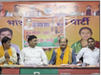
मंचासीन भाजपा नेता।