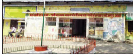
प्रखंड सह अंचल कार्यालय कोईलवर।