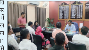
बैठक करते डीएम।

लखीसराय में पेयजल संकट से निपटने की तैयारी, डीएम ने चापाकल मरम्मती दल को हरी झंडी दिखाकर किया रवाना