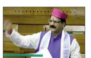
डॉ गोपाल जी ठाकुर सांसद दरभंगा ।

दरभंगा (एनएसबी)। सांसद सह लोकसभा में भाजपा सचेतक डा गोपाल जी ठाकुर को लोकसभा अध्यक्ष ओम बिरला के द्वारा उत्तर यूरोप के लिए गठित भारत - बाल्टिक संसदीय मैत्री समूह का सदस्य बनाया गया है। इस आशय की सूचना मिलते ही दरभंगा जिले सहित मिथिला क्षेत्र में भाजपा तथा एनडीए कार्यकर्ताओं के बीच खुशी की लहर दौड़ गई तथा सांसद डा ठाकुर को बधाई देने बालों का तांता लग गया। भारत - बाल्टिक संसदीय मैत्री समूह के सदस्य बनाए पर सांसद डा ठाकुर ने प्रसन्नता व्यक्त की है तथा इसके लिए प्रधानमंत्री नरेंद्र मोदी, गृह मंत्री अमित शाह, संसदीय कार्य मंत्री किरण रिजिजू के साथ लोकसभा अध्यक्ष ओम बिरला के प्रति आभार प्रकट करते हुए कहा है कि पार्टी नेतृत्व ने जिस आशा तथा भरोसे के साथ इतनी बड़ी जिम्मेदारी सौंपी है उसे ईमानदारी से निर्वहन करेंगे।