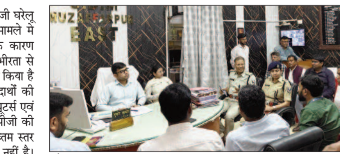
गैस व पेट्रोलियम पदार्थों की किल्लत मामले को लेकर वितरकों व कंपनी प्रतिनिधियों के साथ बैठक करते एसडीओ।

मुजफ्फरपुर (एनएसबी)। जिले में एलपीजी घरेलू गैस व पेट्रोलियम पदार्थों की आपूर्ति के मामले में विश्व के मध्य पूर्व में चल रहे युद्ध के कारण किल्लत की फैलाई जा रही स्थिति को गंभीरता से लेते हुए जिला प्रशासन ने बुधवार को स्पष्ट किया है कि एलपीजी घरेलू गैस एवं पेट्रोलियम पदार्थों की आपूर्ति में कोई कमी नहीं है। सभी डिस्ट्रीब्यूटर्स एवं गैस कम्पनीयों के पास पर्याप्त मात्रा में एलपीजी की उपलब्धता पूर्व की भांति बनी हुई है। उच्चतम स्तर से किसी भी प्रकार की कटौती का आदेश नहीं है। घरेलू गैस की बुकिंग एवं डिलेवरी उपभोक्ता के रजिस्टर्ड मोबाइल नंबर से कम्पनी के बुकिंग नंबर पर मिस्ड कॉल या एसएमएस, आईवीआरएस, व्हाट्सएप तथा ओटीपी पर पूर्व की भांति हो रहा है। यह प्रणाली अभी भी क्रियाशील है। वर्तमान में मध्य पूर्व में चल रहे युद्ध के कारण पिछले गैस डिलेवरी के 25 दिनों के अन्तराल पर बुकिंग की प्रक्रिया निर्धारित की गई है। एलपीजी गैस की कोई समस्या नहीं है। जिले में घरेलू गैस व पेट्रोलियम पदार्थों की आपूर्ति