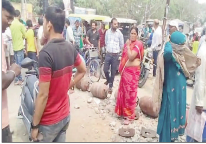
सड़क पर सिलेंडर रख कर जाम करते उपभोक्ता।

सुपौल। जिले में इन दिनों घरेलू गैस की भीषण किल्लत से उपभोक्ता परेशान हैं। जिले में कई जगह उपभोक्ताओं ने सड़क पर सिलेंडर रखकर सड़क जाम करके प्रदर्शन किया। ये नजारा दिखा जिला मुख्यालय स्थित सर्किट हाउस के सामने शकुन इंडेन गैस एजेंसी का, जहां सैकड़ों उपभोक्ता सुबह से गैस के लिए लंबी लाईन लगाकर गैस मिलने के इंतजार में बैठे रहे। वही समय पर गैस आपूर्ति नहीं होने से नाराज उपभोक्ताओं ने सड़क पर सिलेंडर रखकर सड़क जाम कर शहर के मुख्य मार्ग को बाधित कर दिया, जिससे लोगों को आवाजाही में भारी परेशानी देखने को मिली। इस बावत सड़क जाम