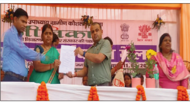
रोजगार मेले का उद्घाटन करते बीडीओ।

रोजगार मेले में कुल 14 कंपनियों ने भाग लिया। इस दौरान लगभग 524 युवक-युवतियों ने रोजगार के लिए अपना निबंधन कराया। कई कंपनियों ने युवाओं