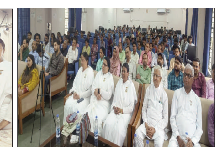
सेमिनार में मौजूद संस्थान के प्राचार्य व अन्य।