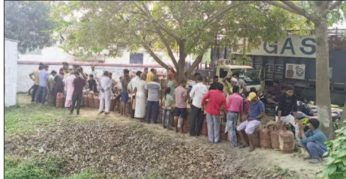
गैस उपभोक्ता की लंबी लाइन।

जयनगर (एनएसबी)। जिले के जयनगर प्रखंड क्षेत्र के दुल्लीपट्टी तथा आसपास के इलाकों में इन दिनों घरेलू और व्यावसायिक गैस सिलिंडरों की कमी से आम उपभोक्ताओं को भारी परेशानी का सामना करना पड़ रहा है। बुधवार की सुबह से ही विभिन्न गैस एजेंसियों के बाहर उपभोक्ताओं की लंबी कतारें देखने को मिलीं। लोग खाली सिलिंडर लेकर सुबह-सुबह ही एजेंसी परिसर के बाहर लाइन में खड़े नजर आए और घंटों तक अपनी बारी का इंतजार करते रहे। दुल्लीपट्टी स्थित सियाराम एचपी गैस एजेंसी के अलावा कुआड़ स्थित सपना इंडियन गैस एजेंसी भी उपभोक्ताओं की भारी भीड़ उमड़ पड़ी। गैस की सीमित उपलब्धता के कारण कई उपभोक्ताओं को काफी देर तक इंतजार करना पड़ा। कुछ लोगों को तो गैस मिलने की उम्मीद में कई घंटों तक लाइन में खड़ा रहना पड़ा, जबकि कई लोग गैस खत होने के कारण निराश होकर वापस लौटते भी दिखाई दिए। स्थानीय लोगों के