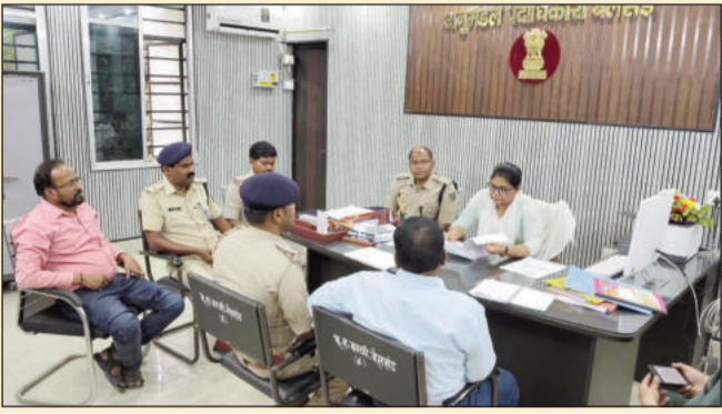
जनता दरबार में उपस्थित पदाधिकारी।

सीतामढ़ी (एनएसबी)। बुधवार को अनुमंडल पदाधिकारी, बेलसंड की अध्यक्षता में भूमिद्विवाद से संबंधित जनता दरबार का आयोजन किया गया। इस