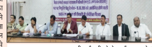
परीक्षा तैयारी को लेकर बैठक करते।