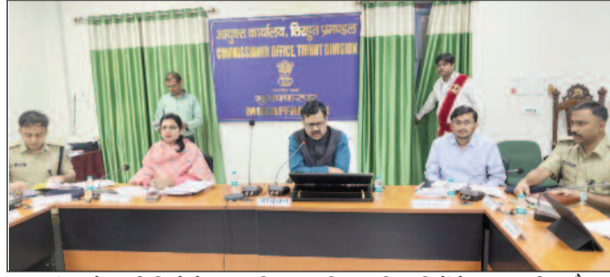
प्रमंडल के सभी जिले के प्रशासनिक व पुलिस अधिकारियों के साथ समीक्षा बैठक करते तिरहुत प्रमंडलीय आयुक्त।

विधि-व्यवस्था की स्थिति की समीक्षा करते हुए आयुक्त ने महिलाओं एवं बच्चों की सुरक्षा को सर्वोच्च प्राथमिकता देने पर बल दिया। उन्होंने महिलाओं एवं बच्चों से संबंधित मामलों में पूर्ण संवेदनशीलता के साथ कार्रवाई तथा उनकी सुरक्षा, संरक्षण एवं देखभाल की समुचित व्यवस्था सुनिश्चित करने का निर्देश जिलाधिकारियों व शीर्ष पुलिस