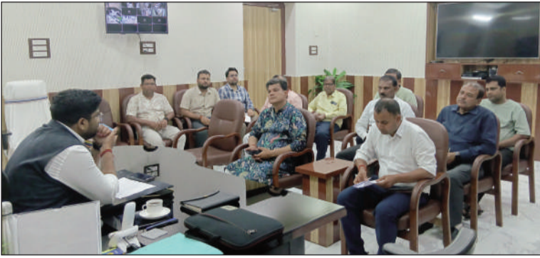
गैस आपूर्ति को लेकर एजेंसी संचालक के साथ बैठक करते जिलाधिकारी।

जिलाधिकारी ने कहा कि विगत कुछ दिनों से जिले में रसोई गैस को लेकर आमजन में कई तरह की अफवाहें तथा भ्रान्तियाँ उत्पन्न हुई, जिस कारण आमजन गैस के अतिरिक्त भंडारण तथा कुछ एजेंसी द्वारा निर्धारित शुल्क से ज्यादा राशि वसुले जाने की शिकायत प्राप्त हो रही है। इस परिस्थिति में आप सभी एजेंसी संचालक सर्वप्रथम