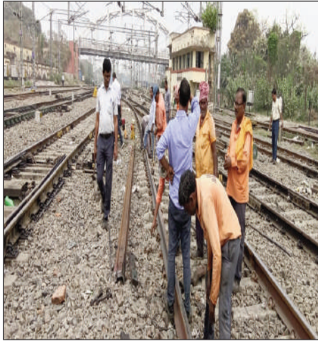
पटरी मरम्मत का कार्य करते पीडब्ल्यूई कर्मचारी।

जमालपुर (मुंगेर) (एनएसबी)। जमालपुर-भागलपुर-किऊल रेलखंड पर अपग्रेड करने को लेकर पटरी मरम्मत का कार्य युद्ध स्तर पर शुरू किया गया है। रेलखंड पर हाई स्पीड ट्रेन चलाने के लिए रेलवे ट्रैक अपग्रेड करने को लेकर वैसे तो यह रूटीन वर्क के तहत कार्य को पीडब्ल्यू ई के कर्मचारियों के द्वारा किया जाता रहा है पर विशेष तौर पर यह कार्य जमालपुर-भागलपुर-किऊल एवं मुंगेर रेल खंड पर किया जा रहा है। पटरी मरम्ती के दौरान डायमंड क्रसिंग स्पीकर के रिन्यूअल को बाकी से देखकर कार्य को कराया जा रहा है। इधर पटरी मरम्ती के दौरान ट्रेनों का परिचालन प्रभावित नहीं हो इसको लेकर विशेष तौर पर इसका ख्याल रखा जा रहा है। जमालपुर-भागलपुर-किऊल रेलखंड पर भविष्य में हाई स्पीड ट्रेन चलाने की संभावनाओं को मजबूत करने के लिए रेलवे लगातार ट्रैक और तकनीकी ढांचे को अपग्रेड कर रहा है। इसी क्रम में बुधवार को जमालपुर आरआरआई के समीप दर्जनों की संख्या में पीडब्ल्यू ई के कर्मचारियों ने सेप्टी के साथ मरम्मत कार्य करते देखे गए।