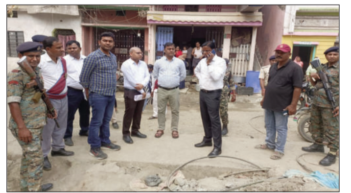
निरीक्षण करते जिलाधिकारी दरभंगा कौशल कुमार।

उन्होंने सड़क पर पड़े निर्माण सामग्री एवं मलबे को भी रामनवमी से पूर्व अतिक्रमण मुक्त कर सड़क को साफ-सुथरा करने का निर्देश दिया, ताकि आम नागरिकों एवं आवागमन में किसी प्रकार की असुविधा न हो। निरीक्षण के दौरान यह भी पाया गया कि सड़क के बीच-बीच में कहीं-कहीं बिजली के पोल स्थापित हैं, जिससे यातायात में बाधा उत्पन्न हो सकती है। इस पर जिलाधिकारी ने कार्यपालक अभियंता को निर्देश दिया कि वे बिजली