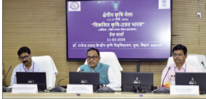
संवाददाताओं से बात करते वीसी व अन्य।