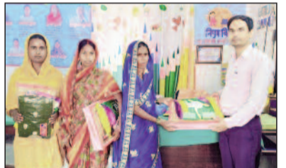
रसोइया दीदी को सम्मानित करते प्रधान शिक्षक व अन्य।