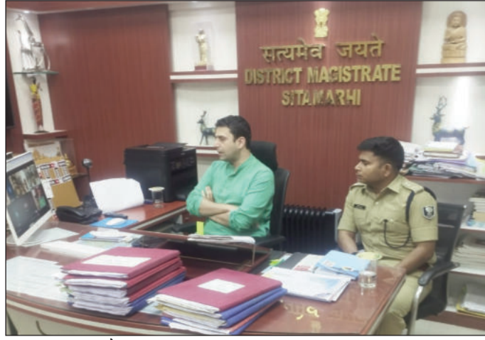
समीक्षा बैठक करते जिलाधिकारी व साथ में पुलिस अधीक्षक।

बैठक में इंडियन ऑयल, भारत पेट्रोलियम एवं हिंदुस्तान पेट्रोलियम के अधिकारियों ने जानकारी दी कि जिले में एलपीजी गैस तथा पेट्रोल-डीजल की आपूर्ति पूरी तरह सामान्य है और किसी प्रकार की कमी नहीं है। सभी गैस वितरणकों को उनके कोटे के अनुसार नियमित रूप से गैस की आपूर्ति की जा रही है।