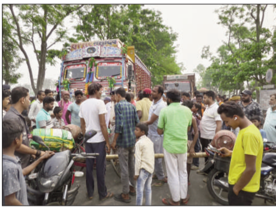
सड़क जाम करते उपभोक्ता।

उपभोक्ताओं ने आरोप लगाया कि एक ओर एजेंसी में गैस नहीं होने की बात कही जा रही है, वहीं दूसरी ओर बाजार में वही एल पी जी सिलेंडर कालाबाजारी के जरिए 1500 से 2000 रुपये तक में बेचा जा रहा है। लोगों का कहना है कि एजेंसी स्तर पर बड़े पैमाने पर गैस की कालाबाजारी हो रही है, जिसके