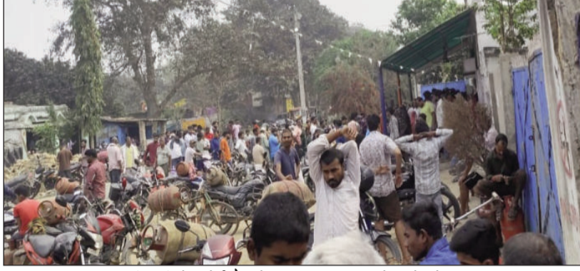
मनीगाछी में रसोई गैस के लिए सड़क किनारे खड़े लोग ।

प्राप्त जानकारी के अनुसार दरभंगा जिले में करीब डेढ़ करोड़ गैस एजेंसी है, यह प्रत्येक माह लगभग 8 लाख सिलेंडरों की आपूर्ति करती है, जिसमें लगभग 85000 सिलेंडर कमर्शियल हैं। अंतरराष्ट्रीय स्तर पर पेट्रोलियम पदार्थों की कमी के