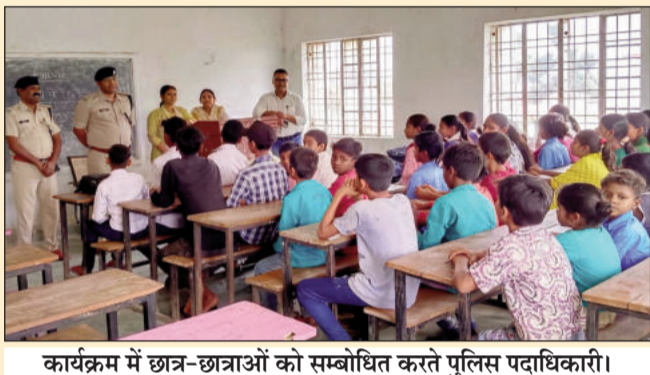
कार्यक्रम में छात्र-छात्राओं को सम्बोधित करते पुलिस पदाधिकारी।

सीतामढ़ी (एनएसबी)। बेलसंड थाना क्षेत्र के उच्च विद्यालय दमामो मठ में अनुमंडल पुलिस पदाधिकारी, बेलसंड के नेतृत्व में नशे के विरुद्ध जन-जागरूकता अभियान चलाया गया। कार्यक्रम का मुख्य उद्देश्य एक युद्ध नशे के