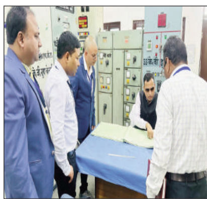
निरीक्षण करते सचिव।

निरीक्षण के दौरान ऊर्जा सचिव ने अधिकारियों को निर्देशित किया कि क्षेत्र में 24 गुना 7 निर्वाह एवं गुणवत्तापूर्ण विद्युत