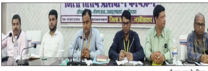
बैठक करते डीएम।

सत्र में डेटा नैतिकता, गोपनीयता और सुरक्षा जैसे संवेदनशील विषयों को प्रमुखता से रखा गया, ताकि आम नागरिकों की जानकारी सुरक्षित रहे। फील्ड