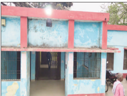
सुनसान पड़ा अंचल।

अधिकारियों का आरोप है कि सरकार सीओ के साथ भेद-भाव कर रही है हाईकोर्ट के आदेशों का अनुपालन नहीं किया जा रहा है कोर्ट का स्पष्ट आदेश है कि राजस्व सेवा के प्रमोट अधिकारियों को ही डीसीएलआर पद पर समायोजित किया जाए। पर वर्तमान सरकार डीसीएलआर जैसे प्रमोशन आधारित पद को समाप्त कर अनुमंडल राजस्व पदाधिकारी बना कर उस पर बिहार प्रशासनिक सेवा के अधिकारियों को बैठा देने का निर्णय किया है। पिछले महिने संघ और सरकार के साथ हुई बातचीत का कोई हल निकलने पर संघ के आह्वान पर सभी अधिकारी सामूहिक अवकाश पर हैं जिससे आमलोगों को काफी परेशानियों का सामना करना पड़ रहा है।