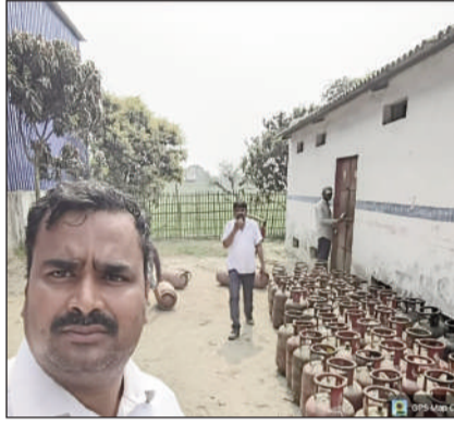
मोवाम में उपलब्ध गैस।

सुपौल (एनएसबी)। विभिन्न गैस कंपनियों के प्रतिनिधियों से प्राप्त सूचना के अनुसार सुपौल जिले में घरेलू एलपीजी गैस सिलेंडरों की कोई कमी नहीं है। वित्तीय वर्ष 2024-25 से ही जिले को प्रतिदिन लगभग 2600 सिलेंडर आवंटित किया जाता है। वर्तमान समय में घरेलू एलपीजी सिलेंडरों की कोई कमी नहीं है। लेकिन अंतरराष्ट्रीय परिस्थितियों के कारण पूरे देश में 07-03-2026 से 14.2 किलोग्राम घरेलू सिलेंडर पर 60 की वृद्धि की गई है और गैस रिफिलिंग की बुकिंग को न्यूनतम अवधि 15 दिन से बढ़ाकर 25 दिन किया गया है तथा आवश्यक सेवा अनुरक्षण अधिनियम के अंतर्गत एलपीजी सिलेंडरों की आपूर्ति को भी शामिल किया गया है। एलपीजी गैस सिलेंडर की बुकिंग मोबाइल से ऑनलाइन या गैस एजेंसी पर जाकर कराई जा सकती है और प्राप्त ओटीपी के द्वारा एलपीजी गैस सिलेंडर का उठाव किया जा सकता है यह बहुत ही सरल और आसान प्रक्रिया है।