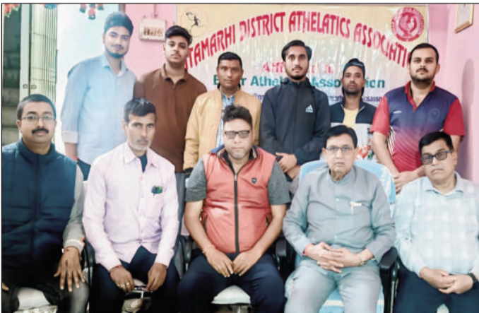
बैठक में मौजूद सीतामढ़ी जिला एथलेटिक्स एसोसिएशन के पदाधिकारी।