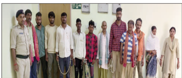
अवैध शराब मामले में गिरफ्तार।

तीन शराब तस्करों समेत 11 गिरफ्तार, भारी मात्रा में शराब बरामद