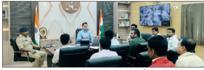
बैठक करते जिलाधिकारी।

मधुबनी (एनएसबी)। जिलाधिकारी आनंद शर्मा की अध्यक्षता में समाहरणालय स्थित सभा कक्ष में जिले के संबंधित तेल कंपनियों के प्रबंधकों एवं एलपीजी गैस वितरकों के साथ एक महत्वपूर्ण समीक्षा बैठक आयोजित की गई। बैठक में उपस्थित भारत पेट्रोलियम, हिंदुस्तान पेट्रोलियम, इंडियन ऑयल के क्षेत्रीय प्रबंधकों ने बताया कि जिले में एलपीजी गैस की आपूर्ति पूरी तरह सामान्य है तथा किसी प्रकार की कमी नहीं है। सभी गैस वितरकों को उनके मांग के अनुरूप समसमय गैस की आपूर्ति की जा रही है। बैठक में उपस्थित सभी गैस वितरकों ने भी तेल कंपनियों के प्रबंधकों की इस बात का समर्थन किया। बैठक में जिलाधिकारी ने स्पष्ट रूप से कहा कि हाल के दिनों में अंतरराष्ट्रीय परिस्थितियों को लेकर सोशल मीडिया के माध्यम से गैस की संभावित कमी संबंधी