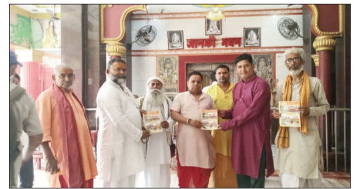
नगर स्थित रजत द्वार जानकी मंदिर में पुस्तिका समर्पित करते सीता संवाद प्रतिनिधिमंडल के सदस्य।