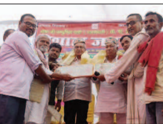
सम्मानित करते नेता को।