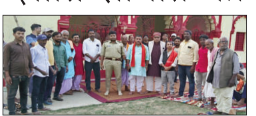
पूजा समिति के पदाधिकारी।