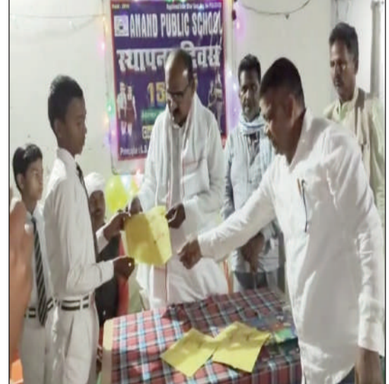
उपस्थित मुख्य अतिथियों के द्वारा वार्षिक परीक्षा में प्रथम, द्वितीय एवं तृतीय स्थान प्राप्त करने वाले छात्रों को प्रमाण पत्र प्रदान किया गया।