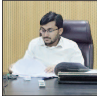
खाद्यान्न मामले में गड़बड़ी करने के मामले को लेकर चेतावनी देने जिला पदाधिकारी।