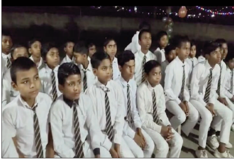
किशनपुर (सुपौल) प्रखंड मुख्यालय के बगल में मलाह स्थित आवासीय आनंद पब्लिक स्कूल का आठवां स्थापना दिवस बड़े ही धूमधाम के साथ मनाया गया। इस अवसर पर उपस्थित बच्चे।