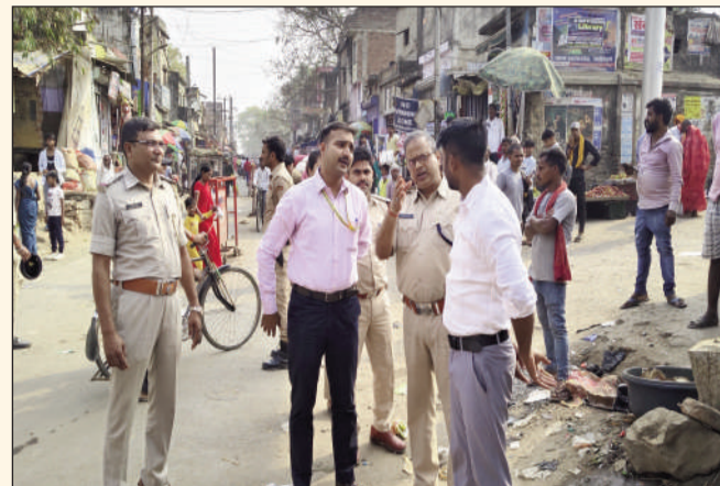
अभियान चलते डीटीओ।

सड़क किनारे से हटाया गया अतिक्रमण वसूला 34 हजार से अधिक जुर्माना