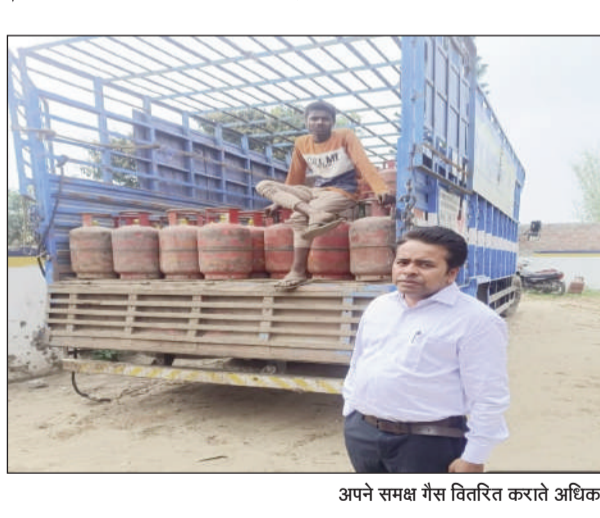
अपने समक्ष गैस वितरित कराते अधिकारी।

सुपौल (एनएसबी) । जिलाधिकारी, सुपौल के निर्देश के आलोक में घरेलू एलपीजी गैस की सुचारू आपूर्ति एवं वितरण सुनिश्चित करने तथा इसके अनुश्रवण के लिए जिला, अनुमंडल एवं प्रखंड स्तरीय अधिकारियों द्वारा लगातार जांच और छापेमारी की जा रही है। बता दे कि जिला के सभी डिस्ट्रिक्ट्स एवं गैस कंपनियों के पास पर्याप्त मात्रा में घरेलू एलपीजी गैस सिलेंडर उपलब्ध है। जिन