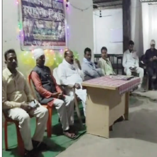
किशनपुर (सुपौल) प्रखंड मुख्यालय के बगल में मलाह स्थित आवासीय आनंद पब्लिक स्कूल का आठवां स्थापना दिवस बड़े ही धूमधाम के साथ मनाया गया। इस अवसर पर उपस्थित अतिथि।