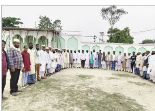
बैठक में शामिल कमिटी के पदाधिकारी व अन्य।