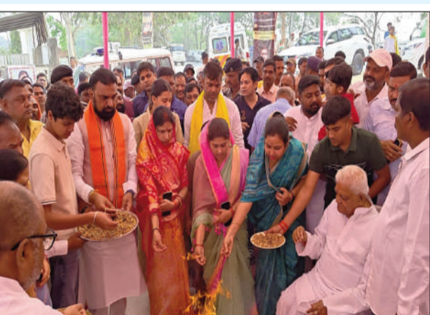
हवन करते उपमुख्यमंत्री सम्राट चौधरी।