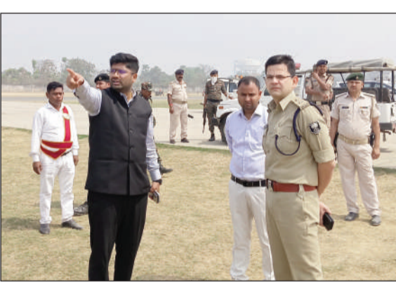
तैयारी का जायजा लेते अधिकारी।

जिलाधिकारी ने कहा कि आगामी सप्ताह माननीय मुख्यमंत्री के प्रस्तावित समृद्धि यात्रा को ले कर चल रही तैयारियों का आज निरीक्षण किया गया। इस दौरान मुख्य कार्यक्रम स्थल साफियाबाद हवाई अड्डा का निरीक्षण