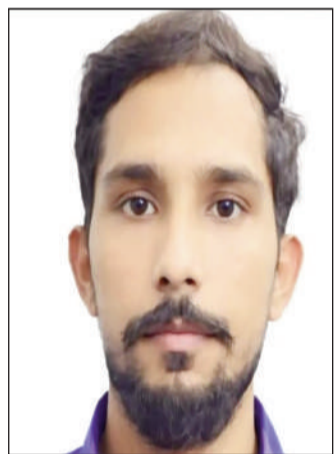
बिजली मिस्त्री की फाहल फोटो।