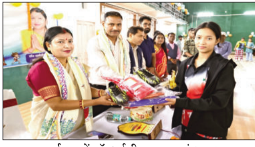
कार्यकर्ता में डॉ. धर्मशीला गुप्ता एवं अन्य।

दरभंगा (एनएसबी)। जिले के लहेरियासराय स्थित नेहरू स्टेडियम लहेरियासराय में आयोजित सांसद खेल महोत्सव में युवाओं का उत्साह देखने को मिला। कार्यक्रम की मुख्य अतिथि बिहार भाजपा महिला मोर्चा प्रदेश अध्यक्ष एवं राज्यसभा सांसद डॉ. धर्मशीला गुप्ता ने कहा कि खेल केवल प्रतिस्पर्धा का माध्यम नहीं, बल्कि अनुशासन, साहस, परिश्रम और टीम भावना का सबसे बड़ा विद्यालय है। खेल के मैदान में उतरने वाला युवा