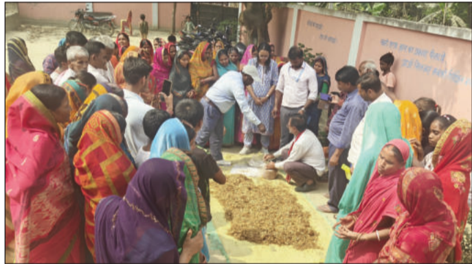
कार्यक्रम में भाग लेते लोग।