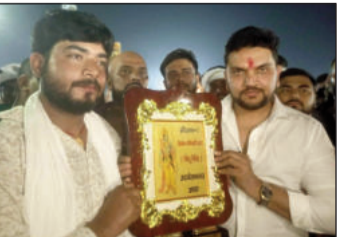
केहू बोलतई रे फेम गायक गुंजन सिंह ने किया रात्रि क्रिकेट मैच का उद्घाटन।

6 ओवर के रात्रि मैच में बक्सर, आरा, पटना, पटना, जहानाबाद, गया सहित कुल आठ टीमों शामिल हुईं। हेमंत