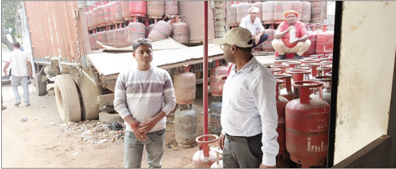
गैस एजेंसी का निरीक्षण करते अधिकारी।

वहीं ग्रामीण क्षेत्रों में पहले जहां 25 दिनों के अंतराल पर रिफिल बुकिंग की व्यवस्था थी, उसे कंपनी द्वारा बढ़ाकर अब 45 दिनों पर कर दिया गया है। इसके अतिरिक्त वर्तमान में कमर्शियल गैस की आपूर्ति अस्थायी रूप से बंद कर दी गई है। हालांकि कंपनी की ओर से यह निर्देश दिया