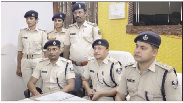
हत्याकांड का खुलासा करते एसडीपीओ।