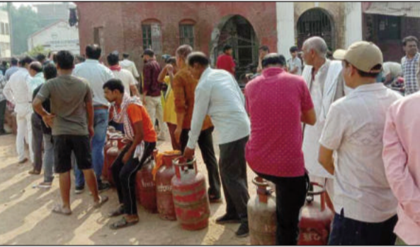
रसोई गैस के लिए लगी उपभोक्ताओं की कतार।

सुबह 9:00 के बाद गैस एजेंसी संचालक द्वारा जिला प्रशासन और जेल में सलाई के लिए ट्रक से गोदाम में रखा जा रहा था। जबकि पुलिस प्रशासन के मौजूदगी में गैस बुकिंग में ऑनलाइन पेमेंट करने वाले को दिए जाते का बात कह कर भेड़ भी रिक्शा पर लोड कर जा रहे थे। ट्रक पर अल्प अवस्था में कम सिलेंडर