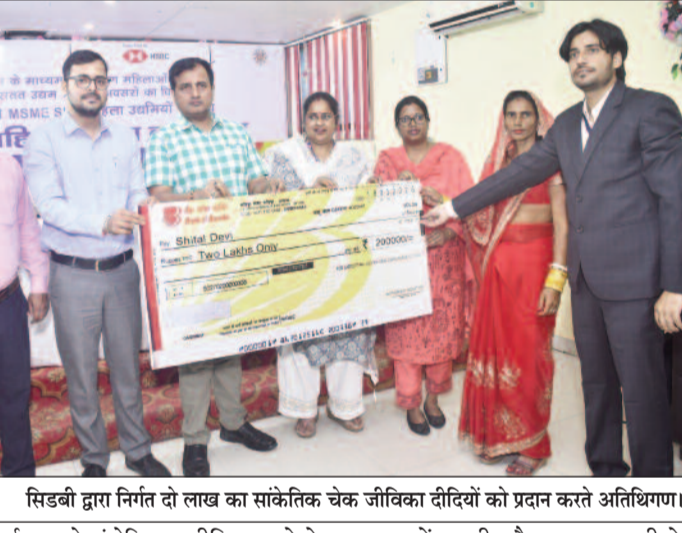
सिडबी द्वारा निर्गत दो लाख का सांकेतिक चेक जीविका दीदियों को प्रदान करते अतिथिगण।