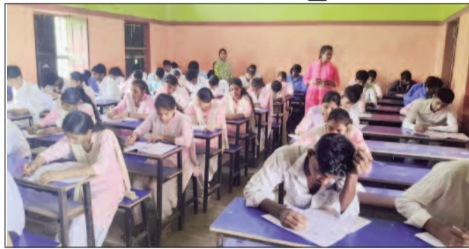
परीक्षा देते छात्र-छात्राएं।