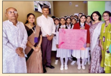
मौके पर उपस्थित संस्थान व स्कूल के प्रतिनिधि, बच्चियां व अन्य ।

सीतामढ़ी (एनएसबी)। वरुणदीप फाउंडेशन के द्वारा बुधवार 18.03.2026 को चिन्मया इंटरनेशनल स्कूल, सीतामढ़ी में सेनेटरी पैड वैंडिंग मशीन को