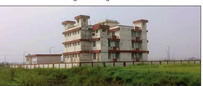
खेतों के बीच, मुख्य सड़क से करीब 3 किमी दूर स्थित बोखरा का नया थाना भवन ।

व्यवस्था पर सवाल खड़े हो रहे हैं। तकनीकी रूप से भवन का निर्माण पूरा कर विभाग द्वारा पुलिस प्रशासन को हैंडओवर भी कर दिया गया है, लेकिन अपनी बदहाल स्थिति और अनुपयोगिता