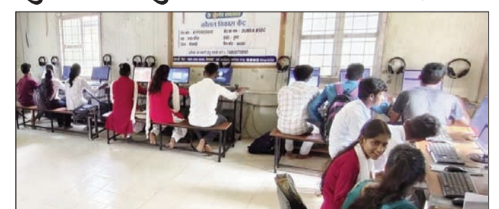
कौशल विकास केंद्र में प्रशिक्षण प्राप्त करते युवा ।