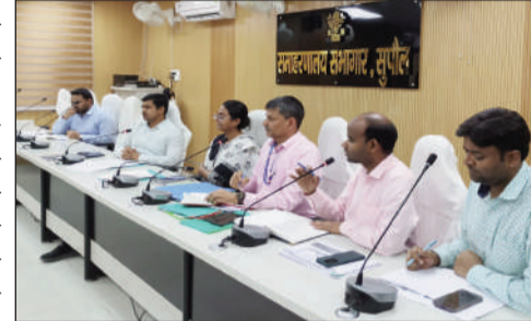
बैठक में शामिल डीएम, डीडीसी, डीईओ, डीपीओ व अन्य।

190 विद्यालय को ट्यूनिंग ऑफ स्कूल के तहत दस