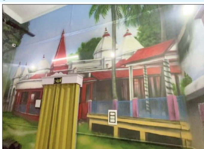
श्री-डी पेंटिंग से सजा मुंगेर।

इसी मैदान में 19 मार्च को मुख्यमंत्री का हेलीकाप्टर उतरने वाला है। सर्किट हाउस की दीवारों पर चंडिका स्थान ऋषि कुमार सीता कुण्ड और सीता चरण जैसे ऐतिहासिक स्थलों का श्री-डी चित्रण किया गया है, जिससे आने वाले मेहमानों को एक ही जगह पर पूरे