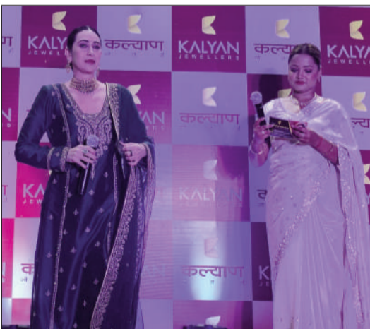
उद्घाटन एवं फैंस का अभिवादन करते अभिनेत्री करिश्मा कपूर।

जमालपुर (मुंगेर) (एनएसबी)। राजा हिंदुस्तानी, राजा बाबू, अंदाज अपना-अपना, दिल तो पागल है, शक्ति जैसी सुपरहिट फिल्मों की एक दौर की सफल व महशूर नायिका रही करिश्मा कपूर ने अपने डांस एवं अभिनय का जलवा जमालपुर में बिखेरा जिसे देखकर युवाओं उनका स्वागत गर्म जोशी के साथ किया। मुंगेर-जमालपुर रोड स्थित कल्याण ज्वेलर्स शॉप का उद्घाटन करने के बाद अपने फैंस के प्रति आभार जताया। उन्होंने कहा कि बिहार में दूसरी बार आई हैं। अच्छे लगा की छोटे शहरों में भी हमें चाहने वाले पहुंचे हैं। अभिनेत्री करिश्मा कपूर ने अपनी एक झलक पाने के लिए बेताब दर्शकों का खूब ख्याल रखा। लोगों का मनोरंजन किया। करिश्मा कपूर के मंच पर पहुंचते ही दर्शकों ने गर्मजोशी के साथ तालियों से उनका स्वागत किया। इस दौरान उन्होंने