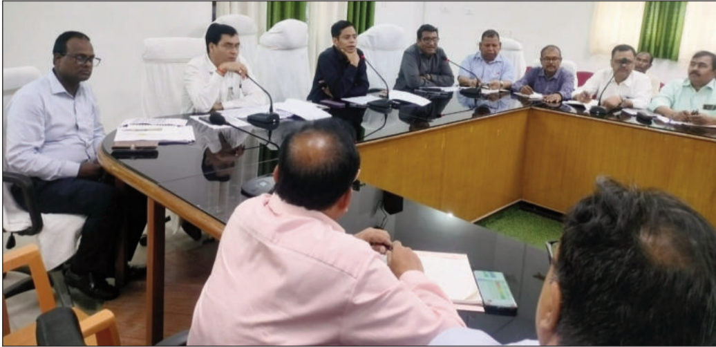
बैठक में उपस्थित अधिकारी।

मोतिहारी (एन एस बी)। उप विकास आयुक्त डू प्रदीप कुमार की अध्यक्षता में मनरेगा योजना की समीक्षा बैठक आयोजित की गई। बैठक में एनएल एक्स प्लान की समीक्षा के दौरान बताया गया कि एक सप्ताह में जिले में 10,361 योजनाओं की प्रगति दर्ज की गई है। इस पर संतोष व्यक्त करते हुए सभी कार्यक्रम पदाधिकारियों को प्रत्येक ग्राम पंचायत में 40 योजनाओं की प्रविष्टि युक्तिधारा पोर्टल पर सुनिश्चित करने का निर्देश दिया गया। कार्य पूर्णता की समीक्षा में पाया गया कि जिले का औसत 8572 प्रतिशत है, जो राज्य के 8664 प्रतिशत से थोड़ा कम है। कई प्रखंडों में प्रगति अपेक्षात कम पाई गई। इस पर सभी अधिकारियों को अपूर्ण योजनाओं के लिए मास्टर प्लान तैयार कर 90 प्रतिशत लक्ष्य हासिल करने का निर्देश दिया गया। पीएम आवास योजना (ग्रामीण) कन्वर्जेंस के अंतर्गत नरेगा और