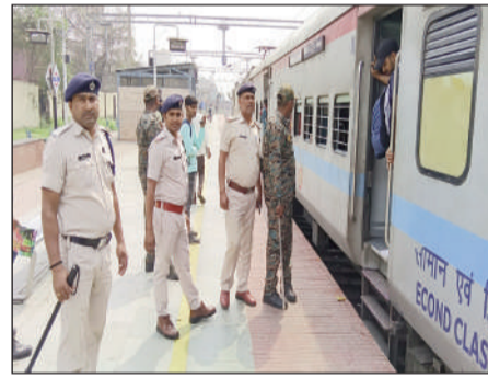
महिला डिब्बे में अभियान चलाते आरपीएफ।