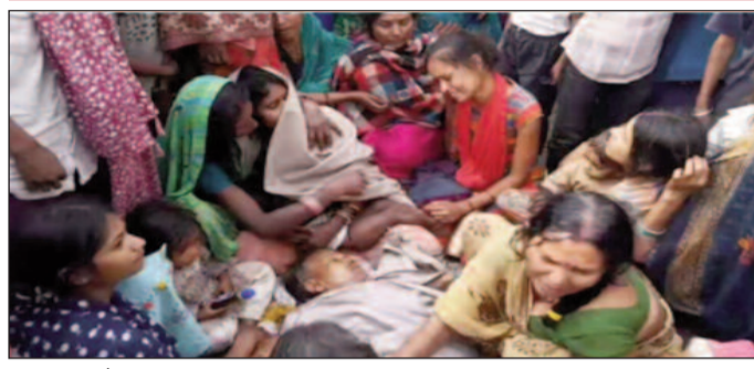
ग्रामीणों और पुलिस के बीच हुई हिंसक झड़प में मृत ग्रामीण के शव के पास रोते बिलखते परिजन।

दो पुलिस वाहनों को किया क्षतिग्रस्त, हमले में गायघाट थानाध्यक्ष सहित 4 पुलिसकर्मी घायल, एक ग्रामीण की मौत