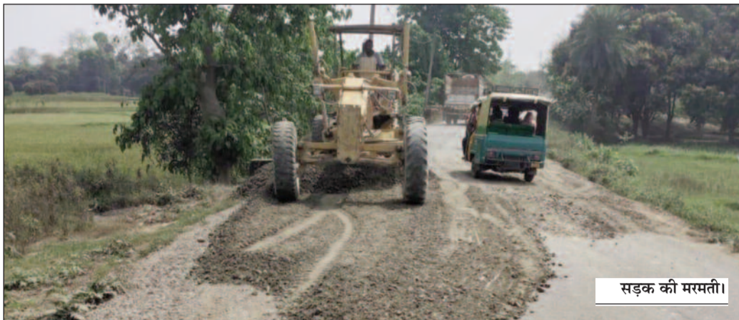
सड़क की मरम्ती।

मधुबनी (एनएसबी)। जिलाधिकारी आनंद शर्मा द्वारा ग्रामीण सड़कों के सुदृढीकरण एवं मरम्मत कार्यों की लगातार मॉनिटरिंग का सकारात्मक परिणाम अब जमीन पर स्पष्ट रूप से दिखाई देने लगा है। इसी क्रम में साहरघाट से कलुआही सेक्शन-1 सड़क के मरम्मत कार्य का शुभारंभ हो गया है। इस महत्वपूर्ण सड़क के मरम्मत पूर्ण हो जाने के पश्चात क्षेत्र में आवागमन और अधिक सुगम एवं सुरक्षित हो जाएगा, जिससे स्थानीय नागरिकों को सीधा लाभ प्राप्त होगा। यह सड़क क्षेत्रीय संपर्क का प्रमुख माध्यम है, जिसके सुदृढीकरण से सामाजिक एवं आर्थिक गतिविधियों को भी नई गति मिलेगी। ग्रामीण सड़क सुदृढीकरण में मधुबनी राज्य के अग्रणी जिलों में शामिललगातार है कि मधुबनी जिला ग्रामीण सड़कों के मरम्मत एवं सुदृढीकरण कार्यों में राज्य के अग्रणी जिलों में शामिल हो गया है। ग्रामीण कार्य विभाग द्वारा जारी