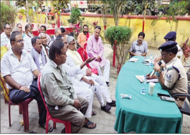
बैठक में शामिल एसडीपीओ व थाना अध्यक्ष।

उन्होंने क्षेत्र के सभी मस्जिदों और ईदों में नमाज की व्यवस्था की जानकारी ली तथा रामनवमी के