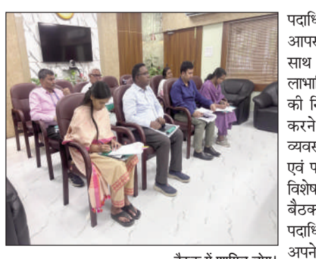
बैठक में शामिल लोग।

जिलाधिकारी ने निर्देश दिया कि शक्ति मार्गदर्शिका एवं निर्धारित मानकों के अनुरूप किया जाए, ताकि जरूरतमंद