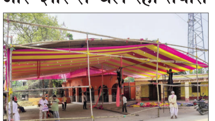
19 से 27 मार्च तक आयोजित होने वाली श्री राम कथा की तैयारी करते श्रद्धालु।