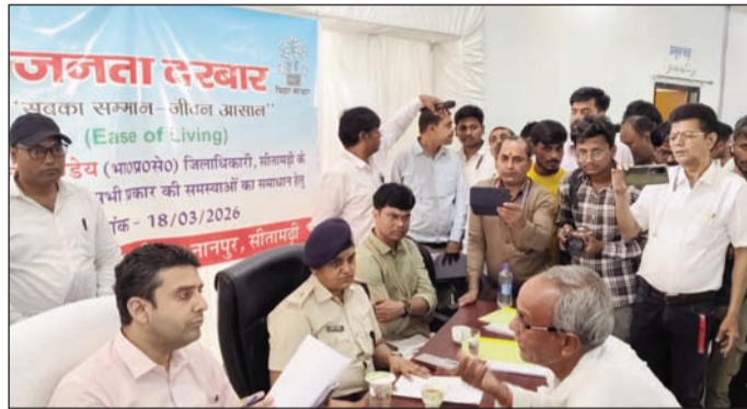
कार्यक्रम में आम जनों की समस्यायें सुनते जिलाधिकारी व उपस्थित अन्य।

इस कार्यक्रम में भूमि विवाद से संबंधित सबसे अधिक मामले आए। इसके अतिरिक्त राशन कार्ड, शौचालय भुगतान, पेयजल समस्या, सड़क अतिक्रमण, एंबुलेंस उपलब्धता, श्रम कार्ड, फसल क्षति अनुदान, विद्युत पोल की अनुपलब्धता, सोलर स्ट्रीट लाइट की