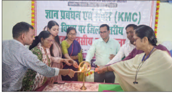
संयुक्त रूप से दीप प्रज्वलित करते अतिथि।