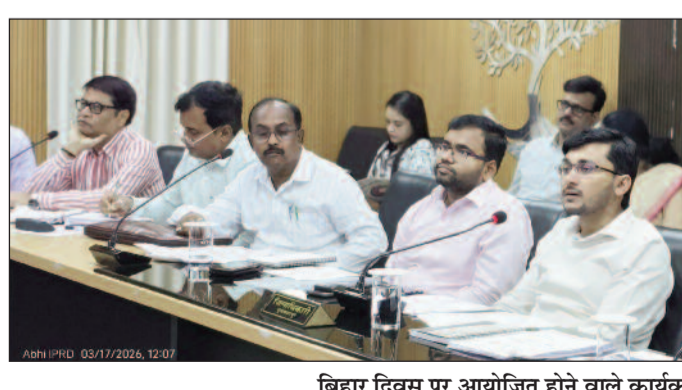
बिहार दिवस पर आयोजित होने वाले कार्यक्रम की तैयारी को लेकर बैठक करते डीएम।

मुजफ्फरपुर (एनएसबी)। बिहार दिवस के अवसर पर 22 मार्च को स्थानीय शहीद खुदीराम बोस स्टेडियम में भव्य एवं आकर्षक समारोह का आयोजन किया जाएगा। इस वर्ष समारोह को खास बनाने के लिए तीन दिवसीय कार्यक्रम की रूपरेखा तैयार की गई है, जिसमें सांस्कृतिक, शैक्षणिक, खेलकूद एवं जनकल्याणकारी गतिविधियों का समावेश किया गया है। समारोह के सफल एवं सुचारु आयोजन के लिए जिलाधिकारी की अध्यक्षता में बैठक की गई तथा कार्यक्रम को सफल बनाने के लिए विभिन्न स्तरों पर समन्वय समिति स्थापित की गई है। समारोह का शुभारम्भ 22 मार्च की सुबह प्रभात फेरी के साथ होगा। इस प्रभात फेरी में जिले के विभिन्न विद्यालयों के छात्र-छात्राएँ, प्रशासनिक पदाधिकारी, कर्मचारी तथा शहर के आम नागरिक बड़-चढ़कर हिस्सा लेंगे। प्रभात फेरी के माध्यम से लोगों में बिहार दिवस