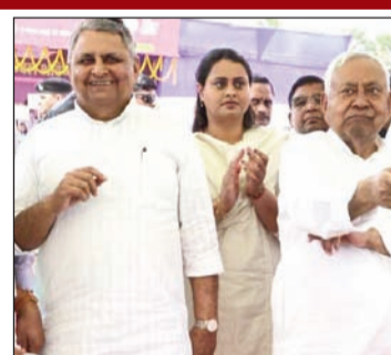
नवादा को दी 299 करोड़ की योजनाओं की सौगात

पटना (एनएसबी)। मुख्यमंत्री नीतीश कुमार ने बुधवार को समृद्धि यात्रा के क्रम में जमुई जिलान्तर्गत 27031.47 लाख रुपए की लागत से कुंडघाट जलाशय योजना का शिलान्यास अनावरण कर उद्घाटन किया। मुख्यमंत्री ने जमुई जिलान्तर्गत लघुआड में आयोजित कार्यक्रम स्थल से जिले के लिये 914 करोड़ रुपये की लागत से कुल 370 योजनाओं का रिमोट के माध्यम से शिलान्यास अनावरण कर उद्घाटन एवं शिलान्यास किया। इनमें 602 करोड़ रुपये की लागत से 181 योजनाओं का उद्घाटन एवं 312 करोड़ रुपये की लागत से 189 योजनाओं का शिलान्यास शामिल है।