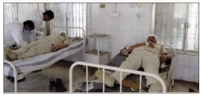
हिंसक झड़प में घायल पुलिसकर्मी।