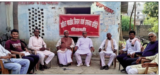
किसान सभा कार्यालय में आयोजित बैठक में उपस्थित किसान-मजदूर संगठनों के प्रतिनिधि।

सरदार भगत सिंह के शहादत दिवस 23 मार्च को साम्राज्यवाद विरोधी दिवस मनाने का निर्णय