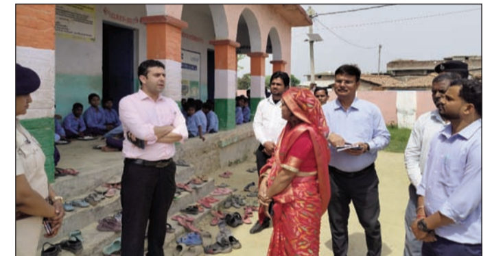
मध्य विद्यालय के निरीक्षण के दौरान आवश्यक निर्देश देते जिलाधिकारी व अन्य।

जाएगी। जनता की सेवाओं में शिथिलता किसी भी स्थिति में स्वीकार्य नहीं है।उनकी उपस्थिति का नियमित अनुश्रवण करने का निर्देश बीडीओ, सीओ एवं बीपीआरओ को दिया। कार्यक्रम को संबोधित करते हुए जिलाधिकारी ने स्पष्ट कहा कि प्रखंड एवं पंचायत स्तर पर कार्य संस्कृति में अपेक्षित सुधार दिखना चाहिए। उन्होंने कहा कि प्रशासनिक तंत्र सक्रिय और जवाबदेह बने। दायित्वों के निर्वहन में प्रतिबद्धता और पारदर्शिता स्पष्ट झलकनी चाहिए, तभी कौशल विकास, शिक्षा, रोजगार और स्वास्थ्य के क्षेत्रों में अपेक्षित प्रगति संभव है। कार्यक्रम में एसडीओ पुपरी, नोडल पदाधिकारी पुपरी, संबंधित बीडीओ, सीओ, एसडीपीओ, प्रखंड स्तरीय अन्य पदाधिकारी के साथ स्थानीय जन प्रतिनिधि भी उपस्थित थे।