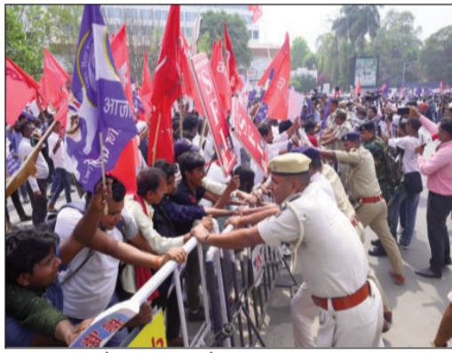
डाकबंगला चौराहे पर लगी बैरिकेटिंग को तोड़ते प्रदर्शनकारी।