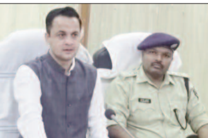
जानकारी देते डीएम एसपी ।

मधुबनी (एनएसबी)। जिले में ईद पर्व को शांतिपूर्ण, सौहार्द्रपूर्ण एवं भाईचारे के वातावरण में मनाने एवं इस अवसर पर जिले में विधिव्यवस्था संधारण को लेकर जिलाधिकारी अरविंद कुमार वर्मा एवं पुलिस अधीक्षक योगेंद्र कुमार द्वारा संयुक्त आदेश जारी किया गया है। जिसके तहत जिले के 432 स्थानों पर 864 दंडाधिकारी एवं पुलिस पदाधिकारी के साथ साथ काफी संख्या में पुलिस के जवानों की प्रतिनियुक्ति की गई है। डीएम ने सभी प्रतिनियुक्त पदाधिकारियों को समय प्रतिनियुक्ति स्थल पर पहुंच कर अपने दायित्व का निर्वहन करने का निर्देश दिया है। सभी दंडाधिकारी एवं पुलिस पदाधिकारी अपने-अपने प्रतिनियुक्ति स्थल पर उपस्थित होकर संयुक्त फोटो, व्हाट्सएप नम्बर पर भेजना सुनिश्चित करेंगे। जिलाधिकारी ने कहा है कि असामाजिक तत्वों पर कड़ी नजर रखें। शांति भंग करने वाले या कानून को हाथ में लेने वाले असामाजिक तत्वों पर तत्काल