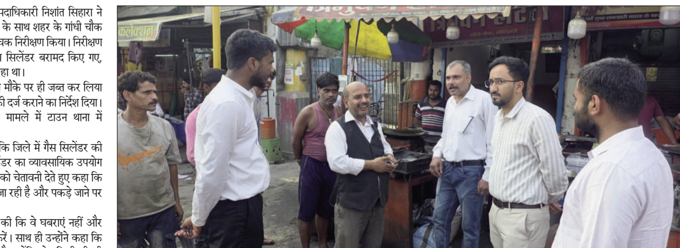
छापेमारी करते अधिकारी।