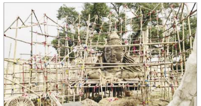
निर्माणाधीन गुफा का दृश्य।