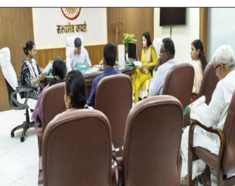
बैठक में शामिल डीएम, डीडीसी व अन्य।

सुपौल (एनएसबी)। जिला स्तरीय बैठक में शक्ति सदन से संबंधित विभिन्न महत्वपूर्ण बिंदुओं पर विस्तार पूर्वक समीक्षा की गई। विशेष रूप से महिलाओं के सुरक्षित आवासन, पुनर्वसन व्यवस्था, लाभार्थियों को प्रदान की जाने वाली वित्तीय सहायता, परामर्श सेवाएँ, सुरक्षा प्रबंधन तथा संस्थान के दैनिक संचालन की प्रगति पर गहन चर्चा की गई।