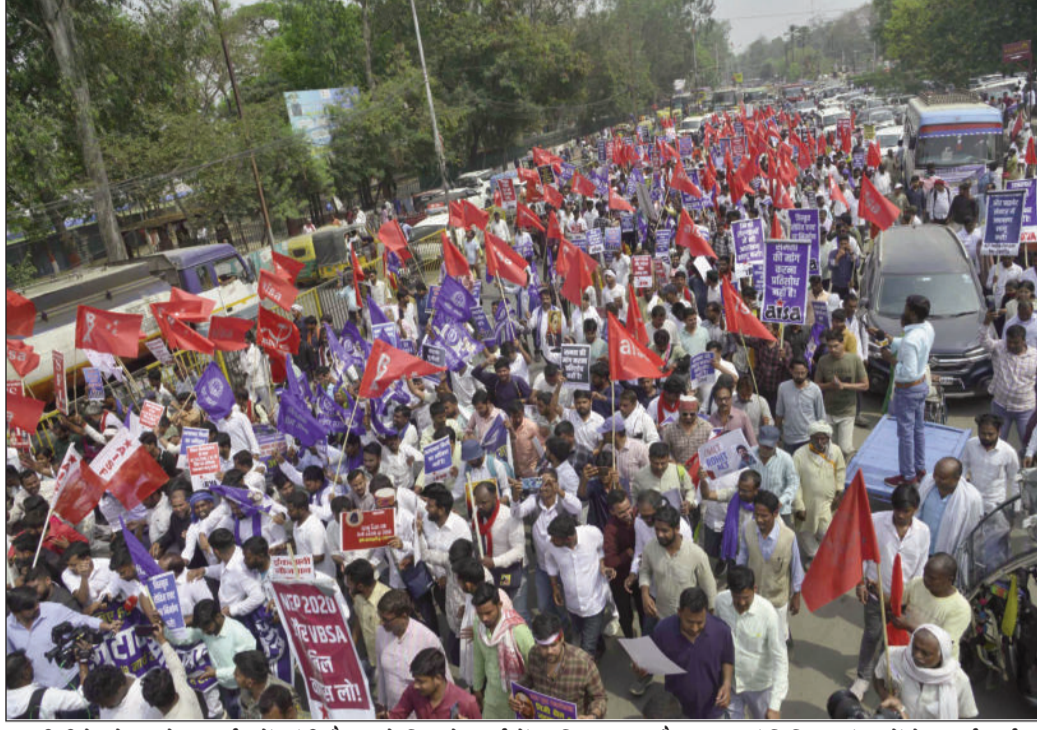
यूजीसी रेगुलेशन के समर्थन में गांधी मैदान से निकले मार्च में शामिल छात्र-नौजवान एवं विभिन्न संगठनों के कार्यकर्ता।

प्रदर्शनकारियों ने जेपी गोलंबर और डाकबंगला पर तोड़ा घेरा, कई गिरफ्तार