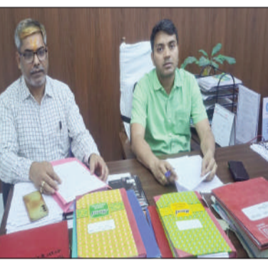
प्रेस कांफ्रेंस करते पदाधिकारी।

गया है, तथा अंग्रेज विधि सम्मत कार्रवाई की जा रही है। अबतक 16 गैस एजेंसियों एवं विभिन्न होटलों एवं प्रतिष्ठानों की जांच की गई है और जांच की कार्रवाई चल रही है।