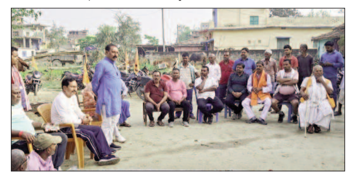
बैठक करते संस्था के लोग।

बैठक में निर्णय लिया गया कि वर्ष 2026 में जयनगर की रामनवमी को और अधिक भव्य और ऐतिहासिक रूप खारिज कर अपनी प्रक्रिया को सही बता रहा है। ऐसे में दोनों पक्षों के बीच संवाद और समाधान की आवश्यकता महसूस की जा रही है, ताकि पंचायत स्तर पर चल रही योजनाओं का लाभ समय पर आम जनता तक पहुंच सके।