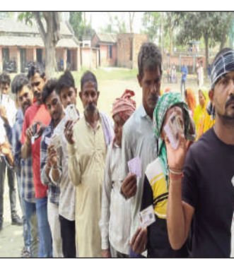
मतदान को कतारबद्ध मतदाता।

2575 में 1657 मतदाताओं ने अपने मताधिकार का प्रयोग कर अर्थार्थियों की किस्मत मतपेटों में बंद कर दी। वहीं शांतिपूर्ण माहौल में पैक्स में 1771 मत तारही भवानी पुर पैक्स में कुल 2575 में 1657 मतदाताओं ने अपने मताधिकार का प्रयोग कर अर्थार्थियों की किस्मत मतपेटों में बंद कर दी।