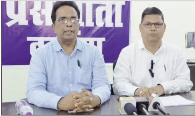
प्रेस वार्ता में जिला आपूर्ति पदाधिकारी एवं डीपीआरओ ।

दरभंगा जिले में रसोई गैस की कोई कमी नहीं है तथा उपभोक्ताओं के लिए पर्याप्त मात्रा में गैस सिलेंडर उपलब्ध है। जिला नियंत्रण कक्ष में प्राप्त शिकायतों का त्वरित निवारण संबंधित गैस एजेंसियों के माध्यम से कराया जा रहा है, ताकि उपभोक्ताओं को किसी प्रकार की असुविधा न हो। यदि किसी उपभोक्ता को गैस के संबंध में शिकाया शिकायत दर्ज करना है तो 06272 24 50 55 पर कर सकते हैं। अभी तक 300 से अधिक शिकायतें प्राप्त हुई हैं