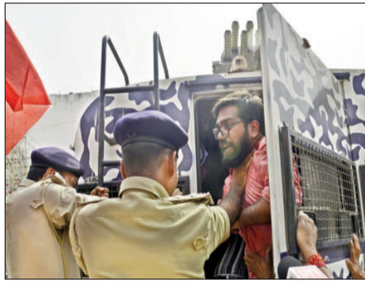
प्रदर्शनकारी को हिरासत में लेती पुलिस।

नवसंदेश ब्यूरो पटना। आज 74 आंदोलन के ऐतिहासिक दिवस पर पटना में यूजीसी रेगुलेशन 2026 के समर्थन और एससी-एसटी-ओबीसी-इबीसी तबकों के लिए 65 प्रतिशत आरक्षण लागू करने, संसद से रोहित एक्ट का निर्माण करने इत्यादि मांगों को लेकर ऑल इंडिया फोरम फॉर इक्विटी के बैनर तले गांधी मैदान से राजभवन मार्च आयोजित किया गया, जिसमें हजारों की संख्या में छात्र-नौजवान, सामाजिक एवं राजनीतिक कार्यकर्ता और विभिन्न जिलों से आए लोगों ने भाग लिया।