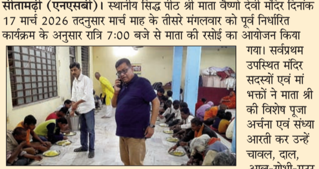
मंदिर अतिथि गृह में जरूरतमंदों को भोजन परोसेते श्रद्धालु ।

सीतामढ़ी (एनएसबी)। स्थानीय सिद्ध पीठ श्री माता वैष्णो देवी मंदिर दिनांक 17 मार्च 2026 तदनुसार मार्च माह के तीसरे मंगलवार को पूर्व निर्धारित कार्यक्रम के अनुसार रात्रि 7:00 बजे से माता की रसोई का आयोजन किया