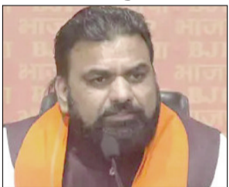
समृद्धि यात्रा के दौरान जमुई और नवादा पहुंचे सम्राट चौधरी

पटना (एनएसबी)। उपमुख्यमंत्री सम्राट चौधरी ने कहा कि राज्य में रोजगार सृजन और औद्योगिक विकास को गति देने के लिए जमुई जिले में 6 हजार करोड़ रुपये की लागत से स्टील प्लांट स्थापित करने की दिशा में काम किया जा रहा है। इसके साथ ही भीमबांध और कुंड घाट को इको टूरिज्म के रूप में विकसित किया जाएगा, जिससे क्षेत्र में पर्यटन और रोजगार के नए अवसर पैदा होंगे। वहीं नवादा में परमाणु ऊर्जा संयंत्र स्थापित करने की दिशा में काम किया जा रहा है।