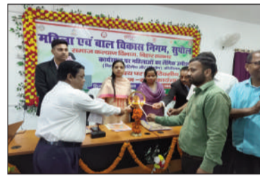
दीप प्रज्वलित कर कार्यक्रम का शुभारंभ करते पदाधिकारी।