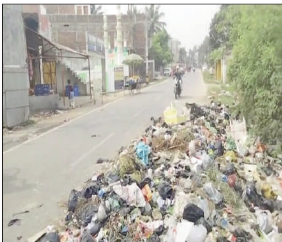
सड़क पर फैली गंदगी।

मायने रखती है, वहीं पास में ही इदगाह और मस्जिद भी है, जहाँ अल्पसंख्यक समाज का आगामी