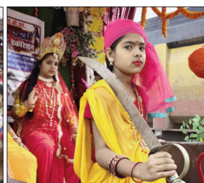
शहर में निकली शोभा यात्रा।

रोड, रामनगर मोड़ और करजाइन रोड होते हुए निर्धारित मार्ग से गुजरकर ठाकुरबाड़ी परिसर पहुंचकर संपन्न हुई। यात्रा के दौरान श्रद्धालुओं में भारी