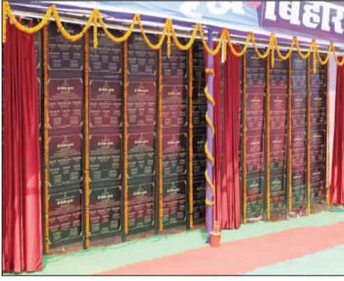
योजनाओं का शिलान्यास