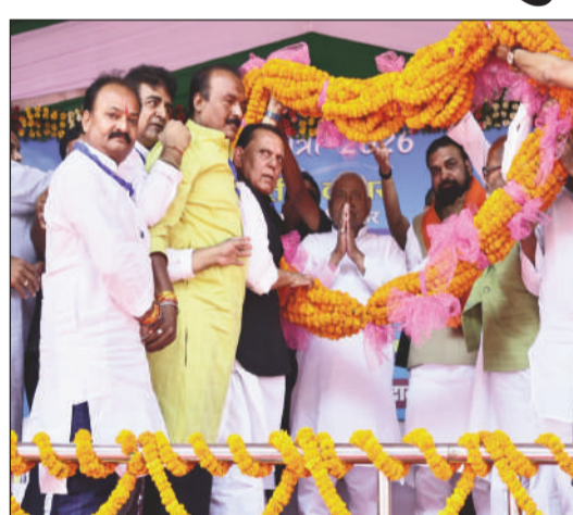
माला पहना कर मुख्यमंत्री का स्वागत करते लोग।

उन्होंने कहा कि गंगा का पानी बड़आ और खड़गपुर तक पहुंचाने की योजना पर काम चल रहा है, साथ ही डकरा नाला और सिंधवारे जलाशय योजना को भी तेजी से पूरा किया जाएगा। उन्होंने दावा किया कि अगले 5 वर्षों में