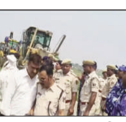
घटनास्थल पर पुलिस।

फतुहा (एनएसबी)। बिहार में बुनियादी ढांचे के विकास और किसानों के हितों के बीच का संघर्ष एक बार फिर सड़कों पर आ गया है। गुरुवार को दीदारगंज थाना क्षेत्र के सुकुलपुर और सेदनपुर के बीच भारत माला प्रोजेक्ट (आमस-दरभंगा 119 फोरलेन) के निर्माण को लेकर प्रशासन और स्थानीय किसानों के बीच तीखी झड़प हुई। तीन महीने के शांत अंतराल के बाद, जब जिला प्रशासन भारी पुलिस बल और बुलडोजर के साथ अधिगृहीत भूमि पर पहुंचा, तो स्थिति तनावपूर्ण हो गई।