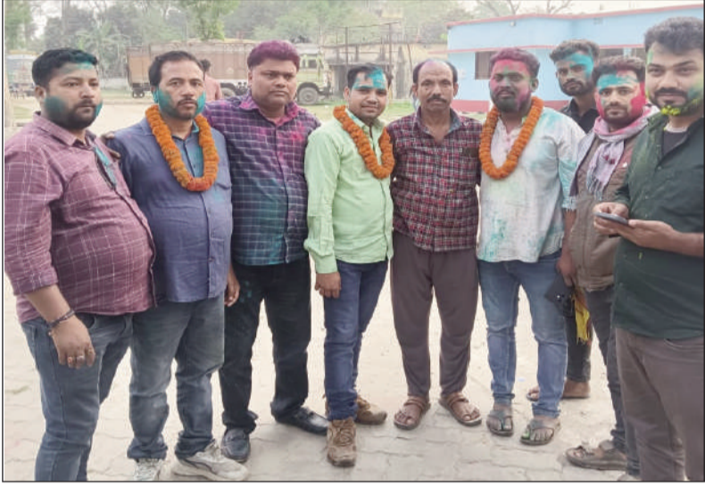
जीत का जश्न मनाते समर्थक।