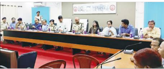
पर्व के मौके पर प्रतिनियुक्त पदाधिकारियों को संबोधित करते जिला प्रशासन के वरिष्ठ अधिकारी।

अफवाह या असामाजिक गतिविधि पर तत्काल कार्रवाई सुनिश्चित की जाएगी। कंट्रोल रूम एवं निगरानी व्यवस्था जिला स्तर पर नियंत्रण कक्ष 20 मार्च की सुबह छह बजे से 24 घंटे कार्यरत रहेगा। गोपरी अनुमंडल में भी नियंत्रण कक्ष स्थापित