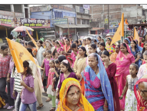
शहर में निकली शोभा यात्रा।

रामनवमी शोभा यात्रा समिति, नगर पंचायत सिमराही के तत्वाधान में निकली यह शोभा यात्रा ठाकुरबाड़ी परिसर से शुरू होकर एनएच-27 के रास्ते जेपी चौक पहुंची। वहां से यह यात्रा पिपराही रोड होते हुए एनएच-106 स्थित पेट्रोल पंप तक गई। इसके बाद यात्रा पुनः एनएच-106, जेपी चौक, हरिस्यल