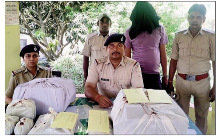
गिरफ्तारी की जानकारी देते पुलिस अधिकारी व अन्य ।

सीतामढ़ी (एनएसबी)। पुलिस ने ग्राहक सेवा केंद्र में छापेमारी कर अवैध रूप से आधार कार्ड बनाने के आरोप में एक व्यक्ति को गिरफ्तार किया है। मिली जानकारी के मुताबिक दिनांक 17.03.2026 को समय लगभग 16:00 बजे बेला थाना पुलिस टीम को गुप्त सूचना प्राप्त हुई कि ग्राम - चांदी रजवाड़ा, थाना- बेला में एक व्यक्ति द्वारा किए गए की दुकान में ग्राहक सेवा केंद्र संचालित कर अवैध रूप से धैरे लेकर आधार कार्ड बनाने का कार्य किया जा रहा है। सूचना के सत्यापन एवं त्वरित कार्रवाई करते हुए पुलिस टीम द्वारा उक्त दुकान में छापेमारी की गई। छापेमारी के दौरान कई आपत्तजनक सामग्रियां बरामद की गईं तथा एक व्यक्ति को मौके पर ही गिरफ्तार किया गया। पुलिस के अनुसार प्रारंभिक जांच में यह प्रतीत होता है कि उक्त व्यक्ति द्वारा अवैध तरीके से आधार से संबंधित कार्य किया जा रहा था। मामले में आगे एवं पीछे की जुड़ी कड़ियों का पता लगाया जा रहा है। इस