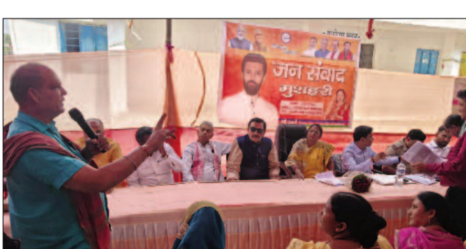
जन संवाद कार्यक्रम में अपनी शिकायत व परेशानी का बखान करते क्षेत्र के लोग।

मुजफ्फरपुर(एनएसबी)। लंबे समय से भ्रष्टाचार और पदाधिकारियों कर्मचारियों की मनमानी झेलते झेलते परेशान मुशहरी प्रखंड क्षेत्र के लोगों ने गुरुवार को क्षेत्रीय विधायक की पहल पर गुरुवार को मुशहरी प्रखंड मुख्यालय परिसर में आयोजित 'जन संवाद' कार्यक्रम में पदाधिकारियों और कर्मचारियों पर खूब भड़के। कार्यक्रम में हजारों की संख्या में भागीदारी के लिए पहुंचे लोगों ने अपनी समस्याओं को खुलकर रखते हुए प्रशासनिक लापरवाही और भ्रष्टाचार पर गंभीर सवाल उठाए। जन संवाद के दौरान सबसे अधिक शिकायतें अंचलाधिकारी मुशहरी एवं राजस्व कर्मचारियों के खिलाफ सामने आईं। लोगों ने खुले रूप में आरोप लगाया कि दारिद्र्य-खारिज एवं अन्य भूमि व राजस्व कार्यों के लिए खुलेआम पैसों की मांग की जाती है और बिना पैसों के यहां काम नहीं होता। जन संवाद के दौरान महिलाओं ने भी कहा कि उनकी समस्याओं को यहां कोई सुनने वाला नहीं है। प्रखंड कार्यालय में पैसा