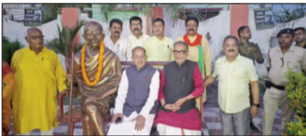
कार्यक्रम में उपस्थित लोग।