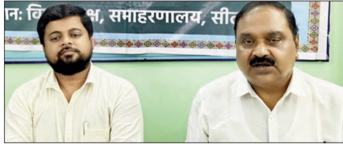
प्रेस वार्ता में एलपीजी सिलेंडर की उपलब्धता की जानकारी देते जिला आपूर्ति पदाधिकारी व अन्य।

सीतामढ़ी में एलपीजी सिलेंडर की कमी नहीं, हर घर तक पहुंच रही एलपीजी: जिला आपूर्ति पदाधिकारी