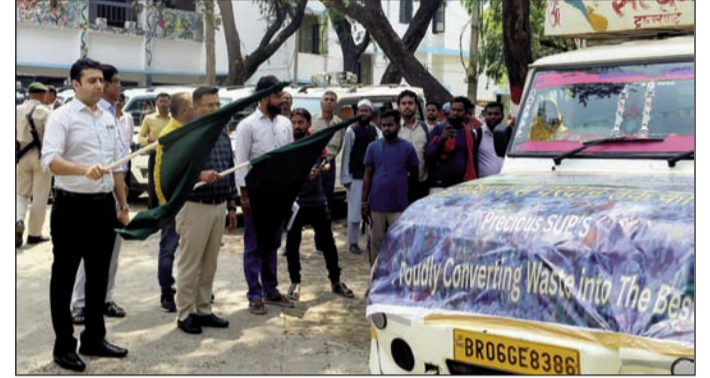
वाहनों को हरी झंडी दिखाकर रवाना करते डीएम व अन्य ।

प्लास्टिक वेस्ट मैनेजमेंट यूनिट में कचरे को वैज्ञानिक तरीके से कंप्रेस कर उसका वॉल्यूम कम किया जाएगा, जिससे उसके परिवहन एवं पुनर्चक्रण की प्रक्रिया अधिक सुगम हो सके। इसके