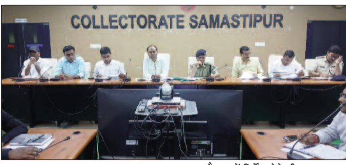
बैठक में निर्देश देते डीएम व अन्य।