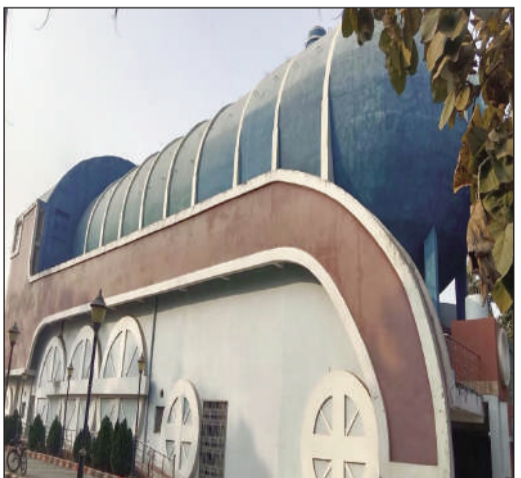
इरिमी संस्थान, जमालपुर।

इसके पहले इरिमी जमालपुर के प्रोफेसर वंदे भारत ट्रेन के स्पीड को बरकरार करने को लेकर प्रशिक्षण का आयोजन किया था।