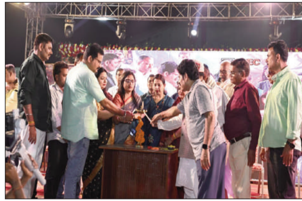
दीप प्रज्वलित करते नगर पंचायत अध्यक्ष।