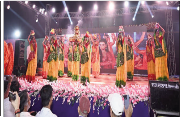
कला प्रस्तुत करते स्कूली बच्चे।

राधोपुर / सुपौल (एनएसबी)। प्रखंड अंतर्गत सिमराही स्थित पाटलिपुत्रा सेंट्रल स्कूल में बुधवार को विद्यालय के 25 वर्ष पूरे होने पर सिल्वर जुबली समारोह बड़े उत्साह और भव्यता के साथ आयोजित किया गया।