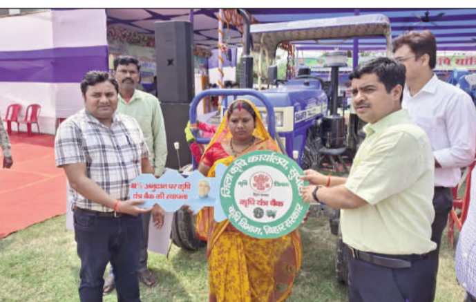
कृषि यंत्र की चाभी प्रदान करते डीएम।

डीएम ने जिला कृषि यांत्रिकरण मेला का किया शुभारंभ, कृषकों को नए तकनीक से अवगत कराने का दिया निर्देश