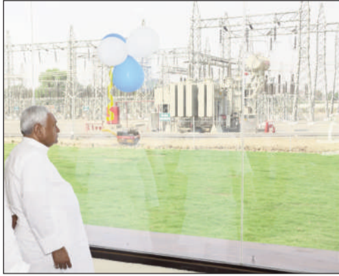
कजरा सोलर पावर प्लांट।

मुख्यमंत्री ने लखीसराय स्थित कजरा सोलर पावर प्लांट का विशेष निरीक्षण किया।