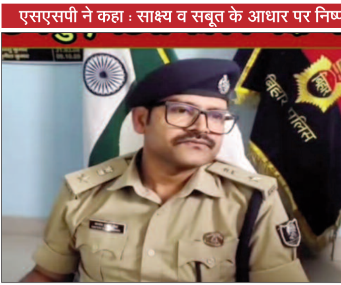
गायघाट मामले को लेकर प्रेस कॉन्फ्रेंस को संबोधित करते एसएसपी।