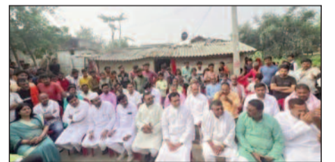
मृतक ग्रामीण के शोककुल परिजनों से मिलने पहुंची राजद की टीम।

मामले की निष्पक्ष एवं उच्चस्तरीय जांच कराते हुए स्पीडी ट्रायल के माध्यम से दोषी को कड़ी सजा दिलाने की मांग की गई। साथ ही राजद नेताओं ने पीड़ित परिवार को उचित मुआवजा और सुरक्षा उपलब्ध कराने की भी मांग उठाई। इस घटना को लेकर इलाके में आक्रोश का माहौल है। परिजनों और स्थानीय लोगों का आरोप है कि गायघाट थानाध्यक्ष द्वारा ही इस जघन्य वारदात को अंजाम दिया गया, जिसे लेकर कानून-व्यवस्था पर गंभीर सवाल खड़े हो रहे हैं। घटना की सूचना