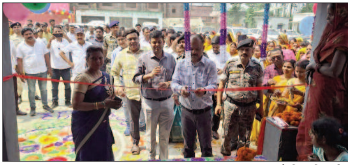
उद्घाटन करते जिलाधिकारी।