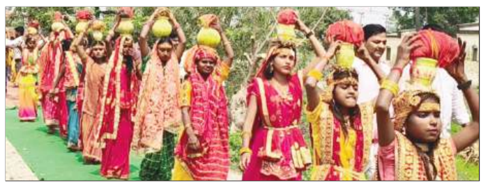
कलश शोभायात्रा में शामिल महिलाएं।

कार्यक्रम के दौरान सुरक्षा, यातायात व्यवस्था एवं आमजन की सुविधा हेतु समुचित प्रबंध किए गए हैं।