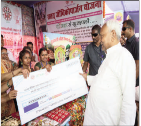
जीविका दीदी को चेक सौंपते सीएम।

अतिथि उपस्थित रहे। उद्घाटन के पश्चात मुख्यमंत्री ने एक विशाल जनसभा को संबोधित किया, जिसमें 5 हजार से अधिक जीविका दीदियों ने हिस्सा लिया। अंत में विभागीय समीक्षा बैठक कर मुख्यमंत्री पटना के लिए रवाना हो गए।