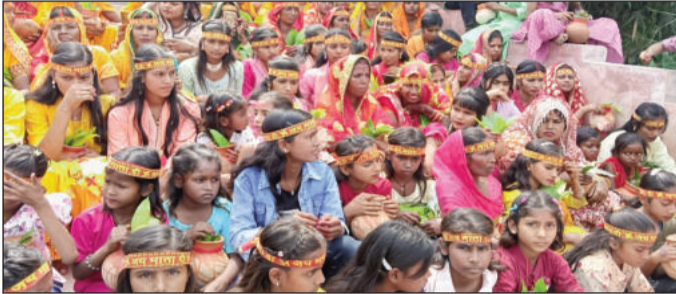
पूजा में उपस्थित श्रद्धालु।