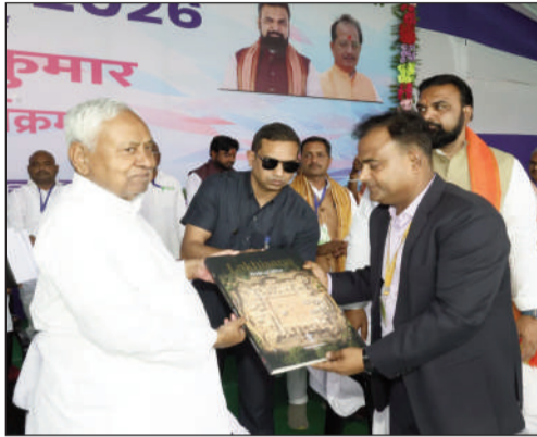
सोएम को काँपी टेबुल बुके लखीसराय डीएस।

मुख्यमंत्री ने कुल 118 करोड़ रुपये की लागत वाली 117 योजनाओं का उद्घाटन किया, जबकि 208 करोड़ रुपये की लागत से बनने वाली 144 नई योजनाओं का शिलान्यास भी किया। यात्रा के दौरान