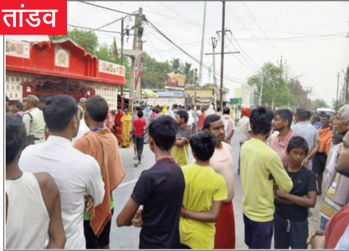
घटना के बाद मौका ए वारदात पर जुटे लोग।