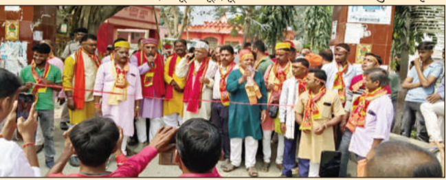
कलश शोभायात्रा में भाग लेते श्रद्धालु।