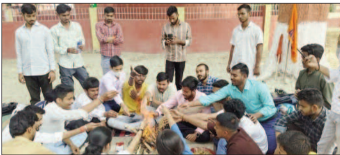
कॉलेज परिसर में सदबुद्धि हवन यज्ञ करते कॉलेज के आंदोलनकारी छात्र गण।

कॉलेज प्रशासन की सदबुद्धि के लिए छद्मे दिन किया हवन यज्ञ