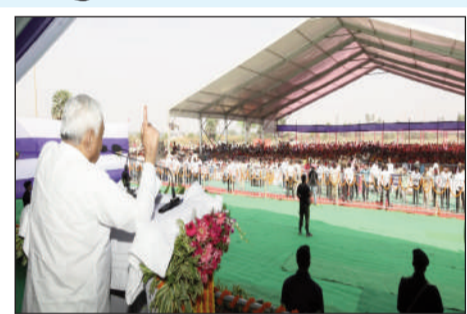
संबोधित करते सीएम।

समीक्षा के दौरान मुख्यमंत्री ने अधिकारियों को स्पष्ट निर्देश दिया कि जिन योजनाओं की स्थिति दी जा चुकी है, उनके क्रियान्वयन में तेजी लाई