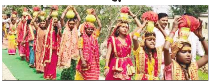
कलश शोभायात्रा में शामिल महिलाएं।

खगड़िया (एनएसबी)। सदर प्रखंड क्षेत्र के रानी सकरपुरा गांव में उत्साह और भक्ति का अद्भुत संगम देखने को मिला जब श्रीश्री 108 राम जानकी मेला का शुभारंभ 651वीं कलश शोभा यात्रा के साथ हुआ। यात्रा राम जानकी मंदिर से प्रारंभ होकर छोटी रानीसकरपुरा, मिडिल स्कूल, स्टेशन रोड और गांव की हर गली से होते हुए पुनः राम जानकी परिसर में समाप्त हुई। यात्रा के दौरान ग्रामीणों ने जगह-जगह श्रद्धालुओं के लिए लस्सी, ग्लूकोज पानी और उठे पानी की व्यवस्था की। युवाओं और ग्रामीणों में विशेष जोश देखने को मिला। इस दौरान जय श्री राम के नारों से पूरा गांव भक्ति में सराबोर हो गया। कलश शोभा यात्रा का उद्घाटन राम जानकी