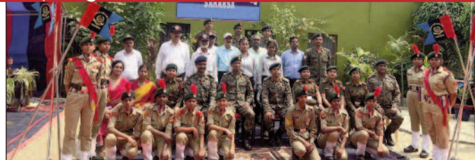
ग्रुप कमांडर का स्वागत करते कैडेट्स।