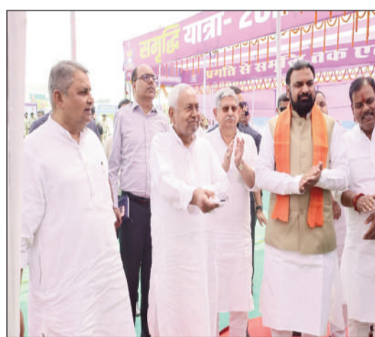
योजनाओं का उद्घाटन व शिलान्यास करते मुख्यमंत्री।

बिहार को विकसित राज्यों की श्रेणी में खड़ा किया जाएगा और जनता से एनडीए को समर्थन देने की अपील की। उपमुख्यमंत्री सम्राट चौधरी ने कहा कि 2005 से पहले बिहार की स्थिति खराब थी, लेकिन आज राज्य तेजी से विकास कर रहा है। उन्होंने बताया कि बजट