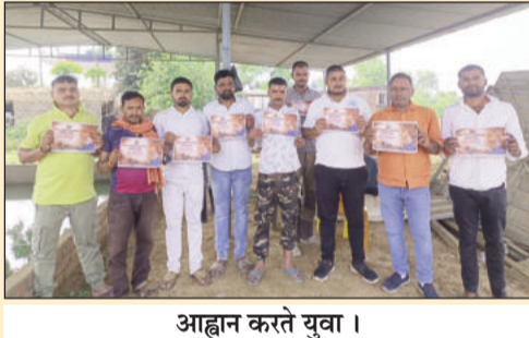
आह्वान करते युवा ।

लखीसराय (एनएसबी)। आगामी 22 मार्च 2026 को पटना के बापू सभागार में आयोजित होने वाले 'लेट्स इन्स्पायर बिहार' के पंचम वार्षिकोत्सव समारोह की तैयारियों को लेकर लखीसराय चैप्टर की एक महत्वपूर्ण बैठक आयोजित की गई।