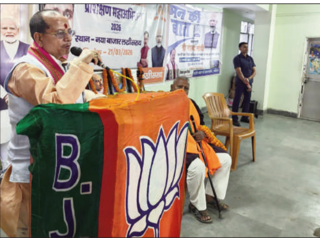
संबोधित करते बिहार के उपमुख्यमंत्री विजय कुमार सिन्हा।

इस अवसर पर कार्यकर्ताओं में जोश भरते हुए उपमुख्यमंत्री विजय कुमार सिन्हा ने कहा कि भारतीय जनता पार्टी केवल एक राजनीतिक दल नहीं, बल्कि एक सशक्त विचारधारा है। उन्होंने जोर देते हुए कहा कि प्रशिक्षित कार्यकर्ता ही संगठन की वास्तविक शक्ति होते हैं। भाजपा एक कैडर आधारित पार्टी है, जहाँ कार्यकर्ताओं