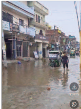
जलजमाव का दृश्य।

सहरसा (एनएसबी)। जिले के सिमरी बख्तिवारपुर नगर परिषद क्षेत्र में देर रात हुई पहली बारिश ने नगर प्रशासन की कार्यप्रणाली पर सवाल खड़े कर दिए हैं। मुख्य बाजार मार्ग पर शर्मा चैक के पास भारी जलजमाव हो गया है, जिससे आसपास के घरों में पानी घुस गया और लोगों को भारी परेशानी का सामना करना पड़ा। डाक बंगला चैक से मुख्य बाजार की ओर जाने वाले लोगों को घुटने पर पानी से होकर गुजरना पड़ा। बारिश रुकने के कई घंटे बाद भी नगर प्रशासन का ध्यान पानी की निकासी पर नहीं गया। जलजमाव का मुख्य कारण शर्मा चैक से डाक बंगला चैक के बीच नवनिर्मित सड़क की ऊंचाई और सड़क के दोनों ओर नालों का अधूरा निर्माण बताया जा रहा है। इससे पानी की निकासी बाधित हो गई है, जिसके चलते बारिश का पानी सड़कों पर जमा होकर घरों में घुस रहा