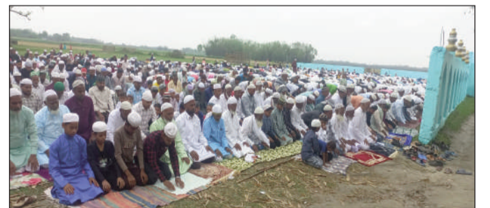
नमाज अदा करते रोजेदार।