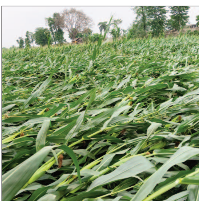
खेत में बिछी फसल।

प्रखंड के कई गांवों में शुक्रवार शाम तेज हवा के साथ शुरू हुई बारिश ने देखते ही देखते विकराल रूप ले लिया। जिस कारण खेतों में पानी भर गया, और तैयार खड़ी गेहूँ और मकई की फसलें जमीन पर बिछ गईं। किसानों का कहना है कि कटाई के मुहाने पर पहुंच चुकी गेहूँ की फसल को सबसे अधिक नुकसान हुआ है। तेज हवा और बारिश से बालियां झुक गईं, जिससे उपज पर