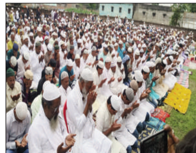
नमाज अदा करते रोजेदार।

नमाज के बाद लोगों ने एक-दूसरे से गले मिलकर ईद की मुबारकबाद दी। बच्चों और युवाओं में खासा उत्साह देखने को मिला। सिमराही बाजार, राधेपुर, गद्दी, हुलास, गनपतगंज, रामविशुनपुर, परमानंदपुर, डुमरी और धर्मपट्टी समेत कई इलाकों में लोग सुबह से ही नए कपड़े पहनकर ईदगाहों की ओर जाते नजर आए। मस्जिदों और ईदगाहों को आकर्षक ढंग से सजाया गया था, जिससे पूरे क्षेत्र में त्योहार का खुशनुमा माहौल बना