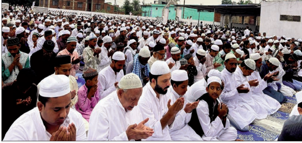
रहमानिया ईदगाह मेहसौल पूर्वी में ईद की नमाज पढ़ते मुस्लिम भाई।

सीतामढ़ी (एनएसबी)। जिले में शनिवार को ईद-उल-फितर का त्योहार पूरे उत्साह, उल्लास और शांतिपूर्ण माहौल में मनाया गया। शुरुआत शाम चांद नजर आते ही मुस्लिम समुदाय में खुशी की लहर दौड़ गई और लोग ईद की तैयारियों में जुट गए। बाजारों में रौनक बढ़ गई, जहां सेवई, इत्र, कपड़े और अन्य सामानों की खरीदारी को लेकर भारी भीड़ देखने को मिली। शनिवार सुबह लोगों ने नए वस्त्र धारण कर ईदगाहों और मस्जिदों में नमाज अदा की। शहर के प्रमुख ईदगाहों में हजारों की संख्या में लोगों ने एक साथ नमाज पढ़कर देश में अमन-चैन और तरक्की की दुआ मांगी। नमाज के बाद लोगों ने एक-दूसरे को गले लगाकर ईद की मुबारकबाद दी। बच्चों