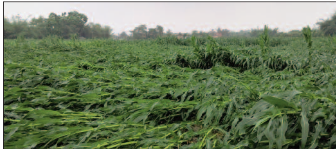
फोटो कैप्शन: 8 गेहू व मक्का भारी तबाही।

बनमा ईटहरी (सहरसा) (एनएसबी)। प्रखंड में शुक्रवार देर शाम आई तेज आंधी और बारिश ने जनजीवन को पूरी तरह अस्त-व्यस्त कर दिया है। बंगाल की खाड़ी में बने निम्न दबाव के कारण अचानक बदले मौसम ने ग्रामीण इलाकों में भारी तबाही मचाई है। शाम करीब 7:30 बजे तेज हवाओं के साथ बारिश शुरू हुई, जिसमें हवा की रफ्तार 70 किलोमीटर प्रति घंटे से अधिक रही और 15 एमएम से ज्यादा वर्षा दर्ज की गई। ईटहरी में टाट फूस के बने घर गिर गये। 100 मीटर की दूरी पर चट्टा जा गिरा है। गनीमत रही कि इस घटना में कोई हताहत नहीं हुआ, लेकिन संपत्ति का नुकसान पहुंचा है। अन्य पंचायतों में भी कईयों के छप्पर उड़े आंधी का असर इतना तेज था कि मनिया, सुपमा, बहुअरबा, परसबनी, चौददौर, ईटहरी, रसलपुर, सरबेला, तरहा, मकदमपुर, मुरली, कासीपुर समेत अन्य जगहों पर कई किसानों के मक्का की फसल पूरी तरह से क्षतिग्रस्त हो गई। इस प्राकृतिक आपदा से आमूमन खेतों में फसल बर्बाद हो गई, वहीं गेहूं का आकलन किया जा रहा है। अभी नहीं बता सकते की कितनी हेक्टेयर में मक्का व अन्य फसल बर्बाद हुआ है। रिपोर्ट आने पर विभाग को भेजा जाएगा।