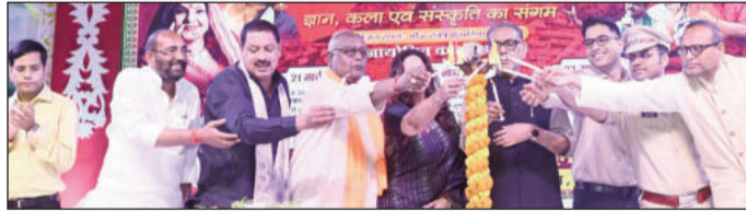
कार्यक्रम का उद्घाटन करते अतिथि।