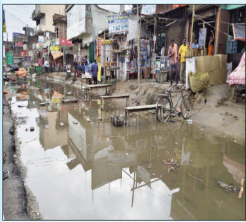
दुकान के सामने जमा बारिश का पानी।

राधेपुर (सुपौल) (एनएसबी)। प्रखंड के अंतर्गत नगर पंचायत सिमराही में इन दिनों जलजमाव की गंभीर समस्या उत्पन्न हो गई है, जिससे दर्जनों दुकानदारों का रोजगार ठप पड़ गया है। बोते शाम आई तेज आंधी और घंटों हुई बारिश ने नगर पंचायत की व्यवस्थाओं की पील खोलकर रख दी है। खासकर एनएच-27 के किनारे हालात और भी बदतर हो गए हैं। स्थानीय लोगों के अनुसार, एनएच-27 के किनारे सर्विस रोड निर्माण को लेकर कुछ समय पहले खुदाई कार्य शुरू किया गया था। लेकिन निर्माण कार्य को बीच में ही अधूरा छोड़ दिया गया। न तो सर्विस रोड का निर्माण पूरा किया गया और न ही