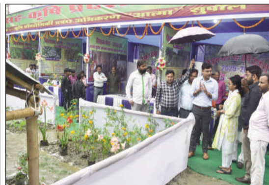
उप विकास आयुक्त, जनप्रतिनिधि एवं अन्य अतिथियों ने सभी स्टालों का निरीक्षण बारीकी से करते हुए कृषकों एवं प्रसार कर्मियों से स्टल से संबंधित विषय के बारे में जानकारी प्राप्त किया।

उप विकास आयुक्त, जनप्रतिनिधि एवं अन्य अतिथियों द्वारा सभी स्टालों का निरीक्षण बारीकी से करते हुए