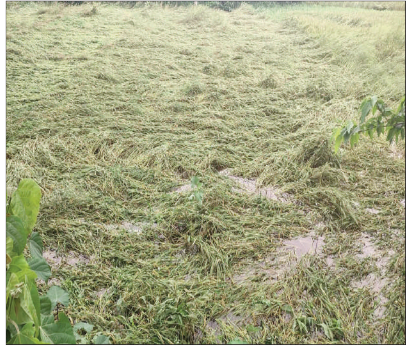
जमीन पर गिरे गेहूँ की फसल।

पिपरा प्रखंड के कई गांव इस प्राकृतिक आपदा की चपेट में आए हैं, किसानों ने पूरे वर्ष मेहनत करके जो फसल तैयार की थी, वह रातों-रात बर्बाद हो गया, जिससे किसानों के सामने गंभीर आर्थिक संकट खड़ा हो गया है। किसानों ने सरकार और संबंधित विभाग से मांग करते हुए कहा है कि प्रभावित क्षेत्रों को तुरंत जांच कराई जाए और किसानों को उनकी बर्बाद हुई फसल का उचित मुआवजा दिया जाए। साथ ही सुपौल जिला को प्राकृतिक आपदा प्रभावित क्षेत्र घोषित कर किसानों को जल्द से जल्द राहत प्रदान की जाए। इस अप्रत्याशित बारिश और आंधी ने किसानों की स्थिति बेहद खराब कर दी है। ऐसे में सरकार को तुरंत हस्तक्षेप करते हुए किसानों को आर्थिक सहायता और राहत मुहैया कराने की आवश्यकता है ताकि उन्हें इस कठिन परिस्थिति से उबरने में मदद मिल सके।