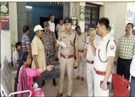
एसडीपीओ को जानकारी देते अगवा हुई लड़की के माता-पिता।