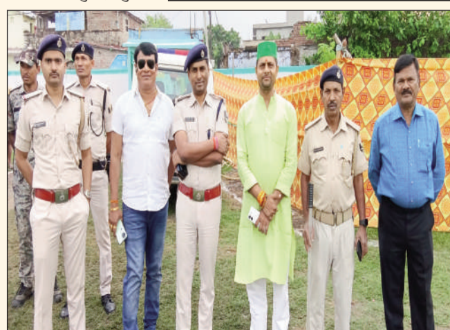
ईदगाह परिसर में अलर्ट पुलिस प्रशासन ने।