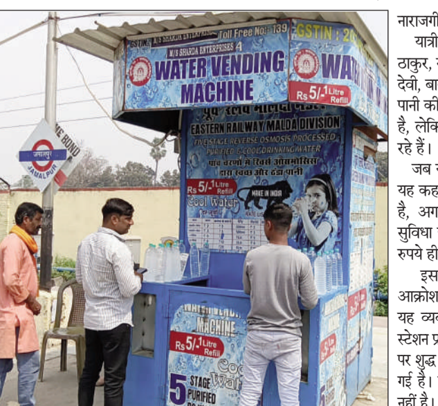
पानी के नाम पर यात्रियों से अधिक रूप लेते वैंडर।

जमालपुर (एनएसबी)। मार्च महोत्सव में ही मॉडल स्टेशन जमालपुर पर पानी के लिए हाहाकार मचा है। यात्रियों को शुद्ध पेयजल नसीब नहीं हो रहा है। स्टेशन प्रशासन ने शुद्ध पेयजल के लिए वैंडर्स द्वारा राशि पर मुहैया कराया जा रहा है। लेकिन अतिरिक्त राशि वसूलने की शिकायत यात्रियों ने शुरू कर दी है। प्लेटफार्म संख्या - 1 और 4 मुंगेरिया प्लेटफार्म के बीच में एक पानी का वैंडर यात्रियों को दो रुपये अधिक वसूल करते पाया गया है। इससे यात्रियों खासा