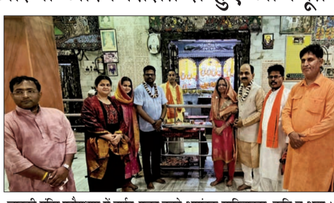
जानकी मंदिर पुनौराधाम में दर्शन-पूजन करते आंगतुक साहित्यकार, कवि व अन्य ।