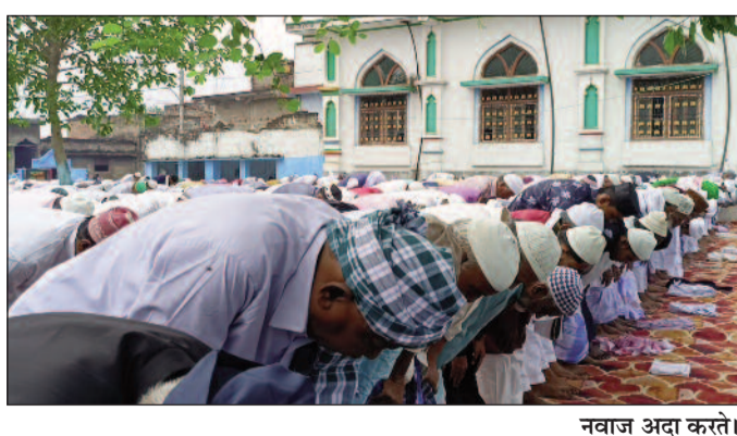
नवाज अदा करते।

जयनगर (एनएसबी)। शनिवार को जयनगर अनुमंडल क्षेत्र में ईद-उल-फितर का पर्व पूरे हर्षोल्लास, उत्साह और भाईचारे के साथ मनाया गया। सुबह से ही शहर से लेकर ग्रामीण क्षेत्रों तक ईद की रौनक देखने को मिली। विभिन्न इंदगाहों और मस्जिदों में नमाजियों की भारी भीड़ उमड़ी और लोगों ने एकजुट होकर अल्लाह की इबादत की। निर्धारित समयानुसार सुबह 7:00 बजे से 8:45 बजे के बीच विशेष नमाज अदा की गई, जिसमें देश में अमन-चैन, खुशहाली, तरक्की और आपसी सौहार्द के लिए दुआ मांगी गई। जयनगर के प्रमुख नमाज स्थलों में शहरी क्षेत्र के भेलवा चौक स्थित नूरी जामा मस्जिद, बलडिडा, इस्लामपुर मुहल्ला, थाना टोला, राजपुलाना मुहल्ला, यूनिशन टोला, मारवाड़ी मुहल्ला एवं ईंदगाह टोला शामिल रहे। इसके अलावा ग्रामीण क्षेत्रों में कोरहिया, बेला, पचहर, देवधा, बरही और बैरा समेत अन्य गांवों की मस्जिदों में भी मुस्लिम समुदाय के लोगों ने बड़ी संख्या में नमाज अदा की। हर जगह शांति, अनुशासन और धार्मिक आस्था का अद्भुत संगम देखने को मिला।