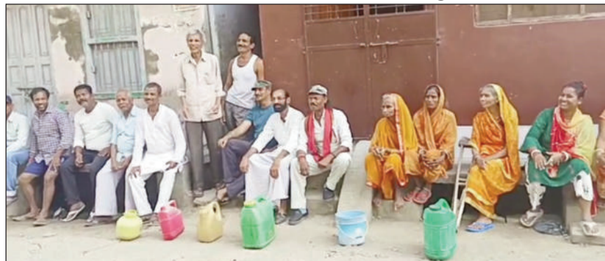
पानी के लिथ सड़क किनारे बैठे महादलित परिवार।

एक तरफ नगर परिषद अपने सैकड़ों करोड़ों रुपए के बजट से शहर के विकसित होने का दावा कर रही है वहीं शहर के बाजार क्षेत्र में ही मूलभूत बुनियादी सुविधाओं के घोर अभाव रहने से सारे दावे के पोल