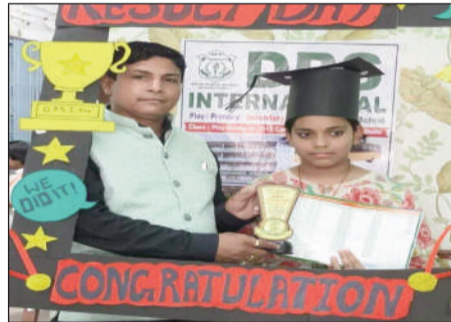
डीपीएस इंटरनेशनल स्कूल, आरा।

डीपीएस इंटरनेशनल स्कूल, आरा में सत्र 2025-26 का वार्षिक परीक्षा परिणाम बड़े ही उत्साह और गरिमापूर्ण वातावरण में घोषित किया गया। इस अवसर पर विद्यालय परिसर में रिजल्ट डे सेलिब्रेशन 2026 का आयोजन किया गया, जिसमें विद्यार्थियों, अभिभावकों एवं शिक्षकों को उत्साहपूर्ण उपस्थिति रही। कार्यक्रम के दौरान मेधावी छात्रों को ट्रफी, मेडल एवं प्रमाण पत्र देकर सम्मानित किया गया। कक्षा अनुसार प्रथम,द्वितीय एवं तृतीय स्थान प्राप्त करने वाले छात्रों को विशेष पुरस्कार प्रदान किए गए। विद्यालय प्रबंधन द्वारा सभी सफल विद्यार्थियों को उज्वल भविष्य के लिए शुभकामनाएं दी गईं।