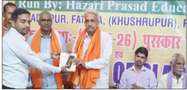
नव ज्ञान कनॅट आदित्यपुर का वार्षिकोत्सव।