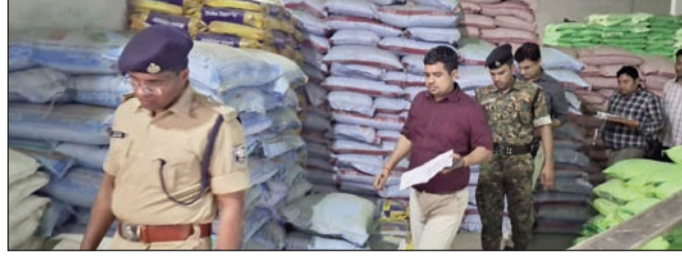
उर्वरक जांच करते डीएम-एसपी।

निरीक्षण के दौरान उर्वरकों की उपलब्धता, भंडारण व्यवस्था, स्टॉक पंजी, वितरण प्रणाली एवं निर्धारित दरों पर बिक्री की स्थिति की गहन जांच की गई। अधिकारियों द्वारा यह