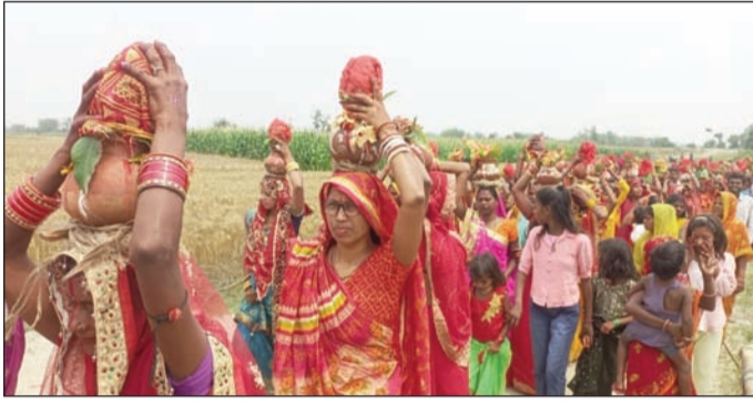
कलश यात्रा में शामिल महिला व पुरुष श्रद्धालु

पिपरा में चार दिवसीय भगैत महासम्मेलन को लेकर निकली कलश यात्रा