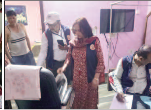
कागजात की जांच करते इओयू टीम