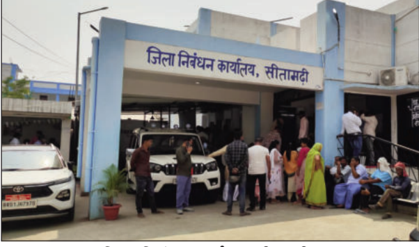
जिला निबंधन कार्यालय, सीतामढ़ी।

सीतामढ़ी (एनएसबी)। जिले में 1 अप्रैल से जमीन और मकान के सर्किल रेट (एमवीआर) में संभावित बढ़ोतरी की खबरों ने जमीन के बाजार को पूरी तरह गरमा दिया है। नए वित्तीय वर्ष के लागू होने से पहले लोग पुरानी दरों पर ही अपनी संपत्तियों का निबंधन कराने के लिए 'आखिरी दौड़' लगा रहे हैं। आज 31 मार्च की रात 8:00 बजे तक जिला निबंधन कार्यालयों में भारी भीड़ देखी गई और अधिकारी व कर्मचारी फाइलों को निपटाने में जुटे रहे। खरीदारों में इस बात का गहरा डर है कि यदि वे आज रजिस्ट्री नहीं कराते हैं, तो कल से उन्हें बड़े हुए दरों के कारण अतिरिक्त राशय का भारी बोझ उठाना पड़ेगा। इसी आर्थिक चपत से बचने के लिए लोग आनन-फानन में सौदे पक्के कर रहे हैं और पिछले कई दिनों से निबंधन कार्यालयों में आवेदकों का हुजूम उमड़ रहा है। निबंधन कार्यालयों की स्थिति यह है कि सुबह 10