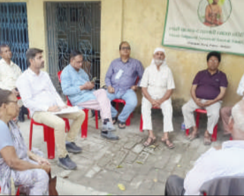
बाँठ करतें संयुक्त किसान मोर्चा बिहार के नेता।