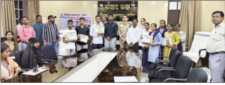
छात्र-छात्राओं को सम्मानित करते जिलाधिकारी।