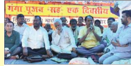
कटाव से बचाव के लिए उपवास पर बैठे ग्रामीण।

सर्वप्रथम हजारों महिलाओं ने गंगा पूजन कर गंगा मां से प्रार्थना की कि हे गंगा मां अब यहां से लौट जाइए तथा हमारे घर परिवार और खेत को सुरक्षित रहने दीजिए। सभी कटाव पीड़ित परिवारों ने सरकार से आग्रह किया कि दियारा क्षेत्र को बचाने के लिए यथाशीघ्र 14 किलोमीटर का बंडाल निर्माण करें, जिससे खगड़िया, बेगूसराय, मुंगेर के पांच पंचायत रघुनाथपुर बरारी, टीकारामपुर, मध्य रहीमपुर, उत्तरी रहीमपुर और दक्षिणी