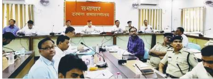
बैठक में मौजूद प्रभारी सचिव, जिलाधिकारी व अन्य अधिकारी।