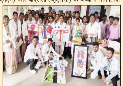
शारीरिक संरचना की विज्ञान प्रदर्शनी का आयोजन।

आरा (एनएसबी)। अनाईट में स्थित इंस्टीट्यूट इंस्टीट्यूट ऑफ कोचिंग ट्रेनिंग में विज्ञान प्रदर्शनी (शारीरिक संरचना की विज्ञान प्रदर्शनी) का आयोजन किया गया जिसमें एडोथ (एनएम) जोएनएम (जोएनएम) और बीएससी (बीएससी) के बच्चों ने भाग लिया और शरीर के अंगों का नामना तैयार कर चित्रित किया। जिसमें मानव पाचन तंत्र (मानव पाचन तंत्र), मानव हृदय (मानव हृदय), मानव संचार प्रणाली (मानव परिसंचरण) शामिल थे। प्रणाली) गर्भाशय (गर्भाशय), फेफड़ा (फेफड़े), श्वास तंत्र (श्वसन प्रणाली), जैव-चिकित्सा अपशिष्ट प्रबंधन (बायोमेडिकल अपशिष्ट प्रबंधन) आदि के आदर्श थे।