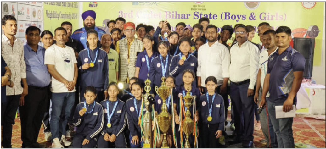
ट्रॉफी के साथ विजय टीम।