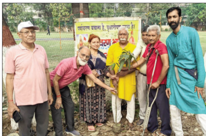
वृक्षारोपण करते लोग।

देशवासियों को जागरूक करते हुए कहा कि भारत की 140 करोड़ से अधिक की जनसंख्या यदि अपने जन्म दिन पर केवल एक