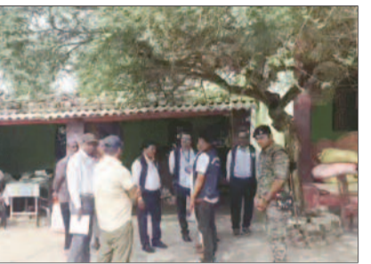
एसी घर के बाहर कुछ सुरक्षा कर्मी।

अपने लंबे कार्यकाल के दौरान उन्होंने अधिकतर समय सीमांचल के चार जिलों किशनगंज, अररिया, पूर्णिया और कटिहार में ही सेवा दी। बताया जा रहा है कि छापेमारी के दौरान कई जमीन के कागजात, बैंक खातों की जानकारी, निवेश के दस्तावेज, महंगी गाड़ियां और सोने-चांदी के आभूषण से संबंधित दस्तावेज बराबद किए गए हैं। टीम उनके परिजनों और करीबी लोगों के नाम पर खरीदी गई संपत्तियों की भी जांच कर रही है। प्रारंभिक जांच में कई शहरों में प्लॉट, मकान और व्यावसायिक संपत्ति होने की बात सामने आई है। आर्थिक अपराध इकाई के अधिकारियों का कहना है कि सभी दस्तावेजों की जांच की जा रही है। आय के स्रोत और संपत्ति के बीच अंतर का आकलन किया जा रहा है। अगर आरोप से अधिक संपत्ति का मामला साबित होता है, तो उनके खिलाफ भ्रष्टाचार निवारण अधिनियम के तहत मामला दर्ज किया जाएगा। सहरसा के