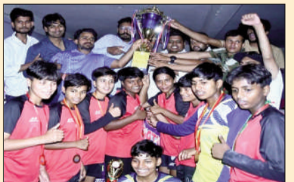
महिला फुटबल टूर्नामेंट का आयोजन।