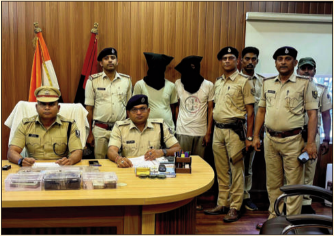
गिरफ्तारी की जानकारी देते पुलिस अधीक्षक एवं उपस्थित अन्य।