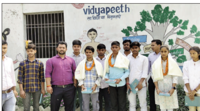
सम्मानित होते सफल छात्र।