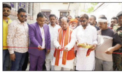
पीता काटते डिप्टी सीएम।