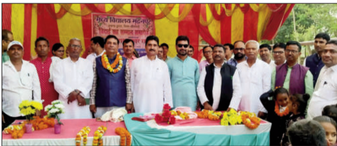
विदाई सह सम्मान समारोह में सेवानिवृत्त प्रधानाध्यापक, शिक्षक संघ के वरिष्ठ नेता व अन्य।