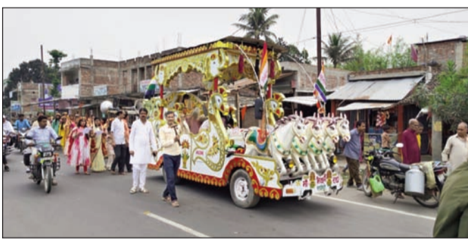
शोभा यात्रा में शामिल श्रद्धालु व अन्य ।

गनपतगंज में महावीर जयंती पर निकली भव्य शोभायात्रा, सामाजिक एकता और आस्था का दिखा संगम