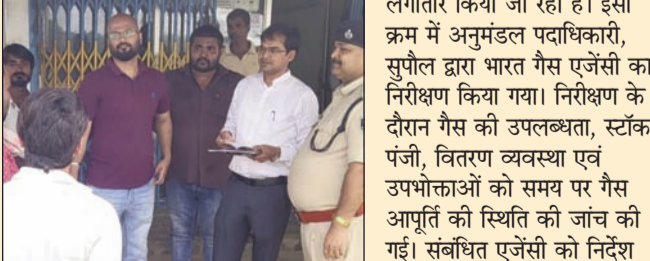
जांच पड़ताल करते एसडीएम

सुपौल (एनएसबी)। जिले में घरेलू एलपीजी गैस की आपूर्ति को सुचारू एवं पारदर्शी बनाए रखने के उद्देश्य से विभिन्न गैस एजेंसियों का निरीक्षण लगातार किया जा रहा है। इसी क्रम में अनुमंडल पदाधिकारी, सुपौल द्वारा भारत गैस एजेंसी का निरीक्षण किया गया। निरीक्षण के दौरान गैस की उपलब्धता, स्टॉक पंजी, वितरण व्यवस्था एवं उपभोक्ताओं को समय पर गैस आपूर्ति की स्थिति की जांच की गई। संबंधित एजेंसी को निर्देश दिया गया कि उपभोक्ताओं को किसी प्रकार की असुविधा न हो