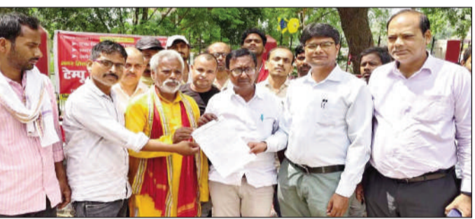
धरना स्थल पर डीसीएलआर ने मांग पत्र लिया।