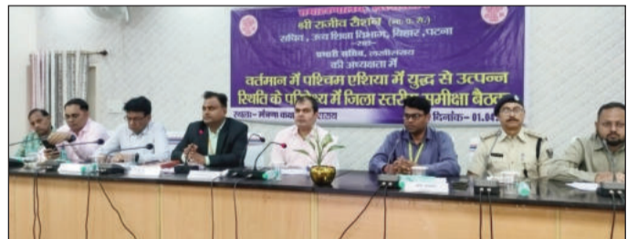
बैठक करते जिलाधिकारी।