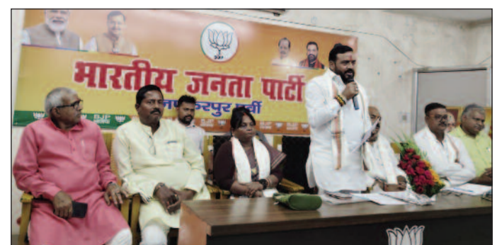
बैठक को संबोधित करते भाजपा के प्रदेश प्रभारी पवन जयसवाल।

मुजफ्फरपुर (एनएसबी)। भाजपा जिला कार्यालय (पूर्वी) में बुधवार को भाजपा के स्थापना दिवस पर आयोजित किए जाने वाले कार्यक्रमों की तैयारी को लेकर एक महत्वपूर्ण बैठक आयोजित की गई। इस बैठक में 5 अप्रैल से 12 अप्रैल तक आयोजित किए जाने वाले विशेष कार्यक्रमों की रूपरेखा तैयार की गई और कार्यकर्ताओं को आवश्यक दिशा-निर्देश दिए गए। बैठक में उपस्थित मुख्य अतिथि