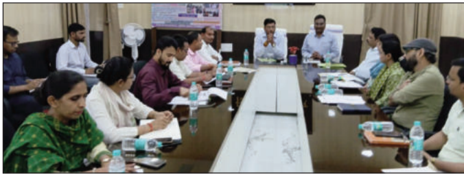
जिलास्तरीय समीक्षा बैठक करते प्रभारी सचिव।

उन्होंने कहा कि जिले में लोगों को रसोई गैस की उपलब्धता सुगमता के साथ हो, इसके लिए गैस एजेंसी मालिकों से लागातार बैठक करें अथवा समन्वय स्थापित करें, ताकि लोगों में गैस अथवा अन्य कोई भ्रान्तियां पैदा न होने पाए। इसके साथ ही पेट्रोलियम पदार्थ, खाद्य सामग्रियों, यूरिया, खाद बीज आदि की भी