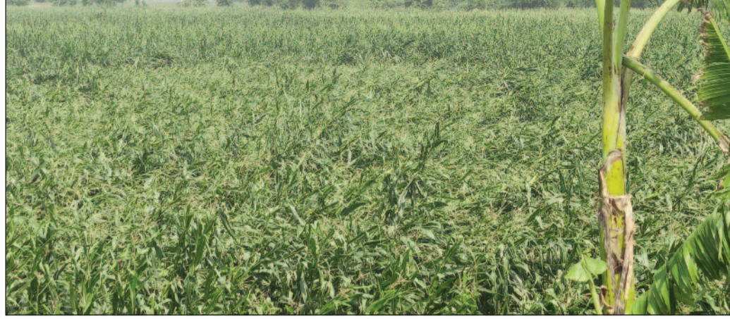
तेज आंधी-तूफान से तबाह फसल।

बनमा ईटहरी (सहरसा) (एनएसबी)। प्रखंड क्षेत्र में बीते रात्रि आई तेज आंधी-तूफान और ओलावृष्टि ने लोगों का जीना मुहाल कर दिया है। लोगों का फुस वाला घर उजड़ गया है किसानों का फसल पुरी तरह नष्ट हो गया। जिससे किसान परेशान हैं। मंगलवार की शाम अचानक मौसम बदलने से तेज आंधी तूफान और ओले गिरने से श्रेत्र में भारी तबाही मच गया। दर्जनों लोगों के अबासीय घर उजड़ गए। तो सैकड़ों किसानों के फसल पुरी तरह बर्बाद हो गया। कई जगहों पर तो आम के पेड़ जड़ से उखड़ गया। कई गृह स्वामी जख्मी भी हो गए। जख्मी व्यक्ति का ईलाज सरकारी और निजी अस्पताल में कराए गए। तूफान से लोगों का जनजीवन पूरी तरह अस्त-व्यस्त हो गया है। लगातार दो दिनों से खराब मौसम की मार से किसान पुरी तरह परेशान हैं। जहां पिछले दिन आई आंधी से फसलों को नुकसान पहुंचा था, वहीं बीती रात के