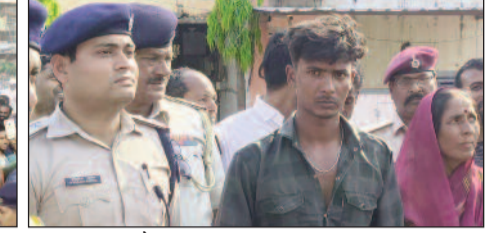
युवक और उसके माता पिता को घटनास्थल से साथ लेकर जाती पुलिस टीम।