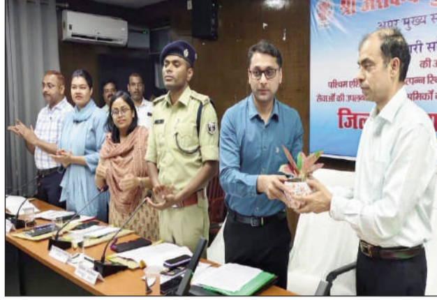
बैठक करते प्रभारी सचिव का स्वागत करते डीएम व अन्य।