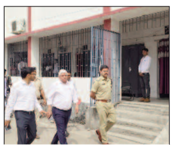
कम्युनिटी हॉल का निरीक्षण करते नगर विकास के प्रधान सचिव।

मुजफ्फरपुर (एनएसबी)। नगर विकास एवं आवास विभाग के प्रधान सचिव विनय कुमार ने बुधवार को सिकंदरपुर लेकफ्रंट स्थित कम्युनिटी हॉल, लेक-1 और बोट क्लब का निरीक्षण किया। इस दौरान उन्होंने लेक के आसपास विकसित सभी सुविधाओं को देखा और उनके बेहतर उपयोग पर जोर दिया। प्रधान सचिव ने वॉकिंग ट्रैक, लाइटिंग, बैठने की व्यवस्था, ग्रीन परिया और बोटिंग से जुड़ी सुविधाओं की समीक्षा की। उन्होंने अधिकारियों को निर्देश दिया कि इन सुविधाओं को जल्द से जल्द आम लोगों के उपयोग के लिए बेहतर तरीके से संचालित किया जाए और मोनेटाइजेशन की प्रक्रिया शुरू की जाए, ताकि शहर को राजस्व भी मिल सके। उन्होंने कम्युनिटी हॉल और बोट क्लब के उपयोग को बढ़ाने पर भी जोर देते हुए कहा कि यहां सामाजिक, सांस्कृतिक और सार्वजनिक कार्यक्रम आयोजित किए जाएं, जिससे यह स्थल लोगों के लिए आकर्षण का केंद्र बन सके। इसके बाद प्रधान सचिव ने आईसीसीसी भवन पहुंचकर कमांड एंड कंट्रोल रूम की कार्यप्रणाली को देखा और उसकी बारीकियों की जानकारी ली। स्मार्ट सिटी के प्रबंध निदेशक रितुराज प्रताप सिंह ने