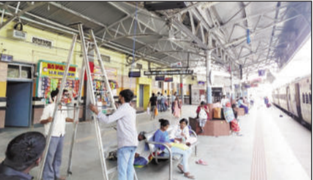
प्लेटफार्म पर मेटेनेंस कार्य करते विभागीय कर्मचारी।

जमालपुर (मुंगेर)। गर्मी के बीच जमालपुर रेलवे स्टेशन के प्लेटफार्म संख्या एक पर बिजली मेटेनेंस कार्य के कारण करीब 6 घंटे तक आपूर्ति बाधित रही। बिजली नहीं रहने से यात्रियों को भारी परेशानी का सामना करना पड़ा। जानकारी के अनुसार, मेटेनेंस कार्य के चलते सुबह से ही प्लेटफार्म पर पंखे और लाइटें बंद रह गईं। उसम भरों गर्मी में यात्री बेहाल नजर आए। कई यात्रियों ने बताया कि लंबे इंतजार के दौरान उन्हें पीने के पानी और टंडक की