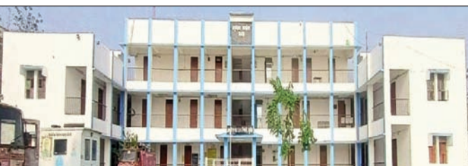
अनुमंडल कार्यालय निर्मली का भवन।