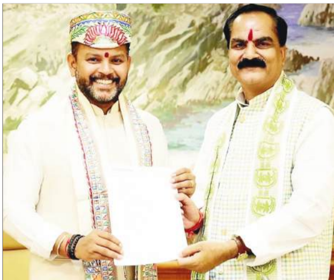
राम मोहन नायडू से मिलते सांसद ड गोपाल जी ठाकुर।

दरभंगा (एनएसबी)। बुधवार को नागर विमानन मंत्रालय की परामर्शदात्री समिति की बैठक दिल्ली स्थित मंत्रालय के सभा कक्ष में परामर्शदात्री समिति के अध्यक्ष