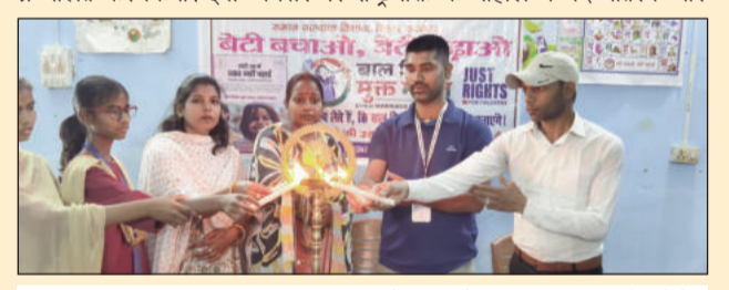
दीप प्रज्वलित कर शुभारंभ करते अतिथि।

लखीसराय (एनएसबी)। स्थानीय केआरके मैदान में मंगलवार को सीनियर राज्य स्तरीय महिला फुटबल चैंपियनशिप-2026 का शानदार शुभारंभ हुआ। 31 मार्च से 14 अप्रैल तक चलने वाले इस खेल महाकुंभ का उद्घाटन मुख्य अतिथि माननीय उपमुख्यमंत्री विजय कुमार सिन्हा एवं अन्य गणमान्य अतिथियों ने दीप प्रज्वलित कर किया। इस अवसर पर राष्ट्रभक्ति के माहौल में वंदे मातरम और