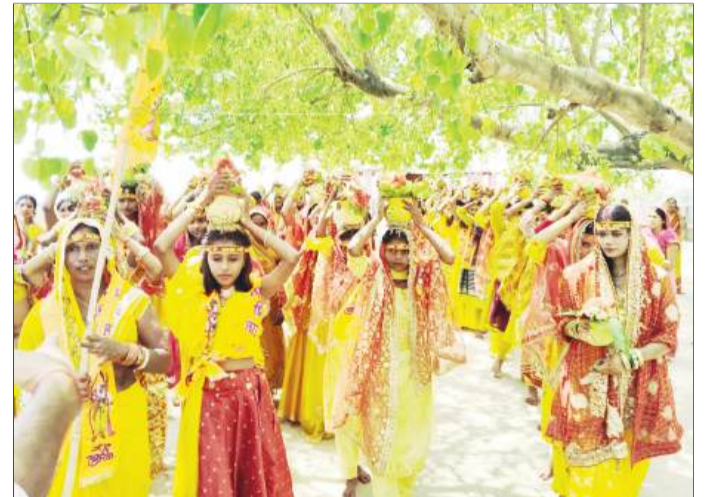
कलश यात्रा में शामिल महिलाएं।

चौथम (एनएसबी)। प्रखंड के पूर्वी बौरने पंचायत के बौरने स्थान भगवती मंदिर में ग्रामीणों द्वारा आयोजित रामधुनी यज्ञ को लेकर भव्य कलश शोभायात्रा निकाली गई। लेकर भव्य कलश शोभायात्रा निकाली गई। मंदिर प्रांगण में आयोजित 48 घंटे के रामधुनी यज्ञ को लेकर प्रथम चरण में बुधवार को दिन के साढ़े ग्यारह बजे भगवती मंदिर प्रांगण से ने उन प्रावधानों को खत्म करते हुए केवल वस्तु बना लेते थे तो उन्हें जेल में डालने का भी प्रावधान इन लोगों में बनाया था। हमारी सरकार ने पहली गलती पर चेतावनी और फिर चुमाने तक इसे सीमित किया है।