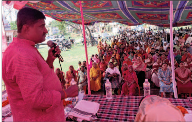
विकास शिविर में क्षेत्र के लोगों को संबोधित करते विधायक अजीत कुमार।

कांटी (एनएसबी)। कांटी विधानसभा क्षेत्र के विभिन्न पंचायतों में आयोजित विकास शिविर आम लोगों के लिए राहत का बड़ा माध्यम बनता जा रहा है। इन शिविरों में लोगों की समस्याओं का समाधान स्थानीय स्तर पर ही किया जा रहा है, जिससे उन्हें प्रखंड कार्यालयों के चक्कर नहीं लगाने पड़ रहे हैं। उक्त बातें बुधवार को पानापुर हवेली पंचायत के दरियापुर स्थित पंचायत सरकार भवन में आयोजित विकास शिविर में उमड़ी पंचायत के लोगों की भीड़ को संबोधित करते हुए क्षेत्रीय विधायक सह पूर्व मंत्री ई अजीत कुमार ने कही। इस क्रम में उन्होंने कहा कि चुनाव के दौरान किया गया वादा अब धरातल पर उतारा जा रहा है। उन्होंने कहा कि जनता की समस्याओं के समाधान के लिए पंचायत स्तर पर ही अधिकारियों को बुलाकर कार्य का निष्पादन कराया जा रहा है। शिविर में राशन कार्ड, श्रम, आपूर्ति, स्वास्थ्य, प्रधानमंत्री व मुख्यमंत्री आवास योजना, मनरेगा, कृषि, पेंशन, नल जल योजना, बिजली, शिक्षा समेत कई विभागों से जुड़ी समस्याएं सामने आईं। विधायक ने मौके पर मौजूद अधिकारियों को सभी मामलों के त्वरित निष्पादन का निर्देश दिया। गंगापुर वार्ड 12 व दामोदरी वार्ड 5 में नल जल योजना नहीं पहुंचने की शिकायत पर उन्होंने पीएचईडी विभाग के कार्यपालक अधिकारी से फोन पर बातकर जांच कर शीघ्र योजना चालू कराने को कहा। वहीं राशन नहीं मिलने की शिकायत पर संबंधित अधिकारियों को एक सप्ताह में समाधान का निर्देश दिया गया। पोखर में