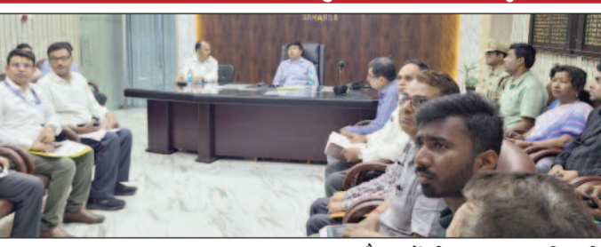
बैठक में डीएम व अन्य अधिकारी।