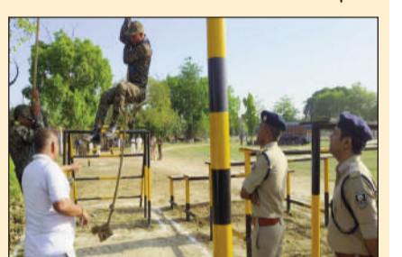
प्रशिक्षु सिपाहियों का 21 प्रकार की बाधाओं पर परीक्षण।

आरा (एनएसबी)। पुलिस अधीक्षक, द्वारा नवीन पुलिस केंद्र, आरा में प्रशिक्षण प्राप्त कर रहे प्रशिक्षु सिपाहियों के बाह्य (असल्ट) प्रशिक्षण के अंतर्गत कुल 21 प्रकार की बाधाओं पर परीक्षण लिया गया। इस दौरान रेंगकर तार के नीचे से निकलना, ऊँची कूद, रस्सी चढ़ना, लंबी दौड़, बाधा दौड़ (बाधा कोर्स), संतुलन बनाए रखते हुए बीम पर चलना,