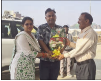
टीम को बुके भेटे प्रबंधन।

नामांकन के इच्छुक अभिभावक 02 अप्रैल 2026 से लेकर 08 अप्रैल 2026 तक अपने बच्चों के आवेदन विद्यालय परिसर में जमा कर सकते हैं। आवेदन पत्र जमा करने का समय सुबह 09.00 बजे से दोपहर 02.00 बजे तक निर्धारित किया गया है। विद्यालय प्रबंधन ने स्पष्ट किया है कि वर्तमान में कक्षा 2, 3, 4, 5, 6 और 9 में सीमित सीटें ही उपलब्ध हैं, जिन पर अभ्यर्थियों का चयन