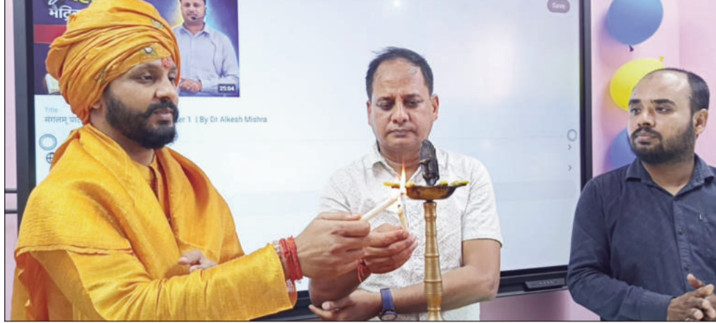
कार्यक्रम का उद्घाटन करते अतिथि।