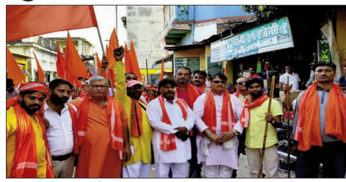
हनुमान जन्मोत्सव पर निकाली शोभायात्रा में शामिल श्रद्धालु।