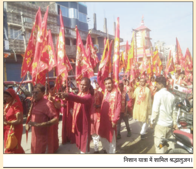
निशान यात्रा में शामिल श्रद्धालुजना।

त्रिवेणीगंज (सुपौल) (एनएसबी) । हनुमान जन्मोत्सव के अवसर पर गुरुवार को मुख्यालय स्थित श्री श्याम सेवा समिति ट्रस्ट के द्वारा निशान यात्रा निकाला गया गाजे गाजे बाजे के साथ राधा कृष्ण टाकुरवाड़ी से शुभारंभ निशान शोभायात्रा बाजार क्षेत्र के विभिन्न मुख्य मार्गों का भ्रमण करते श्याम मंदिर प्रांगण स्थित बालाजी मंदिर में सम्पन्न हुआ।