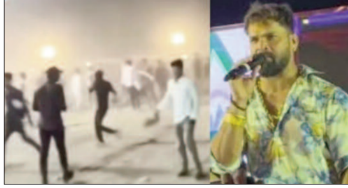
खेसारीलाल यादव के शो में मंची भगदड़ में गिरते पड़ते भागते लोग।

मुजफ्फरपुर(एनएसबी)। बोचहां प्रखंड क्षेत्र के गरहा (रुदहां) स्थित अर्जुन बाबू हाट बाजार पशु मेला में बुधवार की देर शाम आयोजित भोजपुरी स्टार खेसारी लाल यादव के कार्यक्रम के दौरान भारी भीड़ उमड़ने से अफरा तफरी मच गई। मिली जानकारी के अनुसार स्ट्रेज पर कुछ लोग खेसारी लाल यादव के साथ सेल्फी लेने लगे। यह देखकर स्ट्रेज के पास भीड़ में खड़े कई लोग भी खेसारीलाल के साथ सेल्फी लेने के लिए बैरिकेडिंग फांदकर स्ट्रेज पर चढ़ने का प्रयास किया, जिसके कारण भीड़ में भगदड़ जैसे हालात बन गए। वहीं भगदड़ और अफरा तफरी की बनी स्थिति को नियंत्रित करने के लिए पुलिस को लाठीचार्ज करना पड़ा। इस दौरान दर्शकों की भीड़ के बीच से लोगों ने स्ट्रेज पर जूते चप्पल फेंकने लगे और बैरिकेडिंग तोड़कर भीड़ स्ट्रेज के करीब