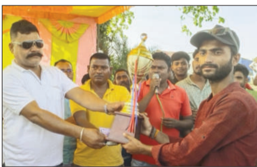
ट्रुफी के साथ विजेता।

लक्ष्मीपुर को हराकर बनी चैंपियन, खिलाड़ियों ने ट्रफी उठाई। इस्लामा बलुआ में आयोजित टेनिस बल क्रिकेट टूर्नामेंट का फाइनल मुकाबला अरेराज ने जीत लिया है। बुधवार को हुए इस मैच में अरेराज ने लक्ष्मीपुर को हराकर खिताब पर कब्जा किया। फाइनल में पहले बल्लेबाजी करते हुए