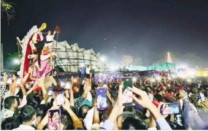
प्रतिमा को विसर्जन करने के लिए जमा लोगों की भीड़।

पसराहा। श्रद्धा, भक्ति और उल्लास का प्रतीक चार दिवसीय राजकीय मेला महद्दीपुर हर्षोल्लास के साथ संपन्न हो गया। मेले के अंतिम दिन मां दुर्गा की प्रतिमा विसर्जन के साथ ही चार दिनों से चल रहे इस आध्यात्मिक उत्सव का समापन हुआ। विसर्जन के दौरान पूरा माहौल 'मां दुर्गा की जय' और 'अगले बरस तु जल्दी आ' के जयकारों से गुंज उठा। भक्तों ने नम आंखों से अपनी आराध्य देवी को विदाई दी, जिससे हर तरफ भावुकता का शय नजर आया। प्रतिमा विसर्जन की प्रक्रिया पूरे विधि-विधान और परंपरिक रीति-रिवाजों के साथ शुरू की गई। विशाल शोभायात्रा के रूप में मां की प्रतिमा को