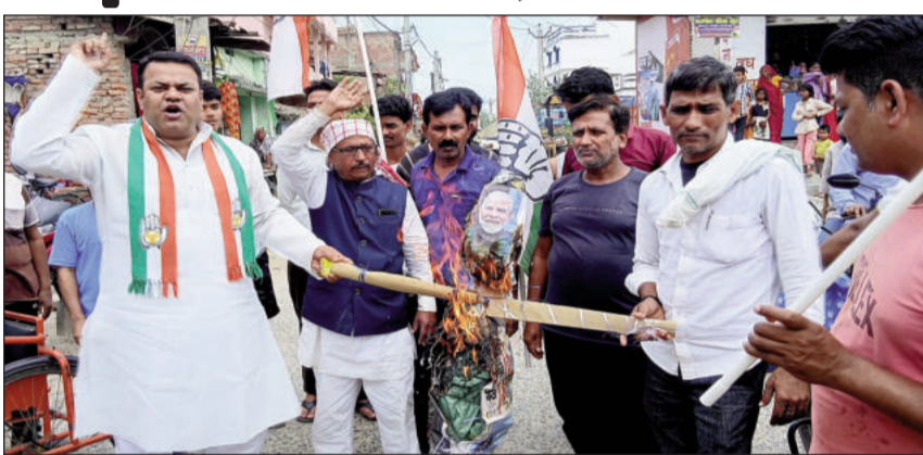
हल्ला बोल प्रदर्शन के साथ पुतला दहन करते कांग्रेस कार्यकर्ता।

सीतामढ़ी (एनएसबी)। बढ़ती महंगाई, रसोई गैस के बढ़ते दामों, एलपीजी सिलेंडर की आपूर्ति में हो रही देरी, बिजली टैरिफ में 20 फीसदी की बढ़ोतरी से नाराज कांग्रेस कार्यकर्ताओं एवं आमलोगों ने गुरुवार दुमरा मुख्यालय के लक्ष्मी चौक भीसा पर हल्लाबोल प्रदर्शन किया।