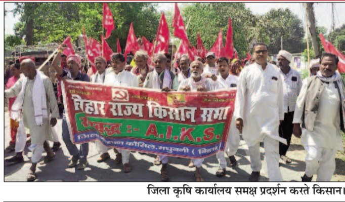
जिला कृषि कार्यालय समक्ष प्रदर्शन करते किसान।