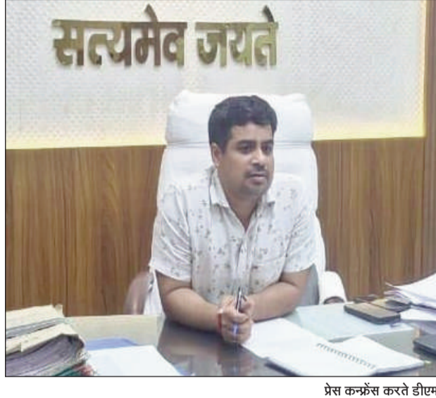
प्रेस कन्फ्रेंस करते डीएम।

जिलाधिकारी ने प्रेस कन्फ्रेंस कर जिले में एलपीजी सिलेंडर की स्थिति व होम डिलेवरी के तहत गैस सिलेंडर उपलब्ध कराने की दी जानकारी