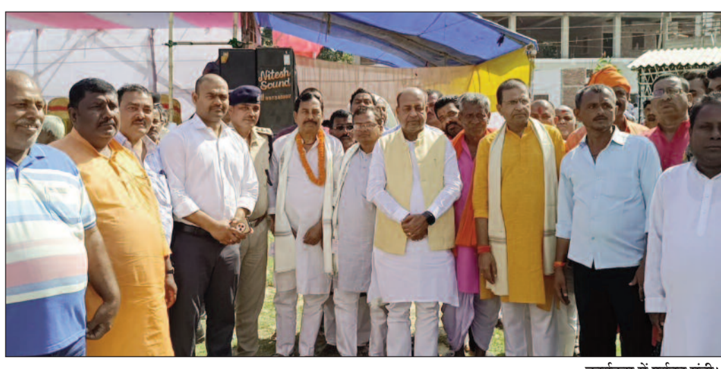
कार्यक्रम में पर्यटन मंत्री।