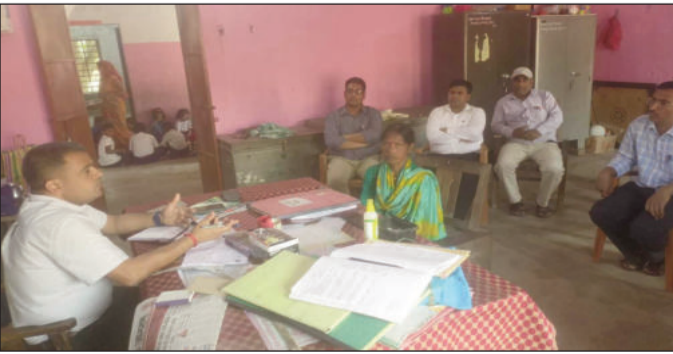
शिक्षक के साथ संवाद करते बीडीओ।

कन्या मध्य विद्यालय आदमपुर में बच्चों के नामांकन की प्रक्रिया काफी धीमी देख कर नाराजगी जताते हुए इसमें सुधार करने का दिशा निर्देश प्रथानाध्यपक को दिए। बीडीओ ने शिक्षकों को विशेष तौर पर नामांकन की प्रक्रिया को बढ़ाने को लेकर कहा कि स्कूल में बेहतरतरीन तकनीक और अच्छे छात्र-