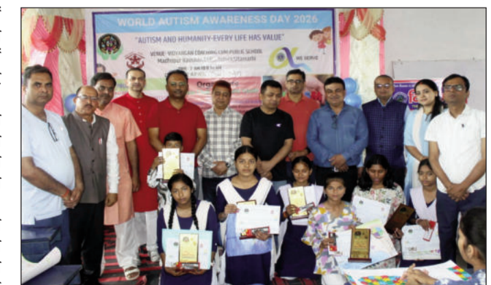
कार्यक्रम में अतिथि, आयोजक, स्कूली बच्चे व अन्य।

सीतामढ़ी (एनएसबी)। विश्व ऑटिज्म जागरूकता दिवस के अवसर पर विद्यांगन कोचिंग एवं पब्लिक स्कूल परिसर में एक भव्य एवं प्रेरणादायक जागरूकता कार्यक्रम का आयोजन किया गया। यह कार्यक्रम लायंस क्लब सीतामढ़ी यूथ एवं आरोग्य फाउंडेशन के संयुक्त तत्वावधान में संपन्न हुआ, जिसमें लगभग 300 स्कूली बच्चों ने उत्साहपूर्वक सहभागिता करते हुए कार्यक्रम को जीवंत बना दिया। कार्यक्रम का शुभारंभ बच्चों द्वारा प्रस्तुत स्वागत गान से हुआ, जिसने पूरे वातावरण को भावनात्मक एवं प्रेरणादायक बना दिया। कार्यक्रम में मुख्य अतिथि के रूप में