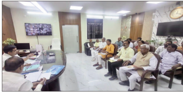
बैठक में शामिल डीएम व अन्य।