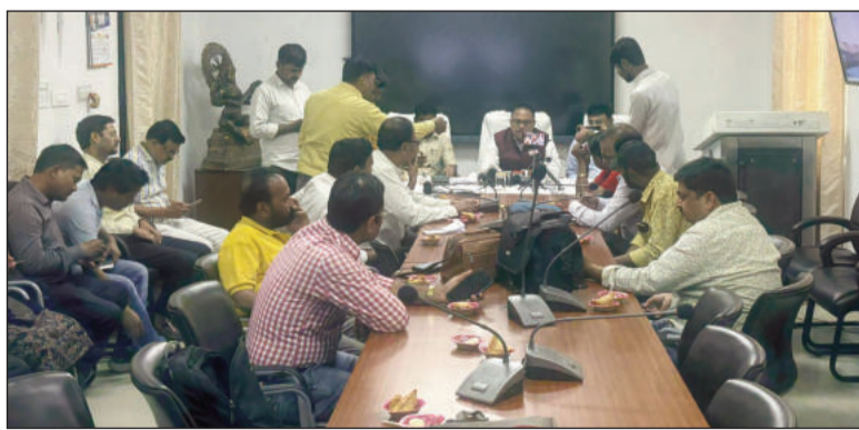
पत्रकारों को सम्बोधित करते कुलपति।