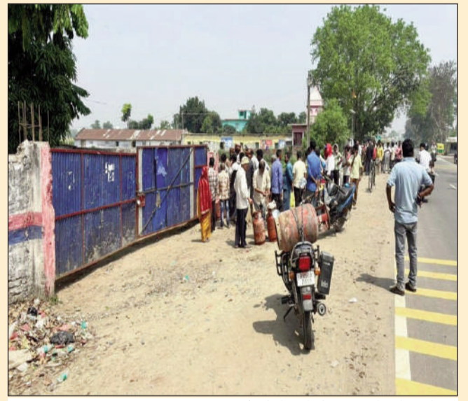
गैस सिलेंडर के लिए कतार में खड़े उपभोक्ता।

राघोपुर (सुपौल) (एनएसबी) । राघोपुर प्रखंड क्षेत्र में रसोई गैस की किल्लत थमने का नाम नहीं ले रहा है। प्रशासन द्वारा होम डिलीवरी सुनिश्चित करने के सख्त निर्देश जारी किए जाने के बावजूद जमीनी हकीकत बिल्कुल अलग नजर आ रहा है। एजेंसी संचालकों की मनमानी के कारण उपभोक्ताओं को अब भी गोदाम पर लंबी कतारों में खड़े होकर गैस