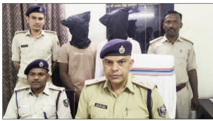
घटना में शामिल दो आरोपियों को गिरफ्तारी व घटना के संबंध में जानकारी देने ग्रामीण एसपी।