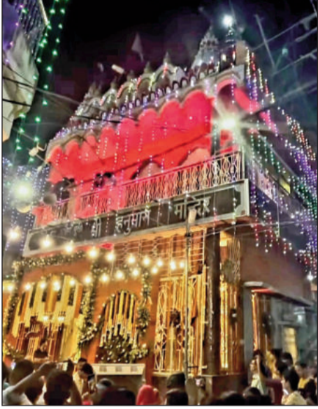
रंग-बिरंगी रोशनी व फूलों से सजा मंदिर।