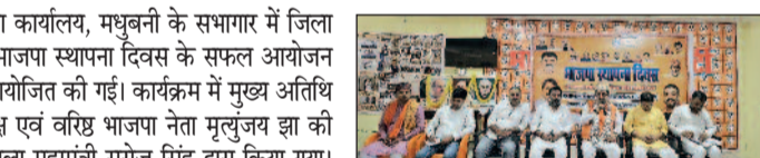
कार्यक्रम में पर्यटन मंत्री।