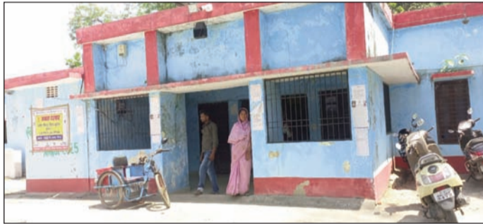
अंचल कार्यालय पिपरा ।

पदाधिकारी के अवकाश पर रहने के कारण अंचल में नहीं लगा जनता दरबार