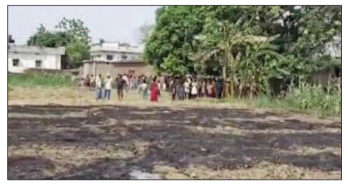
आग की भेंट चढ़ा खेत।