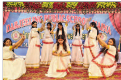
उद्घाटन करते अतिथि, सांस्कृतिक कार्यक्रम करती छात्र-छात्रा।