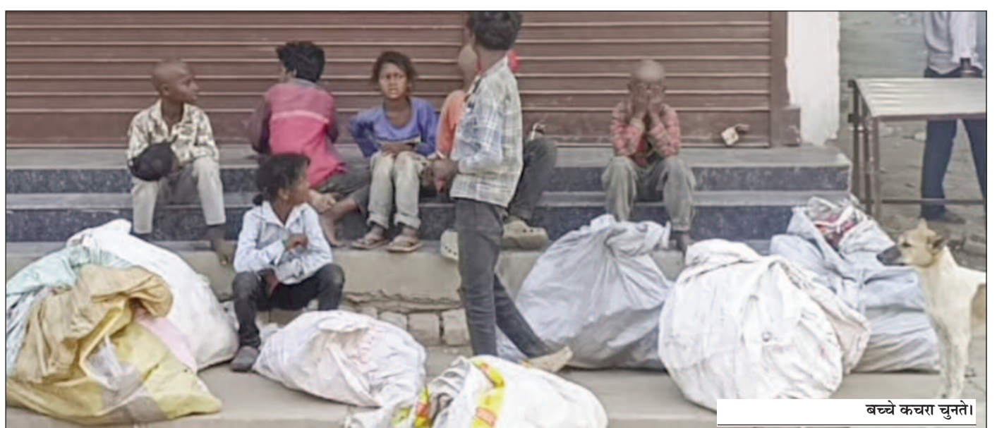
बच्चे कचरा चुनते।

जयनगर (एनएसबी)। सरकार शिक्षा को बढ़ावा देने के लिए विभिन्न योजनाएं चला रही है, वहीं दूसरी ओर जमीनी हकीकत कुछ और ही बयान कर रही है। जयनगर शहर और आसपास के इलाकों में कई ऐसे बच्चे देखने को मिल रहे हैं, जो स्कूल जाने की उम्र में कंधे पर बोरी उठाकर गलियों और मोहल्लों में कचरा बीनने को मजबूर हैं। यह स्थिति न सिर्फ चिंताजनक है, बल्कि समाज और व्यवस्था पर भी सवाल खड़े करती है। सुबह होते ही ये बच्चे शहर के अलग-अलग हिस्सों में निकल पड़ते हैं। हाथ में बोरी लिए व कूड़े के ढेर से प्लास्टिक, कागज और अन्य कबाड़ इकट्ठा करते नजर आते हैं। दिनभर की मेहनत के बाद जो कुछ मिलता है, उसी से उनके परिवार का चूल्हा जलता है। गरीबी और मजबूरी ने इन बच्चों से उनका बचपन छिन लिया है। स्थानीय लोगों के अनुसार, इन बच्चों के माता-पिता आर्थिक रूप से काफी कमजोर हैं। कई परिवार ऐसे हैं, जिनके पास स्थायी रोजगार नहीं है। ऐसे में बच्चों को भी कमाने के लिए मजबूर होना