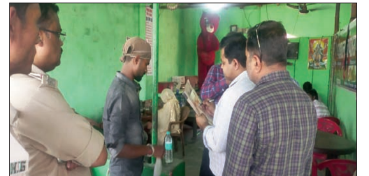
जांच करते पदाधिकारी ।

21799 उपभोक्ता को बुकिंग की गैस आपूर्ति की जानी है। आज अभी तक कुल 51 एजेंसी में 22 की जांच की गई है। 31 अन्य होटलों / प्रतिष्ठानों पर जांच एवं छापेमारी की गई है। समाहरणालय परिसर स्थित जिला आपदा प्रबंधन कार्यालय, सुपौल में घरेलू गैस सिलेंडरों के उठाव वितरण के निगरानी के लिए जिला नियंत्रण कक्ष स्थापित किया गया है। जिसका दूरभाष संख्या 06473-224005 है। 03 अप्रैल को जिला नियंत्रण कक्ष में 8 शिकायतें प्राप्त हुईं सभी संबंधितों के शिकायतों का निष्पादन करा दिया गया है। अभी तक घरेलू गैस के वाणिज्यिक प्रयोग / कालाबाजारी के आरोप में जिला अन्तर्गत तीन प्राथमिकी दर्ज की जा चुकी है। सुपौल जिले में गैस सिलेंडरों के उपलब्धता की स्थिति सिलेंडरों की संख्या उपलब्धता हेतु गैस वितरक कर्मियों से लगातार संपर्क में है। अभी जिले के गैस एजेंसियों के पास लागूभा 13428 गैस सिलेंडरों का भंडार मौजूद है। कल दिनांक 03.04.2026 को लागूभा 4209 उपभोक्ताओं को गैस सिलेंडरों की आपूर्ति की गई है। अभी तक