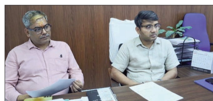
जिला सूचना एवं जनसंपर्क पदाधिकारी ने प्रेस कांफ्रेंस कर मिडिया को दी जानकारी।

सुपौल (एनएसबी) । जिले की सभी गैस एजेंसी द्वारा होम डिलीवरी सेवा प्रारंभ किए जाने के पश्चात उपभोक्ताओं को बड़ी राहत मिली है। जिले की बड़ी गैस एजेंसी शकुन इण्डेन, सुपौल, भवानी इण्डेन त्रिवेणीगंज, कैलाश एच०पी० निर्मली, मां चन्द्रकला एच०पी० मरौना, गणपती एच०पी० गैस सिमराही सहित जिले के सभी 61 एजेंसियों के लाभकों को आसानी से होम डिलीवरी के द्वारा गैस प्राप्त हो रही है। विदित हो कि वर्तमान में मध्य आरंभ होने की सूचना से अनुमंडल क्षेत्र ही नहीं आसपास के लोगों में खास उत्साह देखा जा रहा है। काफी दिनों बाद द्वारा सुपौल न्याय मंडल के नाम निर्मली व्यवहार न्यायालय भवन में बिजली कनेक्शन जोड़ दिया गया है।