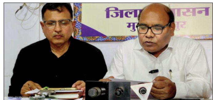
प्रेस वार्ता में एलपीजी की उपलब्धता की जानकारी देते प्रशासनिक अधिकारी।

सक्रिय हैं, जिनके माध्यम से प्रतिदिन 431.3 सिलेंडरों की औसत बिक्री हो रही है। इस श्रेणी में 1,142 सिलेंडर स्टॉक में उपलब्ध हैं और ट्राजिट में कोई सिलेंडर लॉक नहीं है। प्रशासन ने बताया कि सभी गैस एजेंसियों को नियमित रूप से आपूर्ति बनाए रखने के निर्देश दिए गए हैं। साथ ही