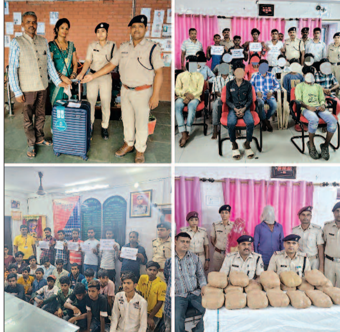
आरपीएफ के एक्शन की झलकियां।

समस्तीपुर (एनएसबी)। पूर्व मध्य रेलवे के समस्तीपुर मंडल अंतर्गत रेलवे सुरक्षा बल द्वारा वित्तीय वर्ष 2025-26 के दौरान यात्रियों की सुरक्षा, संरक्षा एवं रेलवे संपत्ति की रक्षा हेतु अनेक महत्वपूर्ण उपलब्धियां हासिल की गई हैं। विभिन्न अभियानों के माध्यम से रेल पुलिस ने न केवल अपराध नियंत्रण में उल्लेखनीय सफलता प्राप्त की है, बल्कि यात्रियों को सुरक्षित, सुगम एवं भरोसेमंद यात्रा अनुभव प्रदान करने में भी अपनी प्रतिबद्धता को सिद्ध किया है। मंडल मुख्यालय से प्रेस विज्ञप्ति जारी कर उक्त जानकारी देते हुए बताया गया है कि, वर्ष के दौरान दुर्गा पूजा, दीपावली, छठ पूजा, होली जैसे प्रमुख त्योहारों के साथ-साथ बिहार विधानसभा चुनाव एवं प्रधानमंत्री, रेल मंत्री तथा रेलवे बोर्ड अध्यक्ष के कार्यक्रमों के अवसर पर व्यापक भीड़ प्रबंधन किया गया। इन सभी अवसरों पर आरपीएफ द्वारा प्रभावी सुरक्षा व्यवस्था सुनिश्चित करते हुए सभी कार्यक्रमों को सफलतापूर्वक एवं बिना किसी व्यवधान के संपन्न कराया गया। रेलवे संपत्ति की सुरक्षा के लिए चलाए गए 'रेल सुरक्षा' अभियान के अंतर्गत 143 बाहरी व्यक्तियों को गिरफ्तार किया गया तथा 6.79 लाख रुपये मूल्य की रेलवे संपत्ति बरामद की गई। वहीं 'समय पालन' अभियान के तहत अनधिकृत चैन