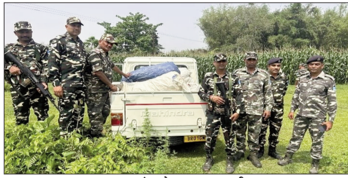
बरांमद गांजा के साथ एसएसबी ।