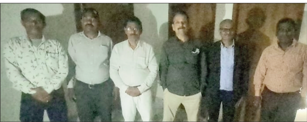
कोर्ट भवन का जायजा लेते जिला एवं सत्र न्यायाधीश ।

अगले सप्ताह हाईकोर्ट के मुख्य न्यायाधीश द्वारा निर्मली स्थित व्यवहार न्यायालय का करेंगे उद्घाटन, तैयारी प्रारंभ