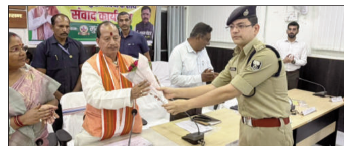
बैठक के पूर्व उपमुख्यमंत्री का स्वागत करते एसी।

उन्होंने कहा कि इन बिंदुओं पर गंभीरता से कार्रवाई के लिए नगर आयुक्त को निर्देशित किया गया है। खासकर शहरी क्षेत्र में पेयजल आपूर्ति, सीवेज व्यवस्था, खुले में मॉस-मछली की बिक्री जैसे मुद्दों पर त्वरित कार्रवाई सुनिश्चित करने को कहा गया है। उन्होंने भरोसा दिलाया कि शहरवासियों की समस्याओं का शीघ्र समाधान किया जाएगा और प्रशासन को इस दिशा में सक्रिय भूमिका निभाने के निर्देश दिए गए हैं। उपमुख्यमंत्री ने बताया कि शनिवार को भूमि सुधार जनकल्याण संवाद कार्यक्रम आयोजित होगा, जिसमें आम लोगों की समस्याएं सुनी जाएंगी और उनका समाधान किया जाएगा। साथ ही