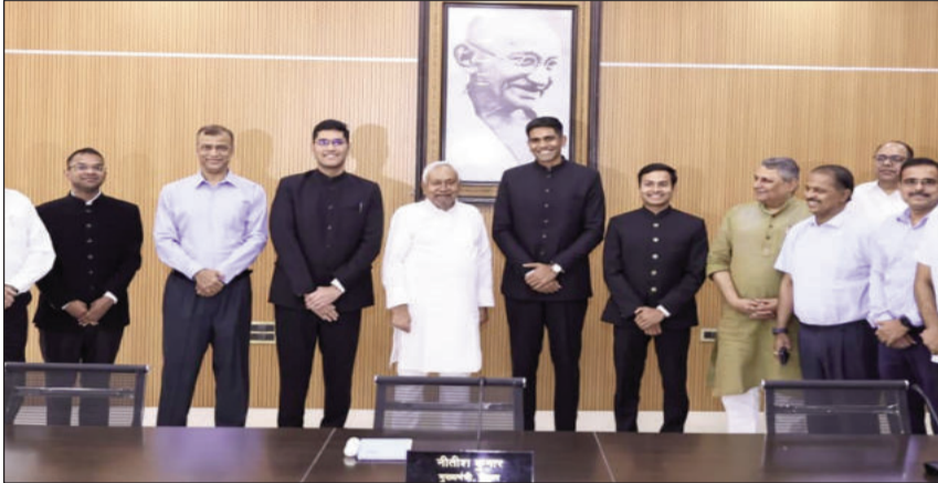
2024 बैच के भारतीय वन सेवा के प्रशिक्षु अधिकारियों के साथ सीएम नीतीश कुमार व अन्य।

मुख्यमंत्री ने प्रशिक्षु अधिकारियों से बातचीत करते हुए कहा कि आप लोगों ने अपने-अपने अनुभव साझा किए। आपलोग अभी ट्रेनिंग पीरियड में हैं, उसके बाद आपलोगों की पोस्टिंग होगी। बिहार में हरित आवरण पहले मात्र 9 प्रतिशत था। राज्य सरकार ने अपने प्रयासों से इसे बढ़ाकर 17 प्रतिशत तक पहुँचाया है। हरित आवरण को बढ़ाने में आप सभी अधिकारी सहभागी बनें। उन्होंने कहा कि पिछले कई वर्षों से बिहार में वर्षापात कम हो रहा है इसलिये जल संचयन पर जोर देने की आवश्यकता