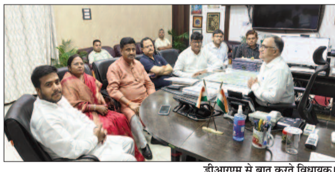
डीआरएम से बात करते विधायक।