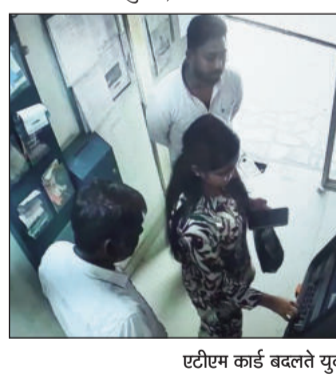
एटीएम कार्ड बदलते युवाक।

लखीसराय (एनएसबी)। कवैया थाना क्षेत्र स्थित आईडीबीआई बैंक के एटीएम में बीते 12 मार्च को शांतिर जालसाजों ने धोखाधड़ी की एक बड़ी घटना को अंजाम दिया है। प्राप्त जानकारी के अनुसार, दो अज्ञात अपराधियों ने मदद करने के बहाने एक महिला का एटीएम कार्ड बदल दिया और उनके खाते से