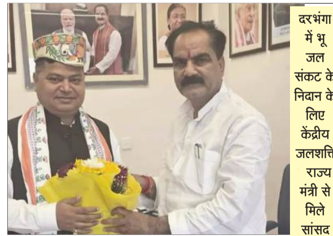
केंद्रीय जल शक्ति राज्यमंत्री से मिलते सांसद डॉ. गोपाल जी ठाकुर।

दरभंगा (एनएसबी)। बीते साल 2025 में दरभंगा जिले में पानी के लिए भयावह स्थिति हो गई थी। सरकार के द्वारा पेयजल की आपूर्ति को व्यापक स्तर पर की गई व्यवस्था के बावजूद शहरी क्षेत्रों के साथ साथ अधिकांश गांव मुहल्ले में काफी कठिनाइयों का सामना करना पड़ा था। इस संकट को ध्यान में रखते हुए इस समस्या के स्थाई समाधान के लिए सरकार के द्वारा शीघ्र ठोस पहल किए जाना आवश्यक है। शुक्रवार को स्थानीय सांसद सह लोकसभा में भाजपा सचेतक डा गोपाल जी ठाकुर ने दिल्ली स्थित अपने कार्यालय में केंद्रीय जल शक्ति राज्यमंत्री राजभूषण चौधरी निषाद के साथ हुई मुलाकात में इस संकट से निदान पाया जा सके दरभंगा शहरी क्षेत्र तथा ग्रामीण इलाकों में पेयजल आपूर्ति के लिए विभागीय स्तर पर मिशन मोड में कार्य शुरू किए जाने का आग्रह करते हुए कहा कि आने वाले समय में दरभंगा में पेयजल की समस्या का संकट नहीं हो इसके लिए पर्याप्त व्यवस्था की जाए।