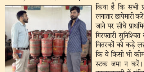
गैस गोदाम की जांच करते अधिकारी।

लखीसराय (एनएसबी)। मध्य पूर्व (मिडिल ईस्ट) में जारी युद्ध के कारण एलपीजी गैस की आपूर्ति प्रभावित हुई है। इस स्थिति के मद्देनजर लखीसराय जिला प्रशासन ने कर्म कर ली है ताकि जिले में गैस की किल्लत न हो और कालाबाजारी पर पूरी तरह अंकुश लगाया जा सके। जिला प्रशासन द्वारा आम नागरिकों को भीड़ और संभावित जमाखोरी को देखते हुए कई कड़े कदम उठाए गए हैं। जिलाधिकारी के निर्देश पर जिले के सभी प्रखंडों में विकास पदाधिकारी, प्रखंड आपूर्ति पदाधिकारी और संबंधित थाना प्रभारियों की एक निस्वरीय धावा दल का गठन किया गया है। यह टीम लगातार क्षेत्र में भ्रमणशील रहकर कालाबाजारी पर रोक लगाएगी। इसी क्रम में शनिवार, 4 अप्रैल 2026 को एक विशेष निरीक्षण भी किया गया।