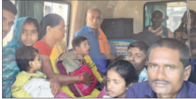
हृदयरोग से पीड़ित बच्चे को लेकर इलाज के लिए पटना जाने की तैयारी में परिजन।