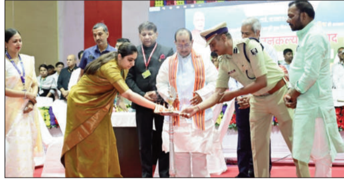
दीप प्रज्वलित कर कार्यक्रम का उद्घाटन करते उपमुख्यमंत्री।

रिश्तखोरी पर भी उन्होंने कड़ा रुख अपनाने का आग्रह किया। उन्होंने कहा कि वे वैधिकायत करें। शिकायत करने वालों को सम्मानित किया जाएगा। उन्होंने कहा कि सरकार भूमि रिकार्ड को पूरी तरह पारदर्शी बनाने की दिशा में तेजी से काम कर रही है, ताकि विवाद की स्थिति ही उत्पन्न न हो। कार्यक्रम में