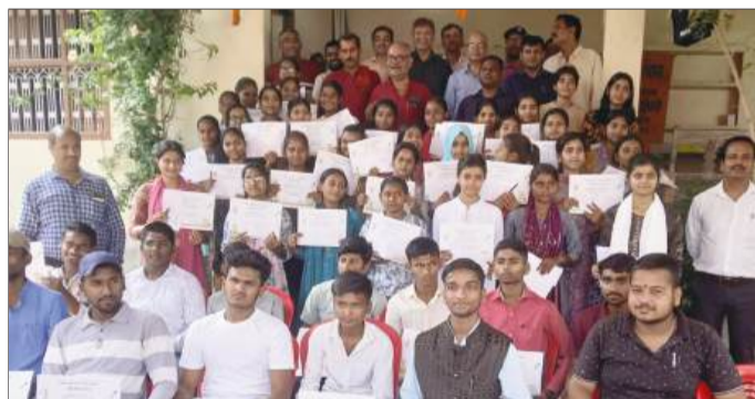
सम्मानित होने के बाद अतिथियों के साथ छात्र-छात्राएं।