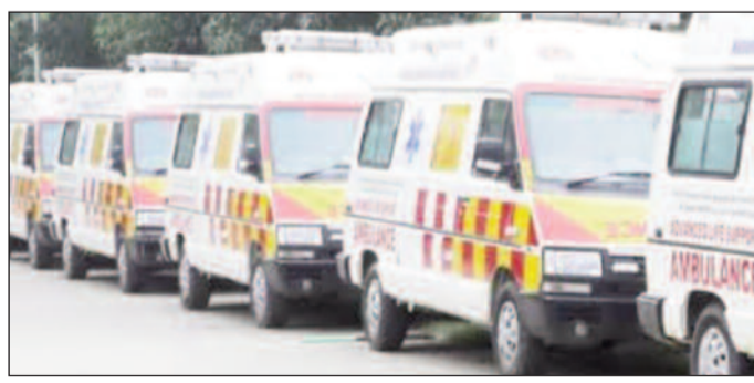
गर्भवती महिलाओं और बच्चों के लिए तैयार एम्बुलेंस सेवा।