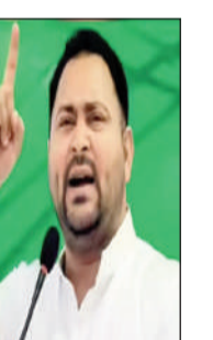
नेता प्रतिपक्ष तेजस्वी।

पटना / एनएसबी। नेता प्रतिपक्ष तेजस्वी ने कहा है कि भाजपा जदयू की वर्षों की सरकार और डबल इंजन सरकार के कर कमलों से विगत दो दशकों से शिक्षा-रोजगार-आय, औद्योगिक विकास-उत्पादन व निवेश तथा स्वास्थ्य सेवा-सुविधा और पोषण से लेकर अधिकांश सामाजिक, मानवीय और आर्थिक संकेतकों में बिहार सबसे निचले पायदानों पर है। उन्होंने न कहा कि अगर मुख्यमंत्री, दो-दो उपमुख्यमंत्री ने नीतिक साहस और योग्यता है तो बिहार की प्रगति व बेहतर की लिए इस यथार्थ और सरकार के अपने ही आंकड़ों व तथ्यों पर मुझसे जब चाहे, जहाँ चाहे, जैसे चाहे सार्वजनिक बहस कर सकते हैं। बिहार की सबसे