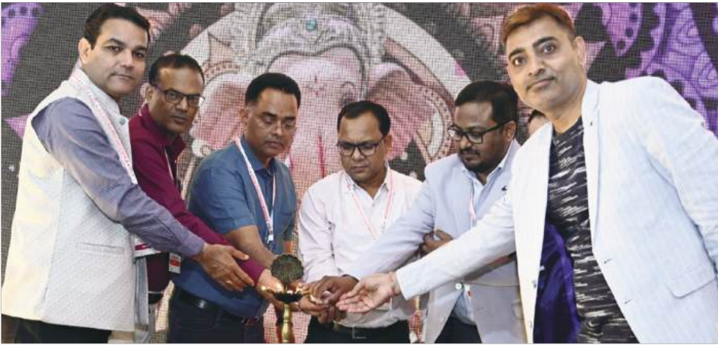
मिर्जापुर स्थित होटल एपी पैलेस में किया गया आयोजन

सोचकर ना करें कि यह तुरंत मुनाफा वाला होगा। ओमंगा और वीणा वाटिका से पहले