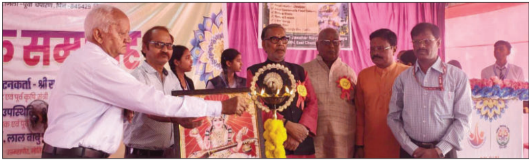
कार्यक्रम का शुभारंभ करते पूर्व केंद्रीय पि मंत्री सह सांसद राधामोहन सिंह व अन्य।

समारोह को संबोधित करते हुए सांसद राधामोहन सिंह ने कहा कि नवोदय विद्यालय ग्रामीण प्रतिभाओं को आगे बढ़ाने का शक्ति माध्यम है। यह संस्थान शिक्षा के साथ-साथ अनुशासन और संस्कार का भी विकास करता है। उन्होंने विद्यार्थियों की प्रस्तुति की सराहना करते हुए कहा कि यहां की प्रतिभाएं भविष्य में देश का नाम रोशन