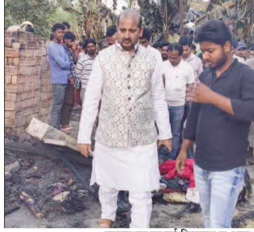
घटनास्थल पर पूर्व विधायक व अन्य।