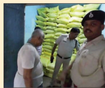
खाद तस्करी के खिलाफ व्यापक छापेमारी अभियान।

मोतिहारी (एनएसबी)। अनुमंडल पदाधिकारी सिकरहना (ढाका) एवं अनुमंडल पुलिस पदाधिकारी, सिकरहना (ढाका) द्वारा संयुक्त रूप से बनकटवा एवं घोड़ासहन प्रखंड क्षेत्रों में खाद तस्करी के खिलाफ व्यापक छापेमारी अभियान चलाया गया। इस दौरान कई महत्वपूर्ण अनियमितताएं उजागर हुईं और संबंधित विक्रेताओं के खिलाफ कड़ी कार्रवाई की गई। छापेमारी के क्रम में बनकटवा नहर रोड पर एक मोटरसाइकिल से 8 बोरा