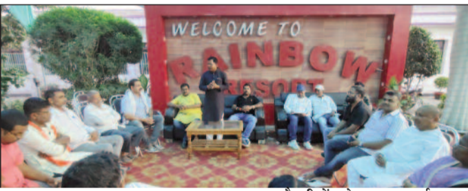
तैयारी में लगे भाजपा कार्यकर्ता।