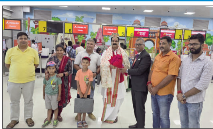
शुभारंभ करते सांसद डॉक्टर गोपाल जी ठाकुर।

संपूर्ण मिथिला क्षेत्र के लिए एक बड़ी उपलब्धि है। मां जानकी की धरती मिथिला क्षेत्र से देश में आईटी हब के लिए चर्चित बेंगलुरु के बीच इस उड़ान सेवा पर्यटन तथा रोजगार के लिए बड़ा योगदान होगा। स्थानीय सांसद सह दरभंगा एयरपोर्ट सलाहकार समिति के चेयरमैन डॉ गोपाल जी ठाकुर ने रविवार को दरभंगा से बेंगलुरु जाने वाले यात्रियों को टिकट तथा बोर्डिंग पास देकर विदा करने के बाद उपरोक्त बातें कही। दरभंगा से बेंगलुरु के लिए यात्रा