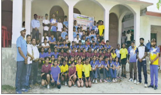
प्रतियोगिता में बिहार के विभिन्न जिलों से 200 से अधिक बालक एवं बालिका खिलाड़ियों ने उत्साहपूर्वक भाग लिया।