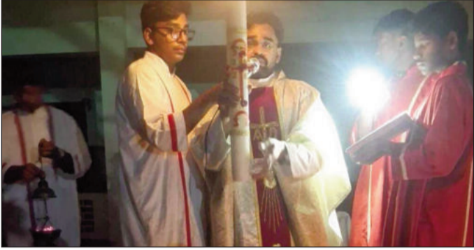
प्रभु यीशु का आराधना करते फादर।