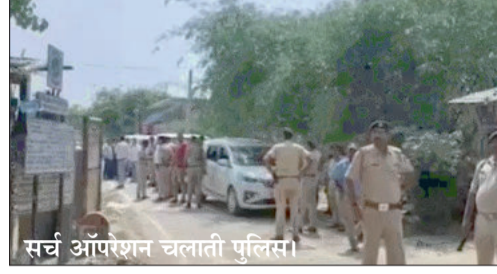
सर्च ऑपरेशन चलाने वाली पुलिस।