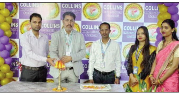
उपहार भेंट करते प्राचार्य।

जमालपुर (मुंगेर) (एनएसबी)। स्थानीय क्षेत्र के प्रतिष्ठित शिक्षण संस्थान कोलिन्स किड्स एवं कोलिन्स इंटरनेशनल स्कूल में सत्र 2025-26 के वार्षिक परीक्षा परिणाम सफलतापूर्वक घोषित कर दिए गए। कोलिन्स किड्स में प्री-नर्सरी से यूकेजी तक तथा कोलिन्स इंटरनेशनल स्कूल में कक्षा 1 से कक्षा 8 तक के विद्यार्थियों का परिणाम पूर्ण हुआ। इस अवसर पर कोलिन्स किड्स में प्रत्येक कक्षा के अभिभावकों की सक्रिय भागीदारी देखने को मिली।