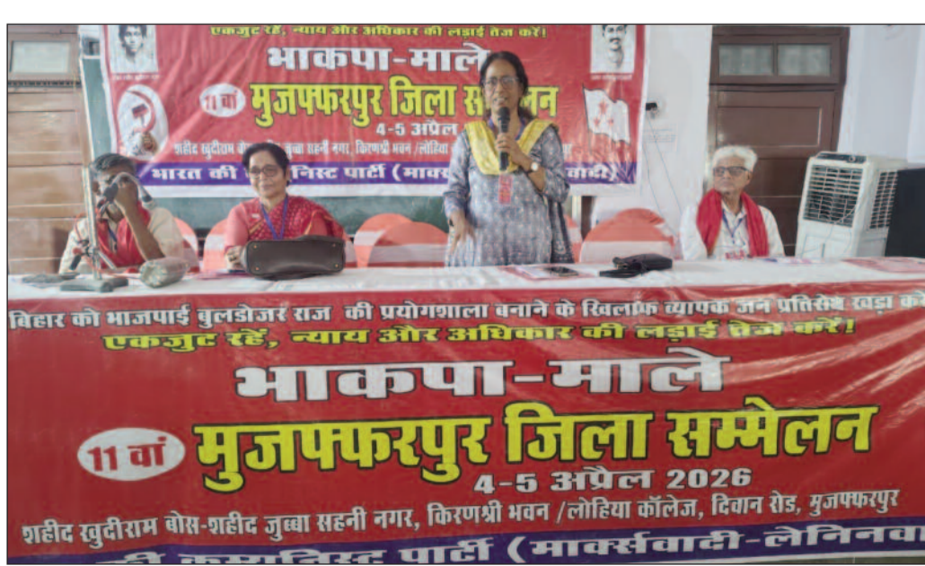
जिला सम्मेलन के समापन सत्र में चुनाव की घोषणा करते वक्ता।