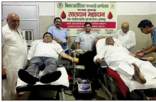
शिविर में रक्तदान करते समाजसेवी व उपस्थित अन्य।

मुजफ्फरपुर (एनएसबी)। बिहार प्रादेशिक मारवाड़ी सम्मेलन, मुजफ्फरपुर नगर शाखा द्वारा आयोजित रक्तदान शिविर का कार्यक्रम 5/4/2026 रविवार को सफलतापूर्वक संपन्न हुआ। समाज सेवा एवं मानव कल्याण की भावना से आयोजित इस शिविर में सदस्यों एवं समाजबंधुओं ने उत्साहपूर्वक भाग लेते हुए रक्तदान किया। शिविर के दौरान लगभग 35 यूनिट रक्त संग्रहित किया गया, जो जरूरतमंद