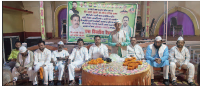
अभिनंदन समारोह में अकलियत सदस्य।