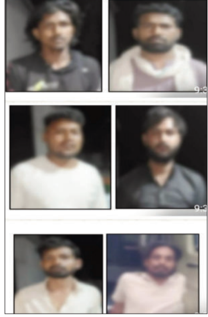
गिरफ्तार अपराधी ।