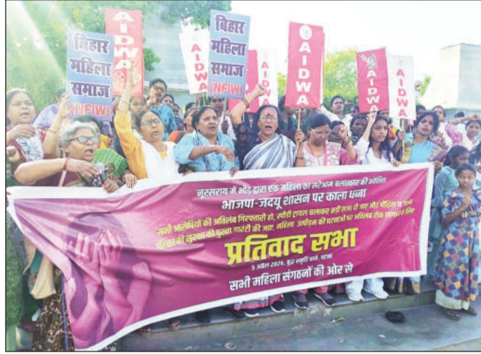
प्रतिवाद मार्च में शामिल विभिन्न संगठनों से जुड़ी महिलाएं।

अत्यंत पिछड़ी जाति की महिला के पति पूना में मजदूरी करते हैं। महिला अवस्था बूढ़ी सास के साथ रहती है और उसके तीन बच्चे हैं। उसे अपना सब