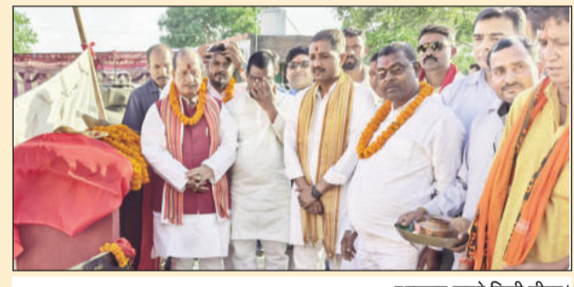
उद्घाटन करते डिप्टी सीएम।

लखीसराय (एनएसबी)। बिहार के उपमुख्यमंत्री विजय कुमार सिन्हा ने रविवार को लखीसराय नगर परिषद क्षेत्र को बड़ी सौगात देते हुए कुल 435 करोड़ रुपये की विभिन्न विकास योजनाओं का उद्घाटन एवं शिलान्यास किया। इन योजनाओं के धरातल पर उतरने से शहर की जल निकासी व्यवस्था और यातायात सुविधाओं में व्यापक सुधार होगा। उपमुख्यमंत्री ने नगर परिषद क्षेत्र में 285 करोड़ रुपये से अधिक की योजनाओं का उद्घाटन किया, जबकि लगभग 150 करोड़ रुपये की योजनाओं का शिलान्यास कर विकास कार्यों को नई गति दी। उद्घाटन किए गए मुख्य कार्यों में वाई संख्या 06 में माधव जी के कोना से बाल्मीकि महतो मोड़ तक ढक्कन सहित नाला व सड़क (4386 लाख), मेन रोड में जमुई