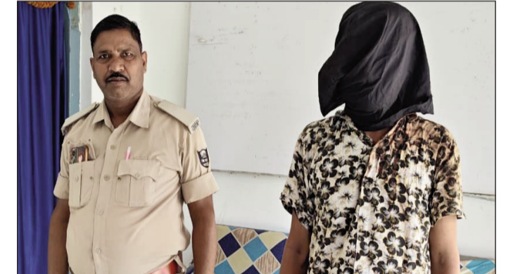
पुलिस के गिरफ्त में आरोपी।