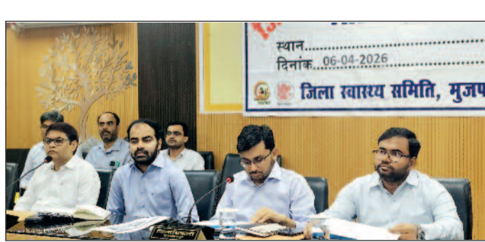
ईईएस नियंत्रण के लिए जन जागरूकता अभियान को तेज करने को ले बैठक करते जिलाधिकारी।