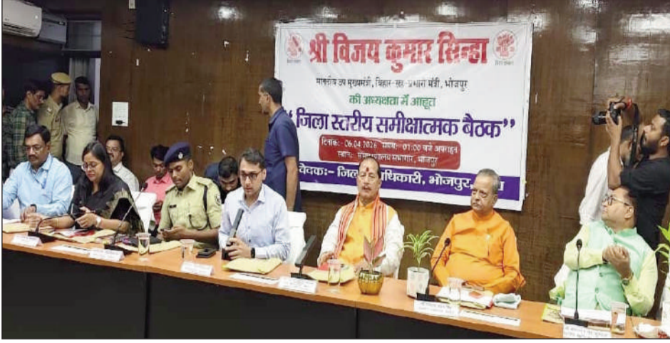
उपमुख्यमंत्री की अध्यक्षता में जिला स्तरीय समीक्षा बैठक आयोजित।

उन्होंने नगर आयुक्त भोजपुर को निर्देश दिया कि शहर के सभी प्रमुख स्थलों जैसे अस्पताल, बस स्टैंड, मुख्य बाजार आदि में स्वच्छता एवं साफ-सफाई सुनिश्चित की जाए तथा