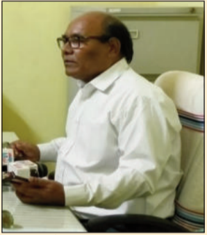
प्रेस वार्ता में घरेलू व व्यावसायिक एलपीजी की उपलब्धता की जानकारी देते डीपीआरओ।

मुजफ्फरपुर (एनएसबी)। जिले में घरेलू व व्यावसायिक एलपीजी आपूर्ति व्यवस्था सुचारु और संतोषजनक बनी हुई है। प्रेस वार्ता में डीपीआरओ ने बताया कि 91 एजेंसियों के माध्यम से प्रतिदिन करीब 19,754 घरेलू सिलेंडरों की आपूर्ति हो रही है। आईओसीएल, एचपीसीएल और बीपीसीएल के पास पर्याप्त स्टॉक उपलब्ध है, साथ ही ट्रॉजिट में भी सिलेंडर हैं, जिससे कमी की स्थिति नहीं है। व्यावसायिक गैस की आपूर्ति भी सामान्य है और प्रतिदिन लगभग 421 सिलेंडरों की खपत हो रही है। प्रशासन ने बरदाश्त के लिए ऑनलाइन बुकिंग को बढ़ावा दिया है तथा समयबद्ध डिलीवरी सुनिश्चित करने के निर्देश दिए हैं। घरेलू गैस के दुरुपयोग पर सख्ती, नियमित जांच और कंट्रोल रूम के माध्यम से शिकायतों का त्वरित निपटारा किया जा रहा है। साथ ही, पीएनजी कनेक्शन का विस्तार जारी है। जिला प्रशासन ने सभी एजेंसियों को व्यवस्था दुरुस्त रखने और उपभोक्ताओं को निर्बाध सेवा देने का निर्देश दिया है।