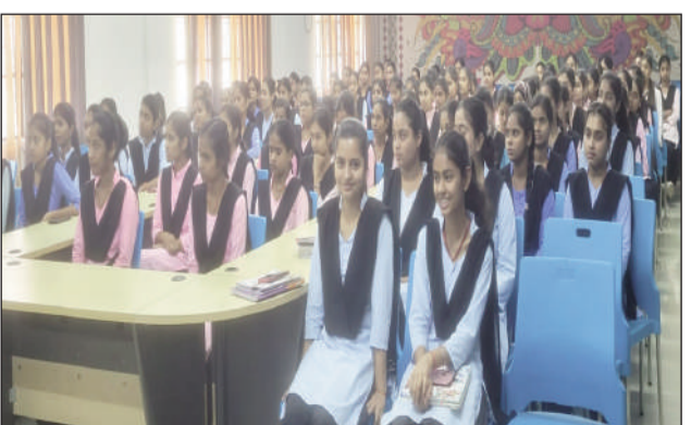
मानसिक स्वास्थ्य एवं नशा मुक्ति जागरूकता कार्यक्रम में छात्राएं।

उन्होंने विस्तार से समझाया कि कैसे आधुनिक जीवनशैली और नकारात्मक विचार मानसिक अवस्थता का कारण बनते हैं। छात्राओं को संबोधित करते हुए उन्होंने कहा कि मानसिक तनाव से बचने के लिए नशे का सहारा लेना शिक्षकों और अधिक भयावह बना देता है। इससे बचने के लिए मनोवैज्ञानिक प्रबंधन, समय पर पौष्टिक आहार, पर्याप्त नींद और नियमित योग-व्यायाम को अपनी दिनचर्या का हिस्सा बनाना अनिवार्य है। उन्होंने उदाहरणों के माध्यम