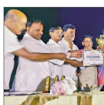
खिलाड़ियों को पुरस्कृत करते अतिथि व अन्य।