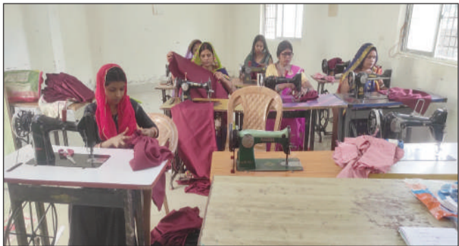
सिलाई करती जीविका दीदीयों।

चौथम (एनएसबी)। बिहार जीविका के द्वारा महिलाओं को आत्मनिर्भरता बनाने को लेकर जहां तरह-तरह के योजनाएं ला रही है, जीविका से जुड़ी महिलाओं को जीविका के द्वारा लगातार तरह-तरह के प्रशिक्षण दिए जा रहे हैं, कभी मशरूम की खेती तो कभी मछली पालन, सिलाई कढ़ाई से लेकर अन्यान्य विषयों पर प्रशिक्षित किये जा रहे हैं। वहीं जीविका से जुड़े महिलाओं के द्वारा भी अपने आत्मनिर्भरता को लेकर अपनी कड़ी मेहनत, और हर क्षेत्र में अपनी कड़ी भागीदारी को लेकर तटस्थ दिखे जा रहे हैं। मालूम हो कि बिहार ग्रामीण जीविकोपार्जन प्रोत्साहन समिति स्वयं सहायता समूह का मुख्य उद्देश्य ग्रामीण महिलाओं को संघटना से जोड़कर उन्हें आत्मनिर्भर सशक्त और आर्थिक रूप से समृद्ध बनाने हेतु कई तरह