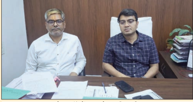
प्रेस कॉन्फ्रेंस करते पदाधिकारी

सुपौल (एनएसबी)। एलपीजी गैस सिलेंडर की आपूर्ति को सुचारू बनाए रखने एवं कालाबाजारी और जमाखोरी को रोकने के लिए सभी प्रखंड आपूर्ति पदाधिकारी, थाना अध्यक्ष सहित सभी संबंधित अधिकारी और कर्मी निरंतर