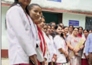
इंटरशिप के लिए छात्राओं को रवाना करते।

सहरसा शहर (एनएसबी)। स्नातकोत्तर गृहविज्ञान विभाग रमेशा झा महिला महाविद्यालय की सत्र 2024-2026 की चतुर्थ सेमेस्टर की सभी छात्राओं के शैक्षणिक और पेशेवर विकास को बढ़ावा देने के उद्देश्य से एक विशेष इंटरशिप लिए भेजा गया। इस पहल के तहत, छात्रों के विभिन्न समूहों को उनके संबंधित क्षेत्रों में व्यावहारिक अनुभव हेतु इन ट्रेनिंग प्राप्त करने के लिए प्रतिष्ठित स्वास्थ्य संस्थानों और औद्योगिक इकाइयों में भेजा गया है। मातृ एवं शिशु स्वास्थ्य और आहार प्रबंधन में छात्रों को आयुष अर्पाव नर्सिंग होम प्राइवेट लिमिटेड, नया बाजार, सहरसा में इंटरशिप के लिए प्रतिष्ठित किया गया है। यह इंटरशिप मुख्य रूप से निर्माणाधीन क्षेत्रों पर केंद्रित है। मातृ एवं शिशु स्वास्थ्य: गणावस्था और प्रसव के बाद की स्वास्थ्य देखभाल की बारीकियों को समझना। आहार प्रबंधन मरीजों, विशेषकर बच्चों और माताओं के लिए वैज्ञानिक पद्धति से संतुलित