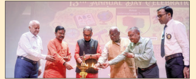
उद्घाटन करते अतिथि।

मोतिहारी(एन एस बी)। 15 अप्रैल से रेकट (डेटल) के सहयोग से हार्पिक सेफ सैनिटेशन प्रोग्राम के अंतर्गत बच्चों और स्थानीय समुदाय के लिए हाइजीन और सैनिटेशन पर विशेष कार्य शुरू किए जाएंगे। इस पहल का उद्देश्य बेहतर शिक्षा और स्वास्थ्य को बढ़ावा देना और समुदाय में स्वच्छता के प्रति जागरूकता फैलाना है। इस अवसर पर सांसद एवं पूर्व केंद्रीय पि एवं किसान कल्याण मंत्री राधा मोहन सिंह ने कहा कि स्वच्छता ही सेवा के अंतर्गत चल रहे इस कार्यक्रम का मुख्य उद्देश्य व्यवहार परिवर्तन के माध्यम से लोगों में स्वच्छता संबंधी आदतें विकसित करना है। कार्यक्रम के तहत बच्चों और समुदाय के लोगों