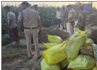
छापेमारी करते पुलिस।