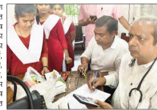
छात्राओं की टीम ने प्रोजेक्ट बालिका प्लस टू विद्यालय का किया भ्रमण।

पीरो (एनएसबी)। टयूनिंग आफ स्कूल कार्यक्रम के तहत प्लस टू उच्च विद्यालय जमुआंव की छात्राओं द्वारा प्रोजेक्ट बालिका प्लस टू उच्च विद्यालय जितौरा का भ्रमण कर वहाँ उपलब्ध संसाधनों, शैक्षणिक व्यवस्था, स्मार्ट क्लास, प्रयोगशाला, पुस्तकालय, म्यूजिकल उपकरण, कला रुम सहित कई अन्य व्यवस्थाओं व गतिविधियों की जानकारी प्राप्त की। प्रोजेक्ट बालिका प्लस टू उच्च विद्यालय की प्रभारी