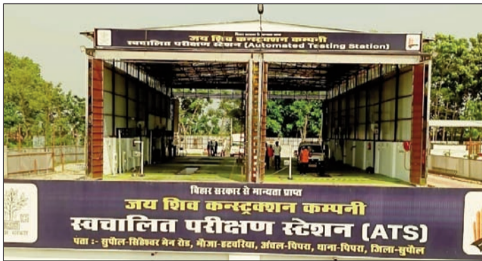
स्वचालित वाहन परीक्षण केंद्र

सुपौल। वाहनों के फिटनेस जांच के लिए सरकार द्वारा प्रस्तावित आधुनिक फिटनेस वाहन जांच केंद्र स्वचालित परीक्षण स्टेशन (एटीएस) की शुरुआत बीते 25 मार्च को सुपौल जिले के हटवरिया में की गई है। सुपौल जिला मुख्यालय से महज 04 किलोमीटर की दूरी पर सुपौल - सिंहेश्वर पथ पर अवस्थित यह एटीएस कोशी कमिश्नरी का पहला एवं बिहार राज्य का सातवां एटीएस है। जिसकी अनुमानित लागत 6 करोड़ के आसपास है। यह केंद्र सुपौल, सहरसा, मधेपुरा सहित आसपास के मधुबनी, अररिया और पूर्णिया जिलों के लिए पहला आधुनिक वाहन फिटनेस जांच केंद्र बन गया है। राज्य सरकार के निर्देश और सड़क परिवहन एवं राजमार्ग मंत्रालय के मानकों के अनुरूप स्थापित यह केंद्र वाहनों की जांच प्रक्रिया को पारदर्शी, वैज्ञानिक और तकनीक आधारित बनाने की दिशा में एक बड़ा कदम माना जा रहा है। इस एटीएस का संचालन जय शिव कंस्ट्रक्शन कंपनी द्वारा किया जा रहा है। यहां आधुनिक मशीनों के माध्यम से वाहनों की फिटनेस जांच की जा रही है, जिससे मानवीय त्रुटियों और अनावश्यक विलंब में कमी आएगी।