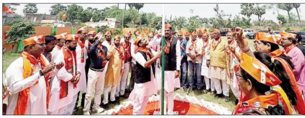
कार्यक्रम में उपस्थित भाजपाई।