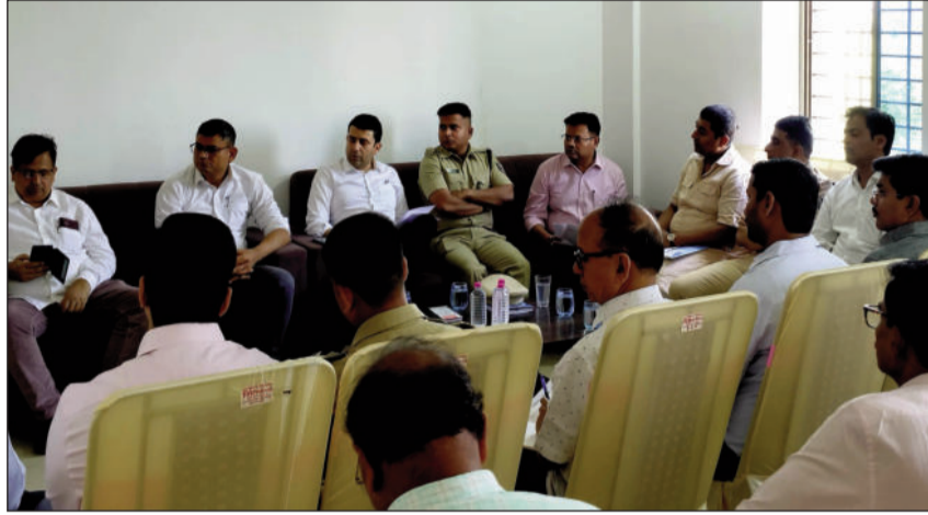
पुनौरा धाम मंदिर परिसर स्थित सभाकक्ष में समीक्षा बैठक में डीएम-एसपी, पर्यटन विभाग अभियंता, मंदिर न्यास समिति के सदस्य व अन्य।

बैठक के दौरान जिलाधिकारी ने निर्माण कार्य की वर्तमान स्थिति की विस्तृत समीक्षा करते हुए अब तक की प्रगति, कार्य की गुणवत्ता तथा निर्धारित समयसीमा के अनुरूप कार्य निष्पादन पर विशेष बल दिया। उन्होंने निर्माण एजेंसी को निर्देशित किया कि मंदिर निर्माण कार्य में अपेक्षित गति लाते हुए इसे तब समयसीमा के भीतर पूर्ण करना सुनिश्चित करें। साथ ही, कार्य में गुणवत्ता से किसी प्रकार का समझौता न करने की बात कही। जिलाधिकारी ने संबंधित विभागीय पदाधिकारियों को निर्देश दिया कि वे