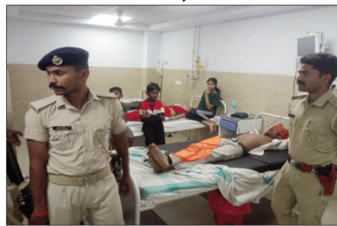
घायलों को अस्पताल लेकर पहुंचे पुलिसकर्मी।

घायलों में दो व्यक्ति ईंट भट्टा मजदूर बताए जा रहे हैं। सूचना मिलते ही पुलिस ने मौके पर पहुंचकर जांच-