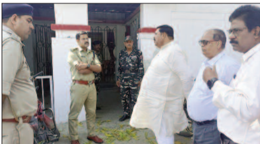
घटना स्थल पर पहुंचे एसएसपी, कुलपति से ले रहे घटना की जानकारी।

एफएसएल टीम के साथ मामले की जांच में जुटी पुलिस, घटना के कारणों का पता लगाने स्वयं घटनास्थल पर पहुंचे एसएसपी