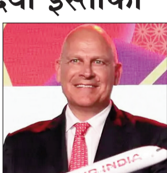
अहमदाबाद प्लेन क्रैश की रिपोर्ट आने के बाद पद छोड़ेंगे, सितंबर 2027 तक कार्यकाल था

नई दिल्ली (एजेंसी)। एअर इंडिया के चीफ एग्जीक्यूटिव ऑफिसर (सीओ) कैपबेल विल्सन ने इस्तीफा दे दिया है। न्यूज एजेंसी अठक ने मंगलवार को सूत्रों के हवाले से इसकी जानकारी दी। कई मीडिया रिपोर्ट्स में कहा गया है कि एअर इंडिया ने नए उड़क की तलाश भी शुरू कर दी है। सूत्रों के अनुसार, विल्सन सितंबर में अपना पद छोड़ सकते हैं। पिछले हफ्ते हुई कंपनी की बोर्ड बैठक में उनका इस्तीफा स्वीकार कर लिया गया है। विल्सन को सितंबर 2022 में एअर इंडिया का उड़क और प्रबंध निदेशक (टुक) नियुक्त किया गया था। उनका कॉन्ट्रैक्ट 5 सालों के लिए, जुलाई 2027 तक था। रिपोर्ट्स के अनुसार, एयरलाइन अहमदाबाद प्लेन क्रैश की फाइनल जांच रिपोर्ट आने के बाद नए उड़क की नियुक्ति करेगी। एयरक्राफ्ट एक्सीडेंट