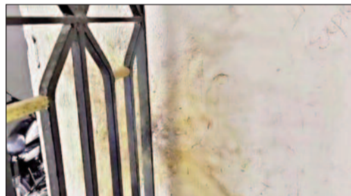
कुलपति आवास के गार्डरूम के बाहर बम विस्फोट के बाद दीवार पर पड़े निशान।