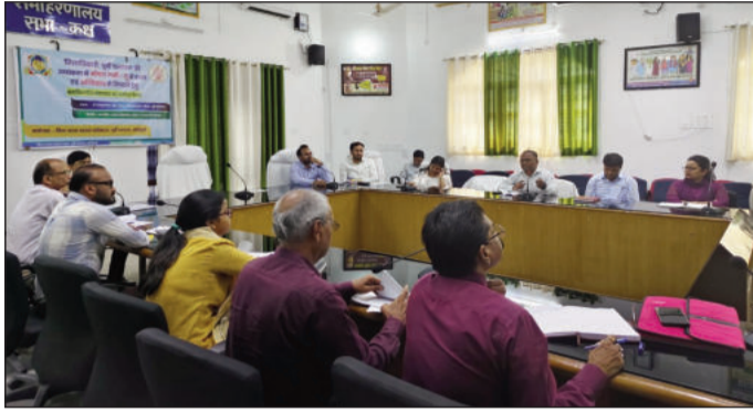
बैठक में उपस्थित अधिकारी।

बैठक में लू से निपटने के लिए स्वास्थ्य विभाग द्वारा किए गए इंतजामों की समीक्षा की गई। अनुमंडलीय अस्पतालों एवं सदर अस्पताल में कूलिंग रूम और विशेष बेड की व्यवस्था की गई।