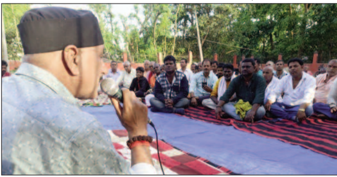
शिव व उनकी शिष्यता में उपस्थित गुरु भाई।