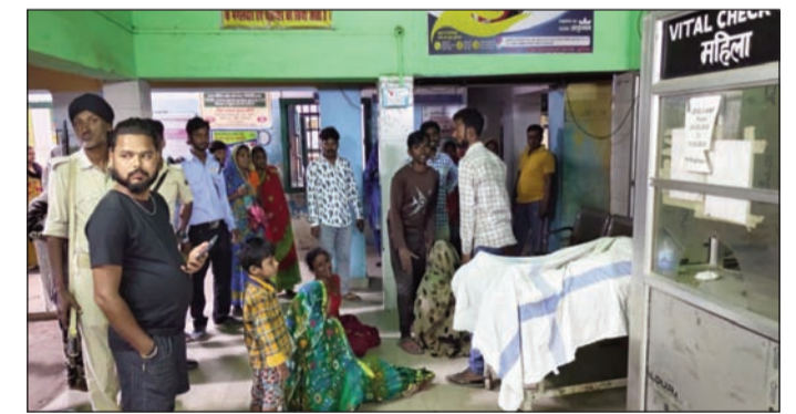
असमाल में जुटे लोगों की भीड़

राधोपुर (सुपौल)। करजाइन थाना क्षेत्र अंतर्गत एनएच-106 स्थित वायसी चौक के समीप रविवार देर शाम एक हृदयविरादक सड़क हादसे में 21 वर्षीय युवक की दर्दनाक मौत हो गई। इस घटना के बाद इलाके में शोक की लहर दौड़ गई है, वहीं मृतक के परिवार में कोहराम मचा हुआ है।