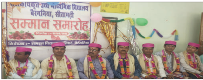
समारोह में सम्मानित स्थानांतरित शिक्षक।