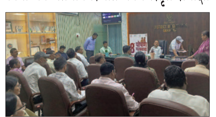
बैठक में अधिकारियों को निर्देश देते डीएम।