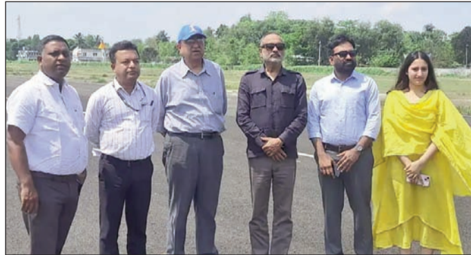
हवाई अड्डा का जायजा लेते पदाधिकारी।

अउकके साथ हुआ समझौता, छह सदस्यीय टीम ने वीरपुर हवाई अड्डा का लिया जायजा