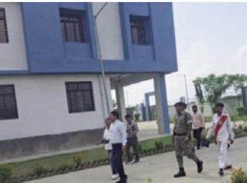
निरीक्षण करते डीएम।