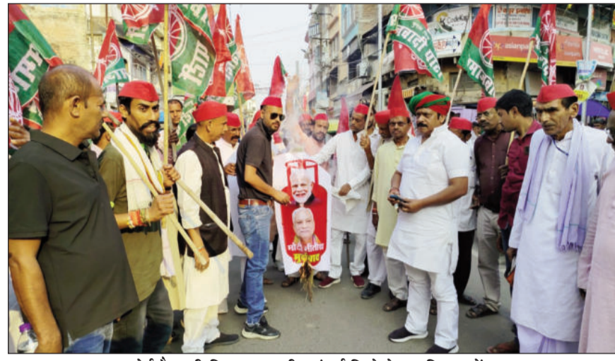
रसोई गैस की किल्लत बढ़ती महंगाई जिले के हर विभाग में व्याप्त अराजकता लूट खसोट को लेकर पीएम सीएम का पुतला दहन करते समाजवादी पार्टी के कार्यकर्ता।