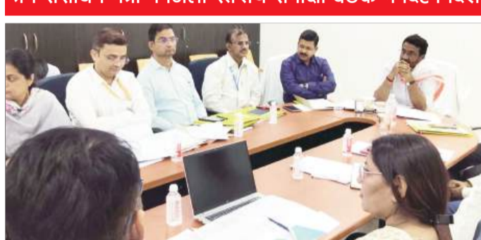
जिला अतिथि गृह में अधिकारियों के साथ बैठक करते मंत्री।

श्रम संसाधन मंत्री ने जिला स्तरीय समीक्षा बैठक में दिए निर्देश