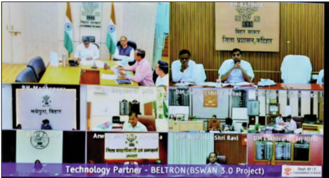
मुख्य सचिव, बिहार की अध्यक्षता में भी वीडियो कॉन्फ्रेंसिंग के माध्यम जुड़े जिलाधिकारी व अन्य।

क्रियान्वयन के लिए उप विकास आयुक्त, सीतामढ़ी की अध्यक्षता में एक कमिटी गठित की गई है। कमिटी में सदर, पुपरी एवं बेलसंड के एसडीओ, जिला पंचायत राज पदाधिकारी, जिला