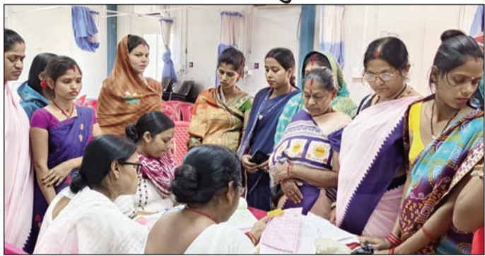
स्वास्थ्य जांच करते चिकित्सक व स्वास्थ्य कर्मी।

राधोपुर (सुपौल)। प्रधानमंत्री सुरक्षित मातृत्व अभियान के तहत गुरुवार को विशेष स्वास्थ्य शिविर का आयोजन किया गया। यह शिविर राधोपुर रेफरल अस्पताल सहित क्षेत्र के तीन स्वास्थ्य केंद्रों पर लगाया गया, जिसमें कुल 327 गर्भवती महिलाओं की जांच की गई। इस अभियान का मुख्य उद्देश्य गर्भावस्था के दौरान संभावित जटिलताओं की समय रहते पहचान कर मां और शिशु के स्वास्थ्य को सुरक्षित करना है। शिविर के दौरान महिलाओं की हीमोग्लोबिन, ब्लड प्रेशर, मधुमेह, वजन, यूरिन एल्ब्यूमिन और ब्लड ग्रुप जैसी आवश्यक जांचें की गईं। चिकित्सकों के अनुसार, जांच में कई महिलाओं ने एनीमिया, उच्च रक्तचाप, मधुमेह और असामान्य वजन जैसी समस्याएं पाईं गईं। एनीमिया से ग्रस्त महिलाओं को आयरन की गोलियां दी गईं और उन्हें संतुलित आहार लेने की सलाह दी गई। आंकड़ों के अनुसार, राधोपुर रेफरल अस्पताल में सबसे