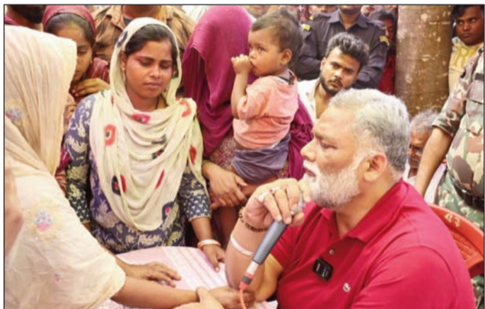
पीड़ित परिजनों से मुलाकात करते सांसद पप्पू यादव।