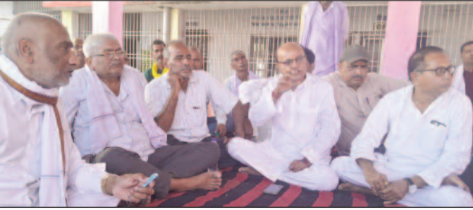
बैठक करते संगठन के लोग।

मधुबनी (एनएसबी)। राष्ट्रीय ब्राह्मण महासभा, परशुराम सेवा संस्थान बिहार द्वारा लगातार अश्व तृतीया भगवान परशुराम प्रकट उत्सव दरभंगा प्रमंडलीय स्तर पर मजबूती से मनाया जाता रहा है। राष्ट्रीय ब्राह्मण महासभा परशुराम सेवा संस्थान के राष्ट्रीय संयोजक सह प्रदेश अध्यक्ष बिहार ने कहा कि इस बार महलों में दो माह पूर्व ही दरभंगा जिला के बिरौल अनुमंडल में 19 अप्रैल रविवार को विशाल शोभायात्रा मोटरसाइकिल रैली और भगवान परशुराम मूर्ति पूजन विसर्जन कार्यक्रम के अनुसार 20 अप्रैल सोमवार को भी अश्व तृतीया पड़ता है तो दरभंगा मधुबनी और समस्तपुर की संगठनिक व्यवस्था संयुक्त रूप से 19 अप्रैल रविवार को पोखराम गांव में मनाया जाएगा। कार्यक्रम सुबह से ही प्रारंभ होगा जिसमें 8 बजे डुमरी चौक पर हजारों