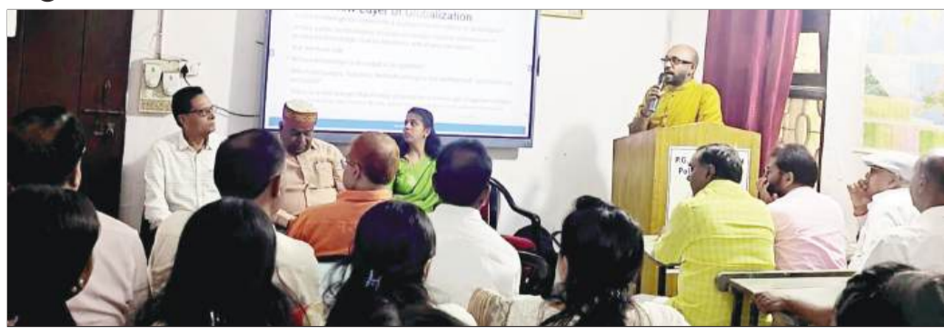
व्याख्यान को संबोधित करते वक्ता।