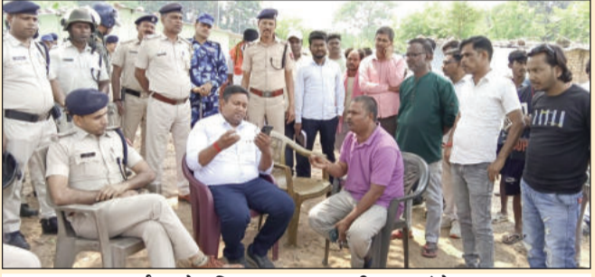
वार्ता करते पुलिस प्रशासन आरपीएफ एवं नेता।