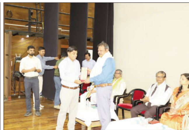
महानिदेशक का सम्मान करते सीडब्ल्यूएम एवं अन्य।

जमालपुर (मुंगेर) (एनएसबी)। रेलवे की ओर से 2 से 10 अप्रैल तक साधना सप्ताह समारोह का आयोजन हो रहा है। इरिमी एवं कारखाना की ओर से आयोजित हुई। कार्यक्रम का आयोजन कर्मचारियों को कर्मयोगी बनाने के दिशा में किया जा रहा है। इधर साधना सप्ताह के तहत कारखाना राजभाषा