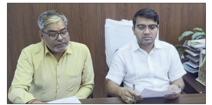
प्रेस कॉन्फ्रेंस कर जानकारी देते पदाधिकारी।

सुपौल (एनएसबी)। आवश्यक वस्तुओं और सेवाओं का निर्वाह उपलब्धता, प्रवासी श्रमिकों की सुरक्षा और निर्बाध ईंधन एवं छद्म गैस की आपूर्ति को सुचारू आपूर्ति बनाए रखने के लिए एवं कालाबाजारी और जमाखोरी को रोकने के लिए जिला प्रशासन, सुपौल पूरी सक्रियता से कार्य कर रही है। उक्त बातें जिला सूचना प्रेससंघ में व जिला आपूर्ति पदाधिकारी ने प्रेस कॉन्फ्रेंस के दौरान कही। उन्होंने कहा कि