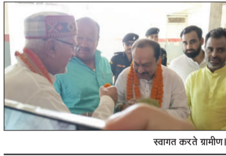
स्वागत करते ग्रामीण।