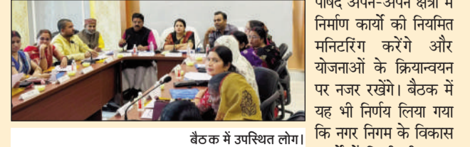
बैठक में उपस्थित लोग।

मोतिहारी(एनएसबी)। नगर निगम क्षेत्र में संचालित होने वाली विकास एवं निर्माण योजनाओं की निगरानी महापौर, उपमहापौर तथा सभी 46 निगम पार्षदों की देखरेख में की जाएगी। इस संबंध में महापौर, उपमहापौर एवं सभी पार्षदों ने एकमत होकर निर्णय लिया है कि नगर निगम क्षेत्र में बड़े पैमाने पर शुरू होने वाली निर्माण एवं विकास योजनाओं को उनकी निगरानी में गुणवत्तापूर्ण ढंग से पूरा कराया जाएगा। जनप्रतिनिधियों ने कहा कि विकास कार्यों की गुणवत्ता से किसी प्रकार का समझौता नहीं किया जाएगा तथा सभी योजनाओं को तेज गति से पूरा करने का प्रयास किया जाएगा। इसके लिए सभी