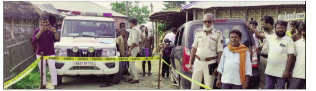
घटना स्थल पर जांच में जुटी एफएसएल टीम