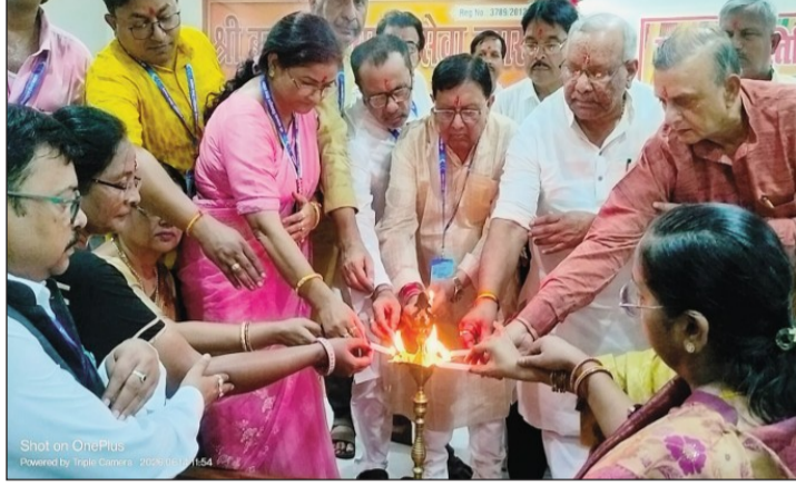
दीप प्रज्वलित कर कार्यक्रम का शुभारम्भ करते अतिथि व गणमान्य।