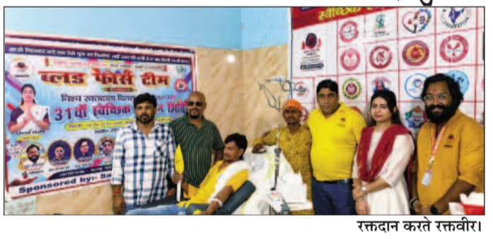
रक्तदान करते रक्तवीर।

समस्तीपुर (एनएसबी)। ब्लड फोर्स टीम के तत्वावधान में 31वां स्वैच्छक रक्तदान शिविर सफलतापूर्वक आयोजित किया गया। इस अवसर पर कुल 15 रक्तवीरों एवं रक्तविगंगनाओं ने उसाहपूर्वक भाग लेते हुए रक्तदान कर मानवता की सेवा का उत्कृष्ट उदाहरण प्रस्तुत किया।