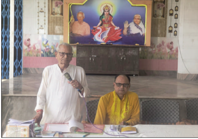
संबोधित करते अतिथि।