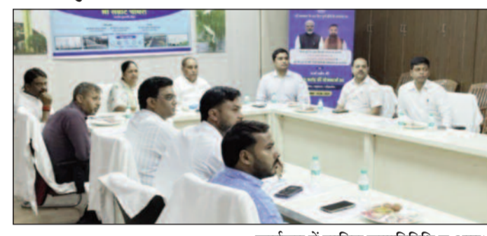
कार्यक्रम में शामिल जनप्रतिनिधि व अन्य।

समस्तीपुर (एनएसबी)। मुख्यमंत्री सम्राट चौधरी ने रविवार को वीडियो कॉन्फ्रेंसिंग के माध्यम से उत्तर बिहार पावर डिस्ट्रीब्यूशन कंपनी लिमिटेड (एनबीपीडीसीएल) की विभिन्न विद्युत अवसंरचना विकास योजनाओं का उद्घाटन एवं शिलान्यास किया। राज्य में विद्युत आपूर्ति व्यवस्था को और अधिक सुदृढ़ प्राप्ति सुदृढ़, विश्वसनीय एवं उपभोक्ता हितैषी बनाने के उद्देश्य से आयोजित इस कार्यक्रम के तहत विभिन्न विद्युत परियोजनाओं को जनाता को समर्पित किया गया। कार्यक्रम के दौरान लगभग ₹1274.03 करोड़ की लागत से पूर्ण एवं नई विद्युत परियोजनाओं का उद्घाटन एवं शिलान्यास किया गया। इनमें लगभग ₹1269.26 करोड़ की लागत से पूर्ण की गई योजनाओं का उद्घाटन तथा लगभग ₹4.77 करोड़ की लागत वाली योजनाओं का शिलान्यास शामिल है। इन परियोजनाओं के माध्यम से विद्युत वितरण तंत्र का सुदृढ़ीकरण, उपभोक्ताओं को बेहतर सेवाओं की उपलब्धता, विद्युत आपूर्ति की गुणवत्ता में सुधार तथा आधुनिक ग्राहक सेवा सुविधाओं का विस्तार सुनिश्चित किया जाएगा।