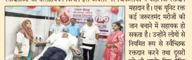
रक्तदान करते लोग।