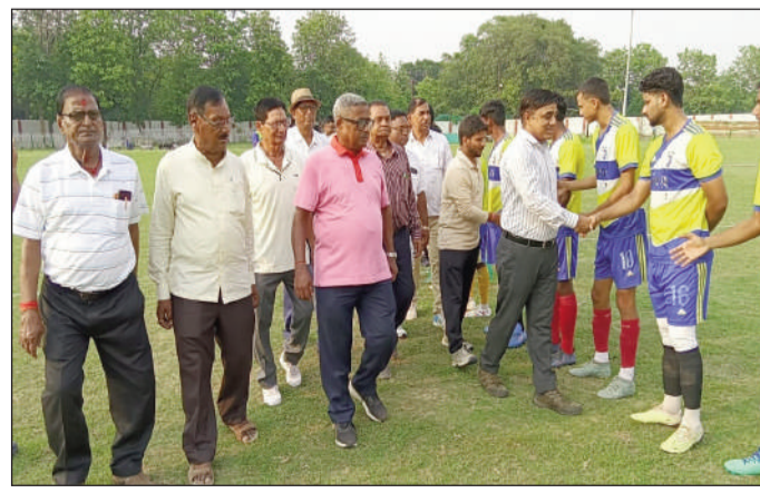
विजेता टीम को ट्राफी देते मुख्य अतिथि सीडब्ल्यूएम सहित अन्य।

हाथ मिलाकर बेहतर प्रदर्शन करने की शुभकामना दी। वहीं फाइनल मैच के विजेता एवं उपविजेता टीम को ट्राफी प्रदान करते दोनों टीम को बधाई दिए। इधर अतिथियों का स्वागत बुने, अंग वस्त्र एवं स्मृति चिन्ह भेंट कर मैकेनिकल रीक्रिएशन क्लब के अध्यक्ष