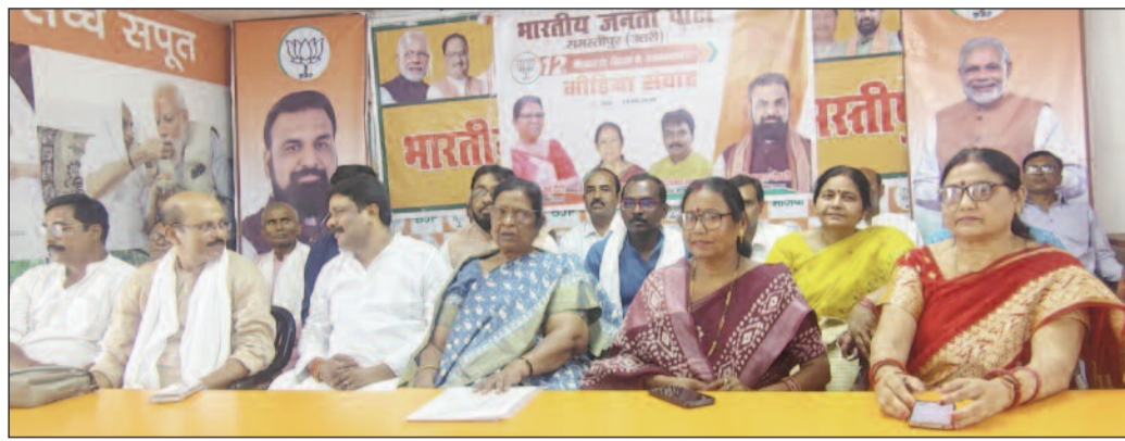
मंचासीन भाजपा नेता व अन्य।