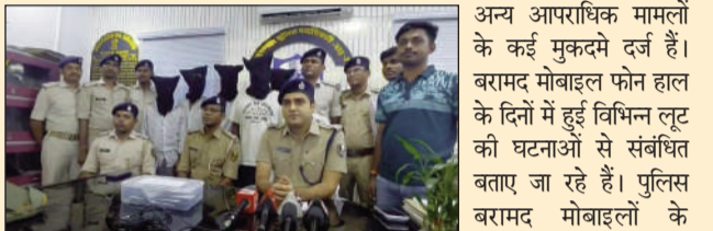
लूट घटना से पहले वार सड़क लुटेरे पुलिस गिरफ्तार में।

बाढ़ (दैनिक नवसंदेश)। फोरलेन सड़क पर सुबह-सुबह राहगीरों को निशाना बनाकर लूटपाट की घटनाओं को अंजाम देने वाले एक सक्रिय गिरोह का बाढ़ थाना पुलिस ने पर्दाफाश किया है। पुलिस ने गिरोह के पांच सदस्यों को गिरफ्तार कर उनके कब्जे से लूट के 15 मोबाइल फोन, एक कार तथा एक बाइक बरामद की है। एसडीपीओ रामधन ने शनिवार को आयोजित प्रेस वार्ता में बताया कि गिरफ्तार अपराधी सफेद रंग की कार का इस्तेमाल कर सुनसान स्थानों पर राहगीरों और यात्रियों को अपना शिकार बनाते थे। गिरोह के सदस्य विशेष रूप से सुबह के समय फोरलेन मार्ग पर सक्रिय रहते थे और मोबाइल फोन लूट कर लूटपाट करने के अंजाम देकर फरार हो जाते थे। पुलिस को लगातार मिल रही शिकायतों और तकनीकी अनुसंधान के आधार पर विशेष अभियान चलाया गया। अभियान के दौरान गिरोह के पांच सदस्यों को गिरफ्तार कर लिया गया। पूछताछ में आरोपितों ने कई लूट की घटनाओं में अपनी संलिप्तता स्वीकार की है। एसडीपीओ ने बताया कि गिरफ्तार अपराधियों के विरुद्ध भदौर, मोकामा तथा बाढ़ थाना क्षेत्रों में लूट एवं अन्य आपराधिक मामलों के कई मुकदमे दर्ज हैं। बरामद मोबाइल फोन हाल के दिनों में हुई विभिन्न लूट की घटनाओं से संबंधित बताए जा रहे हैं। पुलिस बरामद मोबाइलों के वास्तविक मालिकों की पहचान करने में जुटी है।