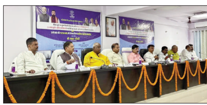
बैठक में उपस्थित लोग।

मोतिहारी(एनएसबी)। प्रधानमंत्री सूर्य घर मुफ्त बिजली योजना के अंतर्गत बिहार सरकार द्वारा संचालित यूएएलए (ः) परियोजना का शुभारंभ माननीय मुख्यमंत्री श्री सम्राट चौधरी द्वारा वीडियो कन्फ्रेंसिंग के माध्यम से किया गया। इस महत्वाकांक्षी योजना पर लगभग 1,512 करोड़ रुपये की लागत आएगी, जिसके तहत राज्य के 25 लाख कुटीर ज्योति उपभोक्ताओं को लाभान्वित किया जाएगा। इसके अंतर्गत योजना के प्रथम चरण में पूर्वी चंपारण जिले के 13,167 उपभोक्ताओं के घरों पर निःशुल्क सोलर पैनल स्थापित किए जाएंगे, जिससे उन्हें स्वच्छ एवं किफायती ऊर्जा उपलब्ध होगी तथा बिजली बिल में उल्लेखनीय कमी आएगी। यह योजना राज्य में अक्षय ऊर्जा को बढ़ावा देने और ऊर्जा