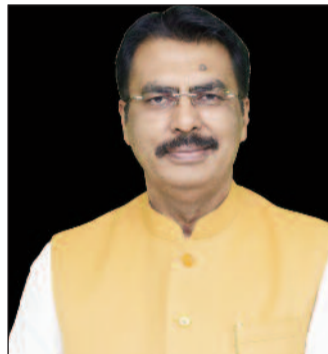
संजय सरावगी प्रदेश अध्यक्ष भाजपा।

दरभंगा (एनएसबी)। भारतीय जनता पार्टी के प्रदेश अध्यक्ष संजय सरावगी ने कहा कि बिहार का खजाना खाली नहीं है, बल्कि विकास और जनकल्याण की योजनाओं से समृद्ध है। आर्थिक सर्वेक्षण के आंकड़े बता रहे हैं कि खजाना नहीं, बल्कि तेजस्वी यादव का दिमाग तथ्यों और वास्तविकता से पूरी तरह खाली हो गया है। बिहार की अर्थव्यवस्था आज विकास और आत्मनिर्भरता की नई ऊंचाइयों को छू रही है। बिहार आर्थिक सर्वेक्षण 2025-26 के आंकड़े स्पष्ट रूप से बताते हैं कि राज्य का आर्थिक प्रदर्शन राष्ट्रीय औसत से बेहतर है और विपक्ष द्वारा राज्य के खजाने को खाली बताने का दावा पूरी तरह भ्रामक एवं तथ्यहीन है। वर्ष 2024-25 में बिहार का सकल राज्य घरेलू उत्पाद वर्तमान कीमतों पर 13.1 प्रतिशत की वृद्धि के साथ 9,91,997 करोड़ रुपये तक पहुंच गया, जबकि राष्ट्रीय औसत मात्र 9.8 प्रतिशत रहा। स्थिर कीमतों पर भी बिहार ने 8.6