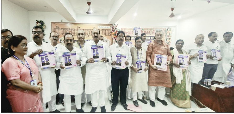
कलवार उत्सव-2026 स्मारिका का विमोचन करते अतिथिगण।

क्षेत्र में किए जा रहे प्रयासों की सराहना करते हुए कहा कि अतिथि भवन का निर्माण समाज के लिए एक महत्वपूर्ण उपलब्धि है। वहीं पूर्व उपमुख्यमंत्री तारकिशोर प्रसाद ने कहा कि ऐसे संस्थागत निर्माण सामाजिक एकजुटता को