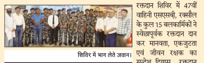
शिविर में भाग लेते जवान।