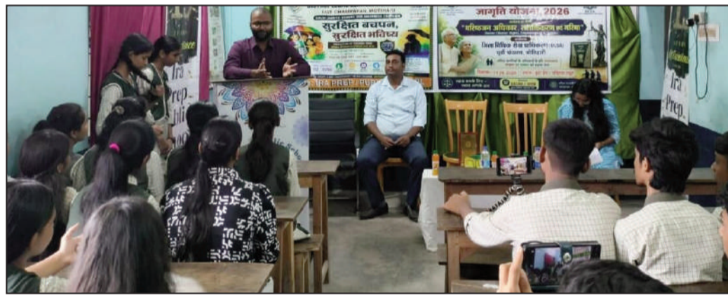
शिविर में भाग लेते लोग।