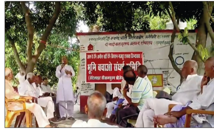
किसान महापंचायत को सम्बोधित करते किसान नेता व उपस्थित अन्य।

में सर्वसम्मति से प्रस्ताव पारित कर सीएम से मांग की गई कि देश की सबसे उपजाऊ सीतामढ़ी की भूमि को लैंड पुलिंग योजना तथा लैंड लॉक से मुक्त कर कृषि विशेष क्षेत्र घोषित करें तथा खेत तथा रोजी-रोटी बचाने के लिए मनियारी पोखर पर किसान महापंचायत आयोजित कर संघर्ष तेज करने का ऐलान किया। सर्वसम्मति प्रस्ताव द्वारा तय किया गया कि सरकार सीतापुरम प्रोजेक्ट वापस ले नहीं तो 15 दिन बाद किसान-मजदूर समाहरणालय का घेराव करेंगे।