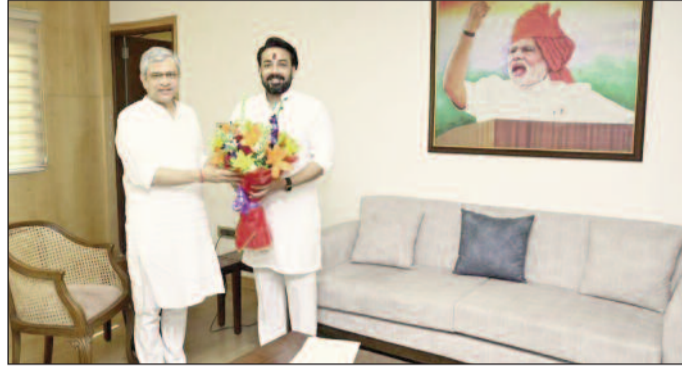
रेलमंत्री से मिलते खगड़िया सांसद