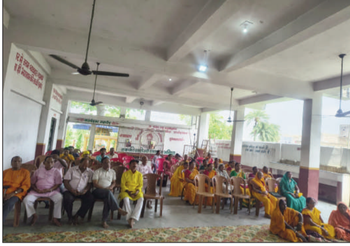
बैठक करते गायत्री परिवार।

जमालपुर (मुंगेर) (डीएनएस)। शांतिकुंज हरिद्वार से नगर में दिव्य ज्योति रथ के आगमन और 18 जुलाई तक परिभ्रमण का संदेश दिया जाया। साथ ही गायत्री शक्तिपीठ, जमालपुर में प्रखंड के नैतिक कार्यकर्ताओं की बैठक हुई।