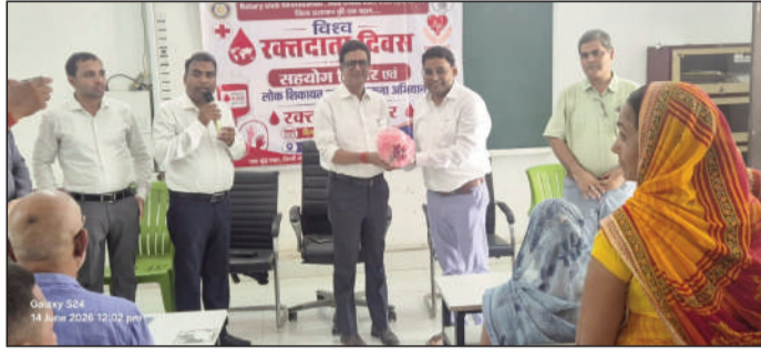
कार्यक्रम में उपस्थित लोग।

रेड क्रस सोसाइटी, पूर्वी चम्पारण जिले में रक्तदान के प्रति जागरूकता बढ़ाने तथा स्वीच्छक रक्तदान को प्रोत्साहित करने के लिए लगातार प्रयास किए जा रहे हैं। उनके मार्गदर्शन एवं विशेष पहल से आयोजित नागरिकों को समय पर सरकारी सहायता, सेवा अथवा योजना का लाभ प्राप्त नहीं हो पाता है, तो उसके समाधान के लिए सहयोग शिविर एवं लोक शिकायत निवारण व्यवस्था जैसे प्भावी मंच उपलब्ध कराए गए हैं। उन्होंने कहा कि