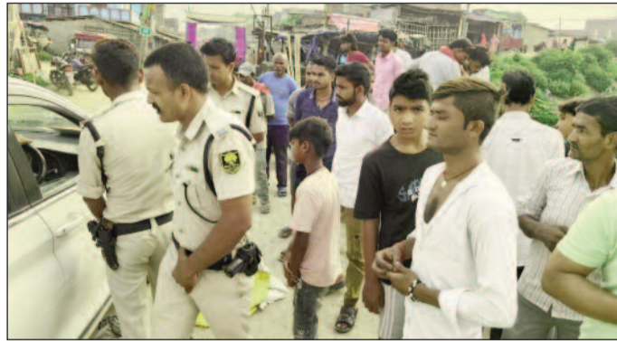
घटनास्थल पर पुलिस व्यवस्था