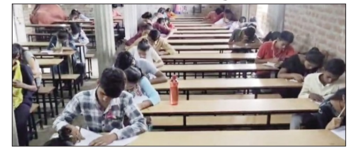
परीक्षा देते छात्र।

कुर्था (एनएसबी)। राज्य शिक्षा शोध एवं प्रशिक्षण परिषद द्वारा आयोजित मेधा छात्रवृत्ति परीक्षा (कक्षा 8) में आर्यभट्ट शैक्षणिक संस्थान के छात्रों ने उत्कृष्ट प्रदर्शन करते हुए संस्थान एवं क्षेत्र का नाम रोशन किया है। संस्थान की ओर से जारी जानकारी के अनुसार जिले के कुल 44 छात्र-छात्राओं का चयन हुआ है, जिनमें आर्यभट्ट शैक्षणिक संस्थान के 13 विद्यार्थियों ने सफलता प्राप्त कर अपना परचम लहराया है। प्राप्त जानकारी के अनुसार चयनित विद्यार्थियों में अरवल प्रखंड से 4, करपी से 5, कलेर से 8, कुर्था से 23 तथा वंशी प्रखंड से 8 छात्र-छात्राएं शामिल हैं। इनमें आर्यभट्ट शैक्षणिक संस्थान के 13 विद्यार्थियों ने सफलता हासिल कर संस्थान की शैक्षणिक गुणवत्ता को एक बार फिर साबित किया है। संस्थान प्रबंधन ने सभी सफल विद्यार्थियों एवं उनके अभिभावकों को बधाई देते हुए कहा कि यह उपलब्धि छात्रों की मेहनत, अभिभावकों के