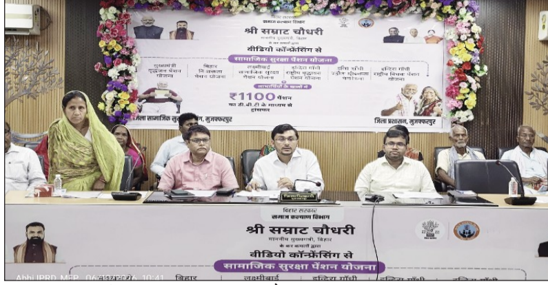
पेंशन उत्सव कार्यक्रम के लाइव प्रसारण के दौरान समाहरणालय सभागार में पेंशनधारियों को संबोधित करते डीएम।

गरीब, वृद्ध, विधवा और दिव्यांगजनों के जीवन में सकारात्मक बदलाव लाने वाला कदम बताया। पेंशन उत्सव कार्यक्रम के दौरान इंदिरा गांधी राष्ट्रीय वृद्धावस्था पेंशन योजना के 1,25,009 लाभार्थियों के खातों में 13 करोड़ 77 लाख 59 हजार 100 रुपये, इंदिरा गांधी राष्ट्रीय विधवा पेंशन योजना के 27,073 लाभार्थियों के खातों में 2 करोड़ 99 लाख 56 हजार 600 रुपये, इंदिरा गांधी राष्ट्रीय निःशुक्रता पेंशन योजना के 2,282 लाभार्थियों के खातों में 25 लाख 10 हजार 200 रुपये, लक्ष्मीबाई सामाजिक सुरक्षा पेंशन योजना के 25,482 लाभार्थियों के खातों में 2 करोड़ 85 लाख 79 हजार 600 रुपये तथा बिहार निःशुक्रता पेंशन योजना के 20,923 लाभार्थियों के खातों में 2 करोड़ 39 लाख 10 हजार 200 रुपये की राशि भेजी गई। इसी प्रकार मुख्यमंत्री वृद्धजन पेंशन योजना