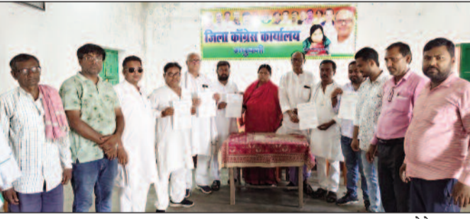
प्रमाण पत्र देते अध्यक्ष