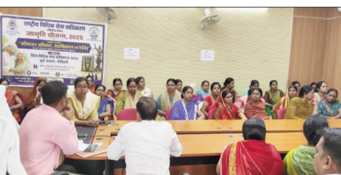
कार्यक्रम में उपस्थित लोग।

प्रशासन की सामूहिक जिम्मेदारी है। उन्होंने कहा कि जागरूकता के माध्यम से ही वरिष्ठजनों को उनके कानूनी अधिकारों और सरकारी योजनाओं का पूरा लाभ मिल सकता है। कार्यक्रम में वरिष्ठ नागरिकों के अधिकारों, भरण-पोषण,