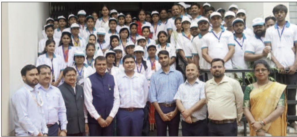
निरीक्षण के दौरान उपस्थित पदाधिकारी व अन्य।