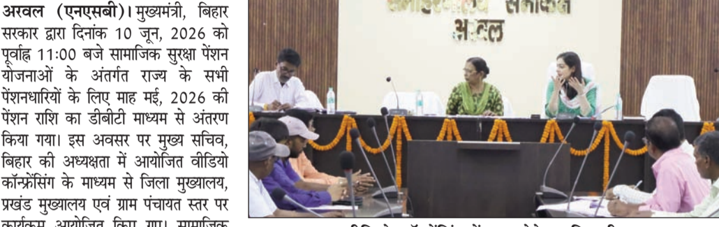
वीडियो कॉन्फ्रेंसिंग में भाग लेते पदाधिकारी।

अरवल (एसएनबी)। मुख्यमंत्री, बिहार सरकार द्वारा दिनांक 10 जून, 2026 को पूर्वाह्न 11:00 बजे सामाजिक सुरक्षा पेंशन योजनाओं के अंतर्गत राज्य के सभी पेंशनधारियों के लिए माह मई, 2026 की पेंशन राशि का डीबीटी माध्यम से अंतरण किया गया। इस अवसर पर मुख्य सचिव, बिहार की अध्यक्षता में आयोजित वीडियो कॉन्फ्रेंसिंग के माध्यम से जिला मुख्यालय, प्रखंड मुख्यालय एवं ग्राम पंचायत स्तर पर कार्यक्रम आयोजित किए गए। सामाजिक सुरक्षा पेंशन योजनाओं का मुख्य उद्देश्य समाज के कमजोर एवं वंचित वर्गों को आर्थिक सहायता एवं सामाजिक संबल प्रदान करना है, ताकि उनके आत्मसम्मान में वृद्धि हो तथा उन्हें गरिमापूर्ण जीवनयापन का अवसर प्राप्त हो सके। जिला मुख्यालय स्थित समाहरणालय सभाकक्ष में जिला