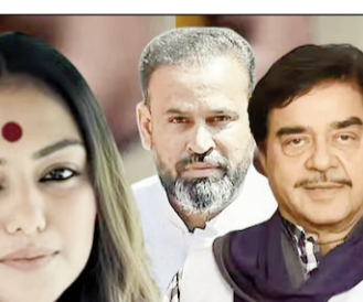
बताया जा रहा है कि इन सांसदों ने लोकसभा स्पीकर को हस्ताक्षर करके एक पत्र सौंपा है। हालांकि इस संबंध में पार्टी की ओर से आधिकारिक पुष्टि या विस्तृत प्रतिक्रिया अभी सामने नहीं आई है। इस सूची के सामने आने के बाद पश्चिम बंगाल की राजनीति में चर्चाओं का दौर तेज हो गया है। कारण, लोकसभा में तुण्मूल कांग्रेस के कुल 28 सांसद हैं। ऐसे में यदि बागी खेमे के 19 सांसदों के दावे सही साबित होते हैं, तो यह टीएमसी के लिए बड़ा राजनीतिक झटका माना जाएगा। फिलहाल सभी की नजरें इस बात पर टिकी हैं कि पार्टी नेतृत्व इस घटनाक्रम पर क्या

कोलकाता (एजेंसी) : ममता बनर्जी की मुश्किलें लगातार बढ़ती जा रही हैं। विधायकों के बाद अब बड़ी संख्या में सांसद भी बागी हो गए हैं। ऐसे ही 19 सांसदों की लिस्ट सामने आई है, जिनमें अभिनेता-राजनेता शत्रुघ्न सिन्हा और पूर्व क्रिकेटर यूसुफ पठान का नाम भी शामिल है।