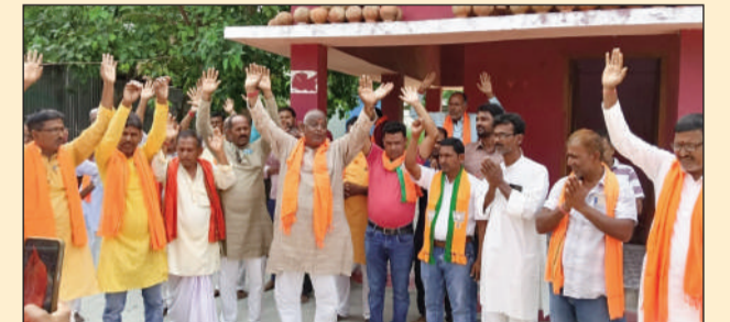
सुधियां मंगते भाजपा कार्यकर्ता।

पीपराकोठी(एनएसबी)। प्रधानमंत्री नरेंद्र मोदी ने देश के सबसे लंबे समय तक प्रधानमंत्री रहने का नया कीर्तिमान स्थापित किया है। इस उपलब्धि में बुधवार को स्थानीय शिव मंदिर परिसर में भाजपा कार्यकर्ताओं ने विधायक प्रमोद कुमार के नेतृत्व में विशेष हवन-पूजन का आयोजन किया। इस दौरान प्रधानमंत्री की दीर्घायु, उत्तम स्वास्थ्य और राष्ट्रहित में उनके निरंतर नेतृत्व की कामना की गई। वैदिक मंत्रोच्चार के बीच आचार्य किशन तिवारी ने विधिवत हवन-पूजन संपन्न कराया। कार्यक्रम में उपस्थित भाजपा कार्यकर्ताओं ने इसे देश के राजनीतिक इतिहास का गौरवपूर्ण क्षण