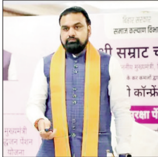
मुख्यमंत्री सम्राट चौधरी ने बुधवार को वीडियो कॉन्फ्रेंसिंग के माध्यम से नई दिल्ली स्थित बिहार भवन से समाज कल्याण विभाग द्वारा आयोजित डीबीटी कार्यक्रम के तहत राज्य के 94 लाख से अधिक सामाजिक सुरक्षा पेंशनधारियों के खाते में 1100 रुपए प्रति माह की दर से लगभग 1100 करोड़ रुपए की राशि हस्तांतरित की।

पटना (एनएसबी)। मुख्यमंत्री सम्राट चौधरी ने बुधवार को वीडियो कॉन्फ्रेंसिंग के माध्यम से नई दिल्ली स्थित बिहार भवन से समाज कल्याण विभाग द्वारा आयोजित डीबीटी कार्यक्रम के तहत राज्य के 94 लाख से अधिक सामाजिक सुरक्षा पेंशनधारियों के खाते में 1100 रुपए प्रति माह की दर से लगभग 1100 करोड़ रुपए की राशि हस्तांतरित की।