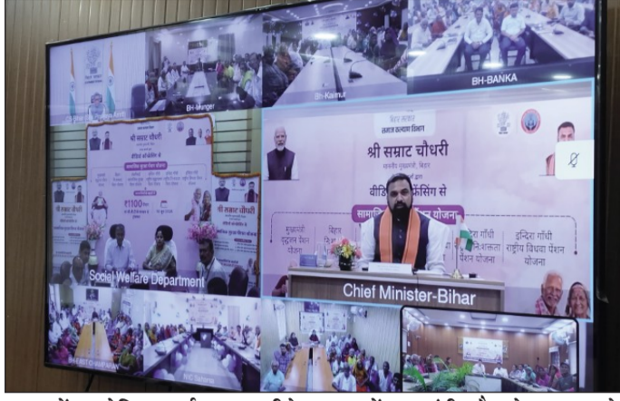
पटना में आयोजित कार्यक्रम का सीधे प्रसारण में मुख्यमंत्री और पूरे राज्य भर से जुड़े पेंशनधारी व अन्य।