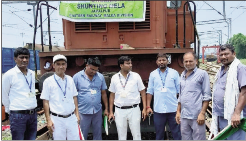
शंटिंग मेला का आयोजन करते स्टेशन प्रबंधक।

उन्होंने रनिंग डिपार्टमेंट से जुड़े फोल्ड स्टाफ,शंटमैन, शंटर और हंड्रेड्समैन को शंटिंग कार्य से जुड़ी तकनीकी जानकारी एवं सुरक्षा नियमों की विस्तृत जानकारी दी गई। स्टेशन प्रबंधक ने यह भी बताया कि रेलवे के प्रंटलाइन स्टाफ ही रेल परिचालन की असली ताकत