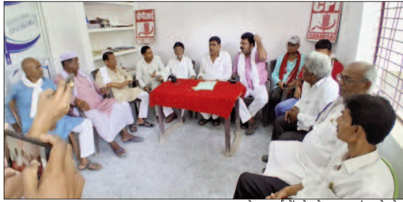
प्रेस वार्ता में बोलते महागठबंधन के नेता