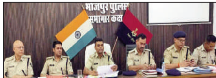
पुलिस अधीक्षक, भोजपुर के नेतृत्व में पुलिस अधीक्षक कार्यालय में मालिक अरराय मोर्चे का आयोजन किया गया।