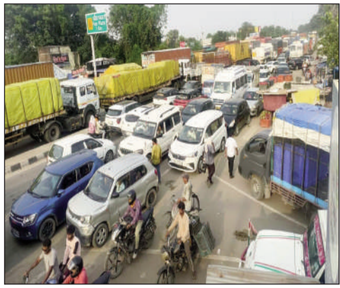
कुल्हड़िया टोल प्लाजा के पास भयावह स्थिति।

फोरलेन पर वाहनों की लंबी कतार लगने से यात्रियों, वाहन चालकों और स्थानीय लोगों को भारी परेशानी का सामना करना पड़ा। कई छोटे वाहन चालकों ने मुख्य सड़क छोड़कर ग्रामीण मार्गों का सहारा लिया, लेकिन वहाँ भी यातायात