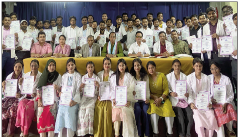
पाटलिपुत्र विश्वविद्यालय से प्राण संस्थान के छात्र-छात्राओं को दी गयी उपाधि।