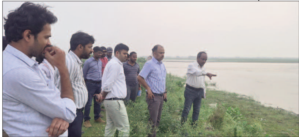
स्पर की वर्तमान स्थिति का जायजा लेते डीएम

जिलाधिकारी द्वारा सलखुआ प्रखंड के पूर्वी कोशी तटबंध 117 किलोमीटर पर अवस्थित स्पर का निरीक्षण