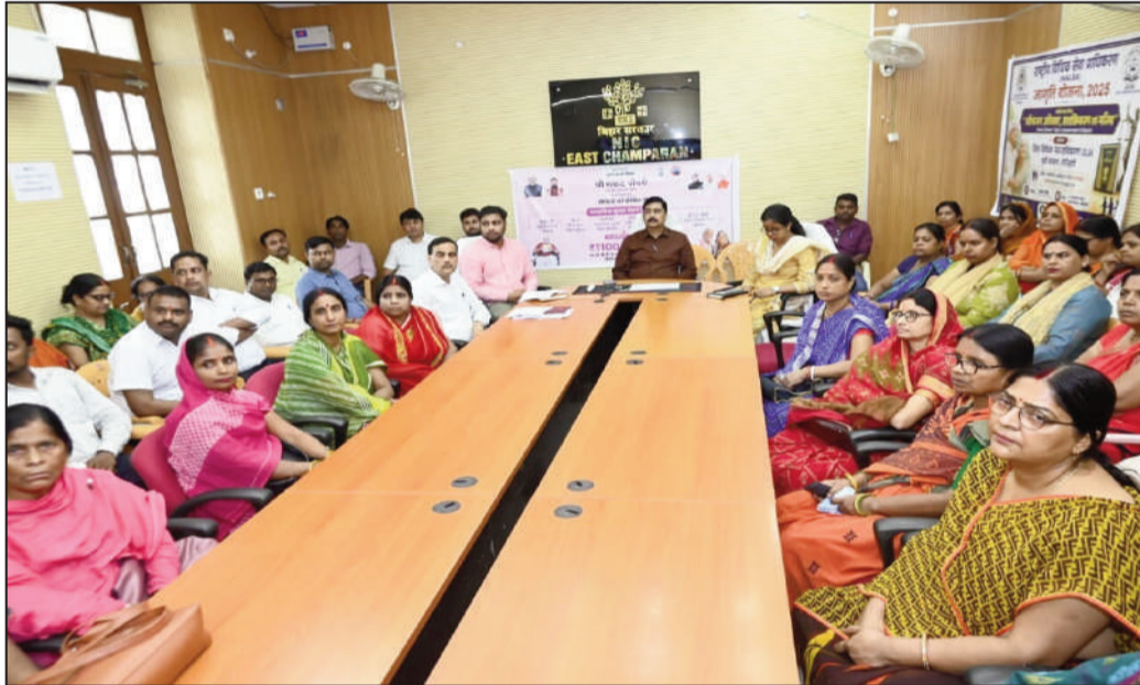
कार्यक्रम में उपस्थित लोग।

अधिकारियों ने बताया कि सामाजिक सुरक्षा पेंशन योजनाओं के तहत वृद्धजन, विधवा एवं दिव्यांग लाभुकों को डीबीटी के माध्यम से सीधे उनके बैंक खातों में पेंशन राशि उपलब्ध कराई जा रही है। इससे