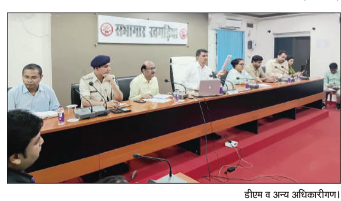
डीएम व अन्य अधिकारीगण।

खगड़िया। मुख्यमंत्री के निर्देशानुसार जिले के सभी प्रखंडों में 17 एवं 18 जून को प्रखंड सहयोग-सह-जन कल्याण शिविर का आयोजन किया जाएगा। शिविर का उद्देश्य केंद्र एवं राज्य सरकार द्वारा संचालित जनकल्याणकारी योजनाओं का लाभ प्राप्त लाभुकों तक पहुंचाना तथा आमजन की समस्याओं का त्वरित एवं प्रभावी समाधान सुनिश्चित करना है। जिलाधिकाारी ने जिलेवासियों से अपील की है कि वे अपने निकटवर्ती प्रखंड मुख्यालय में आयोजित शिविर में अधिक से अधिक संख्या में भाग लें तथा विभिन्न योजनाओं से संबंधित आवेदन, निबंध,