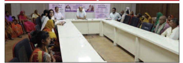
कार्यक्रम में शामिल डीएम व अन्य।

लाभुकों को बधाई दी और जिन पेंशनधारियों का जीवन प्रमाणिकरण लंबित है, उनसे जल्द से जल्द अपना जीवन प्रमाण पत्र अपडेट कराने की अपील की। जिला स्तरीय कार्यक्रम में उप विकास आयुक्त, अपर समाहर्ता, जिला जनसंपर्क पदाधिकारी, विशेष कार्य पदाधिकारी, जिला गोपनीय प्रशाखा, जिला प्रोग्राम पदाधिकारी (आईसीडीएस), जिला नजारेत उप समाहर्ता तथा सहायक निदेशक, जिला सामाजिक सुरक्षा कोषांग सहित अन्य पदाधिकारी उपस्थित रहे। अंत में जिलाधिकारी ने धन्यवाद ज्ञापन किया।