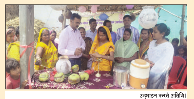
उद्घाटन करते अतिथि।