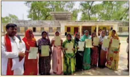
प्रदर्शन करते लोग।

कुर्था (एसएनबी)। प्रखंड के चिरारी बिगाहा गांव के 14 महादलित परिवारों ने वासगीत पर्चा की जमीन पर दखल-कब्जा दिलाने की मांग को लेकर सोमवार को कुर्था अंचल कार्यालय के समक्ष प्रदर्शन किया। प्रदर्शनकारियों ने आरोप लगाया कि वर्ष 2013 में उन्हें भूमि बंदोबस्ती का परवाना (वासगीत पर्चा) मिल चुका है, लेकिन 13 वर्षों बाद भी जमीन पर कब्जा नहीं दिलाया