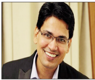
एजेंसी को नहीं मिले। हालांकि, मंगलवार को वो ऑफिस गए थे। संभावना जताई जा रही है कि गिरफ्तारी के डर से वो फरार हो गए हैं।