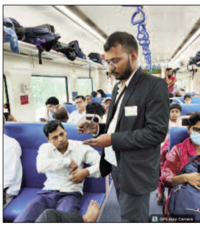
जांच करते रेलवे अधिकारी

जयनगर (एनएसबी)। रेलवे राजस्व को सुरक्षा तथा बिना टिकट यात्रा को रोकने के उद्देश्य से समस्तीपुर मंडल द्वारा मंगलवार को मंडल के विभिन्न प्रमुख रेलखंडों और स्टेशनों पर सघन टिकट जांच अभियान चलाया गया। इस विशेष अभियान के दौरान बिना टिकट एवं अनियमित यात्रा करने वाले 6,770 यात्रियों को पकड़ा गया, जिनसे जुमाना एवं अतिरिक्त किराये के रूप में कुल 55.50 लाख रुपये की वसूली की गई। रेलवे अधिकारियों के अनुसार अभियान मुजफ्फरपुर, बाूपशाम मोतिहारी, नरकटियागंज, रसैली, सीतामढ़ी, जयनगर, दरभंगा, समस्तीपुर, सहरसा तथा पूर्णिया कोर्ट सहित विभिन्न महत्वपूर्ण स्टेशनों एवं रेलखंडों में एक साथ चलाया गया। जांच अभियान में