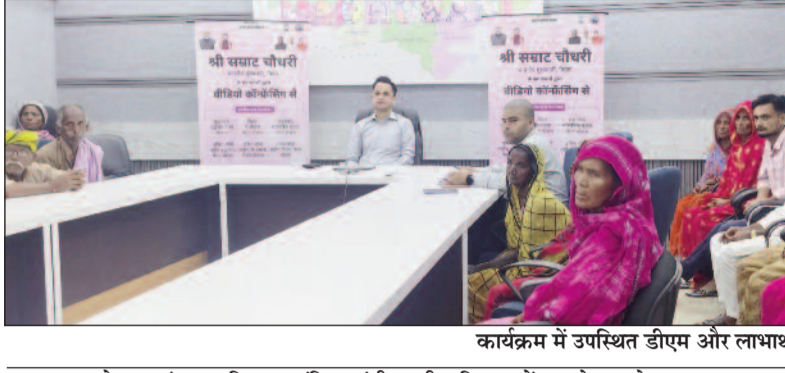
कार्यक्रम में उपस्थित डीएम और लाभार्थी

मधुबनी, (एनएसबी)। मुख्यमंत्री बिहार, सम्राट चौधरी जी के द्वारा बुधवार को राज्य के सभी छह प्रकार के सामाजिक सुरक्षा के कुल 94 लाख 29 हजार 6 सौ 98 पेंशनधारियों के खातों में मई 2026 माह की पेंशन राशि कुल 10 अरब 96 करोड़ 44 लाख 46 हजार रुपये का डीबीटी