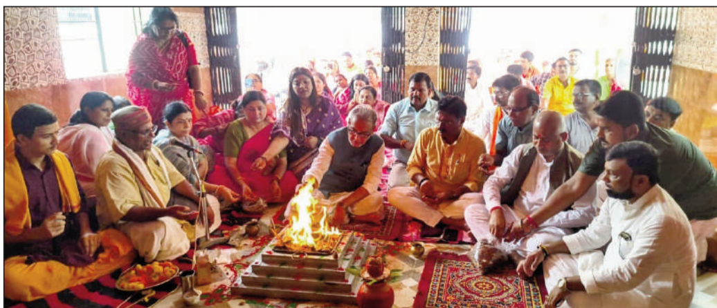
हवन करते सांसद व जन।

यह आयोजन प्रधानमंत्री नरेंद्र मोदी के दीर्घायु, स्वस्थ एवं यशस्वी जीवन की कामना को लेकर किया गया। इस अवसर पर सांसद श्री सिंह ने कहा कि एक निर्वाचित प्रधानमंत्री के रूप में नरेंद्र मोदी ने 9 जून तक 4398 दिनों का कार्यकाल पूरा कर लिया है, जो पंडित जवाहरलाल नेहरू के कार्यकाल की बराबरी करता है। उन्होंने कहा कि 10 जून को यह ऐतिहासिक उपलब्धि और आगे बढ़ गई है, जो देश के लोकतांत्रिक इतिहास में महत्वपूर्ण क्षण है।