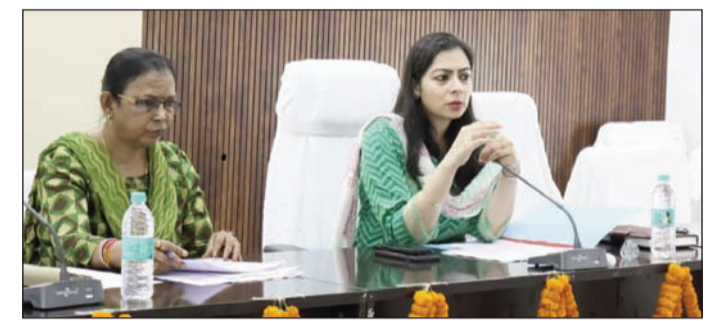
बैठक करते डीएम।

बैठक में जिले में चल रहे सर्वेक्षण एवं बंदोबस्त कार्यों की अद्यतन स्थिति की विस्तृत समीक्षा की गई तथा संबंधित पदाधिकारियों को कार्यों में और अधिक तेजी लाने का निर्देश दिया गया। बैठक में बताया गया कि जिले के कुल 312 राजस्व ग्रामों में ग्राम सीमा सत्यापन एवं किस्त्वान कार्य पूर्ण कर लिया गया है। इनमें से 303 राजस्व ग्रामों में खानापुरी कार्य पूर्ण हो चुका है। शिविरों के माध्यम से 253 राजस्व ग्रामों में प्रपत्र-06 लॉक किया गया है तथा 248 राजस्व ग्रामों में एलपीएम वितरित किया जा चुका है। समीक्षा के दौरान बताया गया कि 205 राजस्व ग्रामों का प्रारूप प्रकाशन (प्रपत्र-