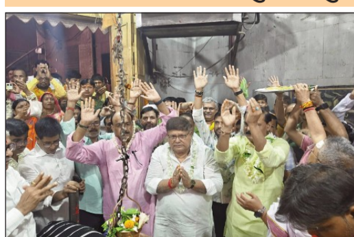
बाबा गरीबनाथ मंदिर में पूजा अर्चना करते भाजपा के नेतागण।