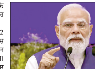
के लिए अनिवार्य थे, हमने बहुत ही सधे हुए तरीके से उन फैसलों को भी लिया। पहले की सरकार अनुच्छेद 370 की बात करने से डरती थीं, हमने अनुच्छेद 370 हटाकर पूरे देश में संविधान को समान रूप से लागू किया। प्रधानमंत्री ने कहा कि हम मध्यम वर्ग के सामने आने वाली चुनौतियों और बेहतर भविष्य की उनकी आकांक्षाओं को समझते हैं। उनकी सहायता के लिए, 12 लाख रुपए प्रति वर्ष तक की आय अब कर मुक्त है। आज देश एक सरल और पारदर्शी कर प्रणाली से लाभान्वित हो रहा है। बेहतर बुनियादी ढांचे ने दैनिक जीवन को आसान बना दिया है, और पिछले 12 वर्षों में मध्यम वर्ग के बच्चों के लिए नए अवसर सृजित हुए हैं। उन्होंने कहा कि राष्ट्र किसी भी राजनीतिक दल से बड़ा है, और जब हम 'राष्ट्र सवोर्धर' की भावना से काम करते हैं, तो कोई भी निर्णय कठिन नहीं होता।

बैठक को संबोधित करते हुए मोदी ने कहा, 12 साल में देश कांग्रेस के कुचक्र से आजाद हुआ। इस कुसंस्कृति का नाम कांग्रेस ग्रीष्म रेट था। इसमें न गवर्नेंस थी, न नीति, न नीयत और न ही निर्णय। नाकामी कांग्रेस की थी लेकिन कलंक हिंदू आबादी पर लगाया गया। उन्होंने कहा कि दल से बड़ा देश है और जब नेशन फर्स्ट की भावना से काम होता है, तो कोई भी निर्णय कठिन नहीं होता। ऐसे फैसले, जिन्हें पहले असंभव समझा गया और जो देश के सुरक्षित भविष्य