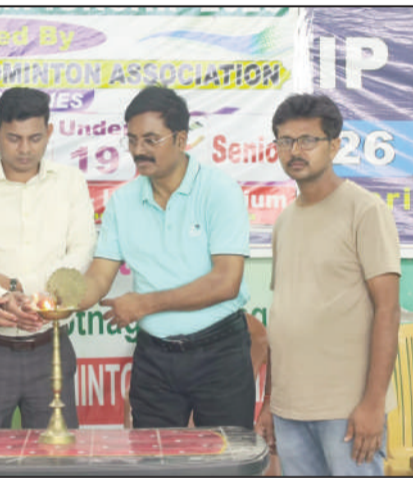
उद्घाटन करते खेल पदाधिकारी व अन्य।