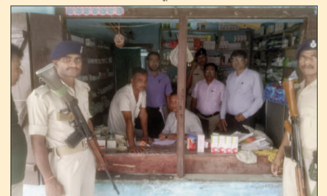
जांच करते औषधि निरीक्षकों की टीम।

मोतिहारी(एनएसबी)। पूर्वी चंपारण में स्वास्थ्य विभाग की टीम ने अवैध रूप से संचालित दवा दुकान के खिलाफ कार्रवाई करते हुए बड़ी मात्रा में एलोपैथिक दवाएं जब्त की हैं। यह कार्रवाई सिविल सर्जन, पूर्वी चंपारण द्वारा अग्रसारित परिवाद पत्र के