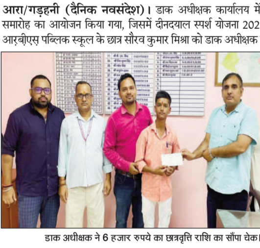
डाक अधीक्षक ने 6 हजार रुपये का छात्रवृत्ति राशि का सौंपा चेक।

दीनदयाल स्पर्ष योजना 2025-26 के अंतर्गत चयनित छात्र को किया गया पुरस्कृत