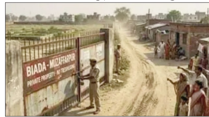
मुशहरी स्थित बियाडा द्वारा अधिग्रहित जमीन को लेकर मचा बवाल।

खड़े हो चुके हैं। हाल में बियाडा द्वारा पुराने अधिलेखों की जांच शुरू की गई और प्राथमिक दस्तावेजों के आधार पर अधिग्रहित भूमि को रोक सूची में शामिल करा दिया गया, जिससे जमीन मालिकों और स्थानीय लोगों की चिंता बढ़ गई है। इसके बाद रैयतों ने जिला प्रशासन से अधिग्रहण से जुड़े सभी दस्तावेज उपलब्ध कराने की मांग की है। वही मामले की गंभीरता को देखते हुए जिला भू-अर्जन