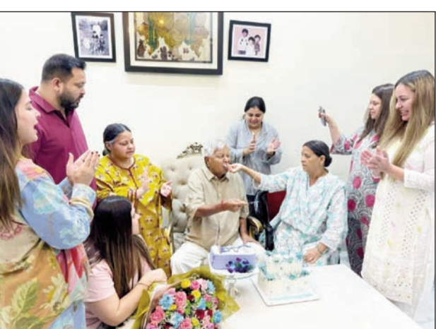
राजद सुप्रियो लालू प्रसाद यादव ने 78वां जन्मदिन पूरे परिवार के साथ मनाया। बुधवार को रात 12:00 बजे के बाद सोशल मीडिया पर केक काटते हुए तस्वीर साझा करते हुए नेता प्रतिपक्ष तेजस्वी यादव ने लिखा- 'हैप्पी बर्थडे पापा!'

अफगानिस्तान (एजेंसी)। पाकिस्तान की सेना ने अफगानिस्तान की सीमा से सटे इलाकों में हवाई हमले कर दिए। इन हमलों में जिन लोगों की मौत हुई है, उनमें ज्यादातर बच्चे शामिल हैं, जो पाकिस्तान का धिनीना चेहरा बेनकाब करने वाला है। अफगानिस्तान सरकार के प्रवक्ता जिबहुल्लाह मुजाहिद ने सोशल मीडिया प्लेटफॉर्म एक्स पर लिखकर जानकारी दी है कि पाकिस्तानी सेना ने कल रात एक बार फिर अफगानिस्तान के हवाई क्षेत्र का उल्लंघन किया और कुनार, खोस्त तथा पकतिका प्रांतों में आम नागरिकों के घरों पर बमबारी की। इन हमलों में 11 बच्चे, एक महिला और एक बुजुर्ग व्यक्ति की मौत हो गई। खोस्त प्रांत के एक अधिकारी ने बताया कि सेरा जिले में एक घर पर हुए हमले में 9 लोग मारे गए और 10 अन्य घायल हो गए। पकतिका प्रांत में एक अलग हमले में 3 लोगों की मौत हुई। अफगानिस्तान के इन आरोपों पर पाकिस्तान की सेना ने अभी तक इन हमलों पर कोई आधिकारिक प्रतिक्रिया नहीं दी है।