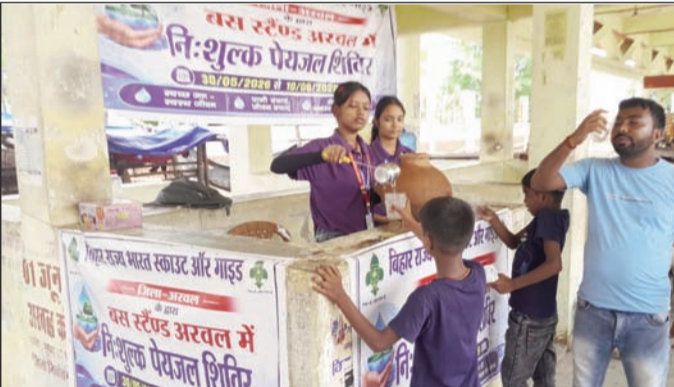
शिविर में पेयजल पिलाते बच्चे।

12 दिवसीय ग्रीष्मकालीन पेयजल सेवा शिविर का हुआ समापन