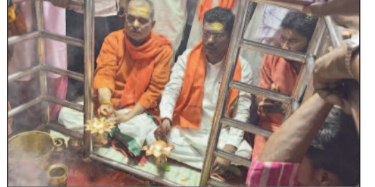
पूजा अर्चना करते सांसद

मधुबनी (एनएसबी)। देश के यशस्वी प्रधानमंत्री नरेंद्र मोदी जी के नेतृत्व में सेवा, सुशासन और राष्ट्र निर्माण के 12 वर्ष पूरे होने पर बाबा कपिलेश्वर स्थान मंदिर सहित विभिन्न मंदिरों में पूजा अर्चना। भारत लोकतंत्र के इतिहास में निर्वाचिता प्रधानमंत्री के रूप में सतत राष्ट्र सेवा के समर्पित सर्वाधिक लंबा कार्यकाल पूरा करने वाले