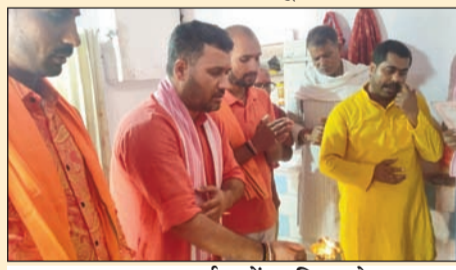
पूजा अर्चना में शामिल लोग।

कुर्था (एसएनबी)। देश के प्रधानमंत्री नरेंद्र मोदी के नेतृत्व में सेवा, सुशासन, विकास एवं गरीब कल्याण को समर्पित केंद्र सरकार के 12 वर्ष पूर्ण होने के उपलक्ष्य में किंजर स्थित सूर्य मंदिर प्रांगण में करपी उत्तरी मंडल अध्यक्ष