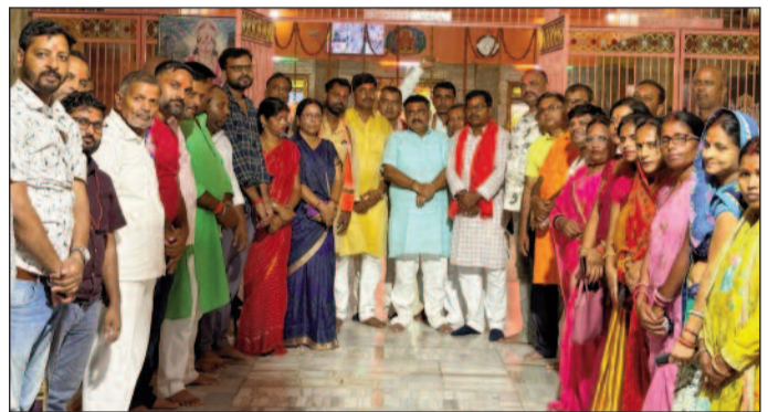
हनुमान चालीसा का पाठ करते पूर्व मंत्री व अन्य