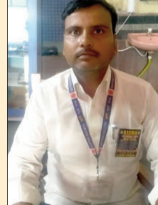
पदक जीतने वाले जिले के एथलीट।

बिहार एथलेटिक्स चैंपियनशिप में मुंगेर का शानदार प्रदर्शन जमालपुर (मुंगेर)। पटना के दालितपुर स्पोर्ट्स कम्प्लेक्स में 10 से 13 जून 2026 तक आयोजित 92वें बिहार जूनियर एवं सीनियर एथलेटिक्स चैंपियनशिप में मुंगेर जिले के खिलाड़ियों ने शानदार प्रदर्शन करते हुए दो स्वर्ण, एक रजत और एक कांस्य