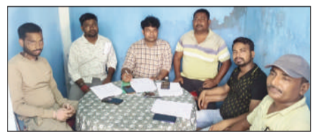
बैठक करते समाजसेवी सहित प्रतिनिधि।

जमालपुर (मुंगेर)। नगर परिषद जमालपुर क्षेत्र में व्याप्त बिजली संकट के विरोध में सोमवार को हस्ताक्षर अभियान चलाया गया। अभियान के माध्यम से साइथ बिहार पावर डिस्ट्रीब्यूशन कंपनी लिमिटेड के प्रबंध निदेशक को ज्ञापन भेजकर शहरी क्षेत्र के उपभोक्ताओं को पूर्वतन सफियाबाद विद्युत शक्ति उपकेंद्र से निर्बाध बिजली आपूर्ति बहाल करने की मांग की गई। नगर परिषद क्षेत्र के 36 वार्डों में से अधिकांश वार्डों को सफियाबाद पावर सब स्टेशन से बिजली मिल रही है, जबकि वार्ड संख्या 29 से 36 वार्ड 17 के कुछ हिस्सों के उपभोक्ताओं को रामचंद्रपुर विद्युत शक्ति उपकेंद्र से आपूर्ति दी जा रही है। इससे इन वार्डों के उपभोक्ताओं को प्रतिदिन केवल 12 से 14 घंटे ही बिजली मिल पा रही है, जबकि अन्य शहरी क्षेत्रों में लगभग 24 घंटे आपूर्ति हो रही है। ज्ञापन में कहा गया है कि