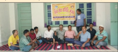
श्रावणी मेला के दौरान काँवरिया सेवा शिविर के आयोजन को लेकर बैठक करते शिव सेवा समिति के पदाधिकारी।