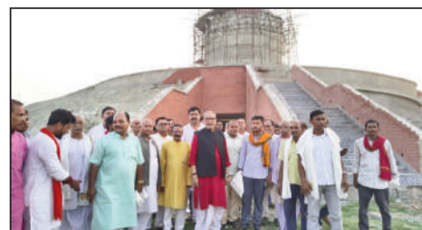
कार्यक्रम में उपस्थित लोग।

मोतिहारी (एनएसबी)। प्रधानमंत्री नरेंद्र मोदी के नेतृत्व में सेवा, सुशासन एवं गरीब कल्याण के 12 वर्ष पूर्ण होने के उपलक्ष्य में सोमवार को केसरिया स्थित बुद्धा होटल एंड कैफेटेरिया में आयोजित विशेष जनसंपर्क अभियान बैठक में पूर्व केंद्रीय पि एवं किसान कल्याण मंत्री तथा सांसद राधा मोहन सिंह शामिल हुए। बैठक को संबोधित करते हुए सांसद श्री सिंह ने कहा कि भारत को पांच ट्रिलियन डॉलर की अर्थव्यवस्था बनाना महत्वपूर्ण है। बल्कि देशवासियों का सामूहिक सपना है। उन्होंने कहा कि वर्ष 2014 के बाद देश में नीतिगत बदलावों, आर्थिक सुधारों और