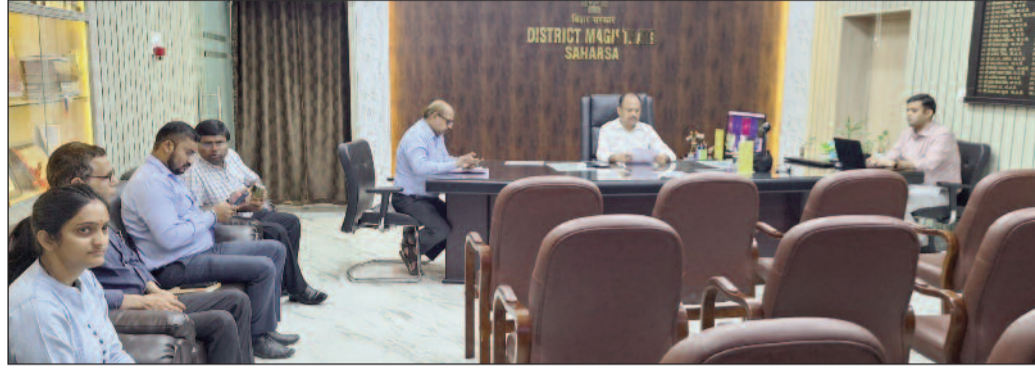
बैठक में जिलाधिकारी, डीडीसी व अन्य