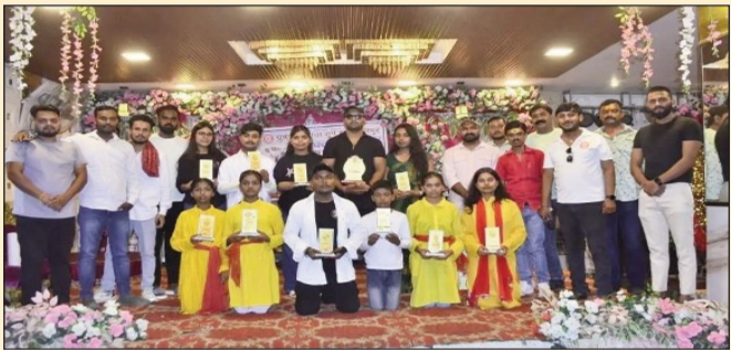
विश्व रक्तदाता दिवस के अवसर पर आयोजित कार्यक्रम में संस्था द्वारा सम्मानित हुए रक्तवीर गण।

मुजफ्फरपुर (एनएसबी)। विश्व रक्तदाता दिवस के अवसर पर युवा रक्तदाता ग्रुप, मुजफ्फरपुर की ओर से मिठनपुर स्थित सभागार में रक्तदान शिविर सह रक्तदाता सम्मान समारोह का आयोजन किया गया। शिविर में 41 से अधिक