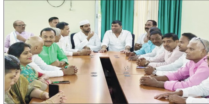
17 जून को आयोजित धरना आंदोलन को सफल बनाने को लेकर समीक्षा बैठक करते राजद के नेतागण।