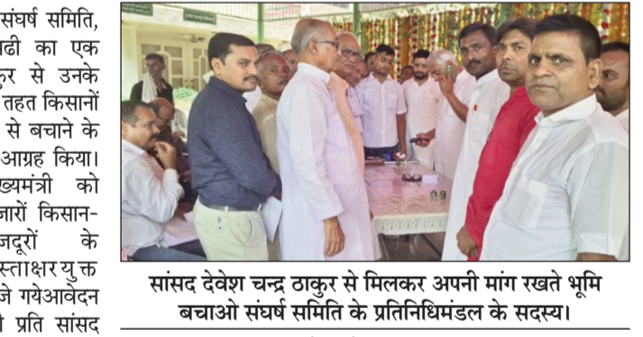
सांसद देवेश चंद्र ठाकुर से मिलकर अपनी मांग रखते भूमि बचाओ संघर्ष समिति के प्रतिनिधिमंडल के सदस्य।

सीतामढ़ी (एनएसबी)। भूमि बचाओ संघर्ष समिति, (सेटेलार्ड सीतापुरम प्रोजेक्ट), सीतामढ़ी का एक प्रतिनिधिमंडल सांसद देवेश चंद्र ठाकुर से उनके आवास पर मिलकर सेटेलार्ड प्रोजेक्ट के तहत किसानों की भूमि छिने तथा गांवों को विस्थापन से बचाने के लिए मुख्यमंत्री स्तर पर पहल करने का आग्रह किया।