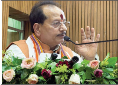
कृषि मंत्री विजय कुमार सिन्हा ।

मंत्री ने बताया कि वित्तीय वर्ष 2026-27 में इस कार्यक्रम का व्यापक विस्तार करते हुए राज्य के कुल 629 पीएम श्री एवं राजकीय विद्यालयों में मिनी सायल टेस्टिंग प्रयोगशालाएं स्थापित की जाएंगी और इस योजना को पूरी पारदर्शिता के साथ लागू किया जाएगा। इन