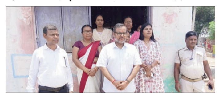
निरीक्षण करते अध्यक्ष।

अरवल (एनएसबी)। बिहार बाल अधिकार संरक्षण आयोग के अध्यक्ष द्वारा विभिन्न संस्थानों का निरीक्षण, बच्चों के कल्याण एवं संरक्षण को लेकर दिए आवश्यक निर्देश दिनांक 15 जून, 2026 को बिहार बाल अधिकार संरक्षण आयोग, पटना के अध्यक्ष डॉ० अमरदीप का जिला आगमन हुआ। अपने भ्रमण कार्यक्रम के दौरान अध्यक्ष द्वारा जिले के विभिन्न बाल संरक्षण एवं बाल कल्याण से संबंधित संस्थानों का निरीक्षण किया गया तथा संबंधित पदाधिकारियों को आवश्यक दिशा-निर्देश दिए गए। सर्वप्रथम अध्यक्ष द्वारा आंगनवाड़ी केंद्र, पुरानी अरवल का निरीक्षण किया गया। निरीक्षण के क्रम में पाया गया कि केंद्र पर कुल 35 नामांकित बच्चों में से 20 बच्चे उपस्थित थे। अध्यक्ष द्वारा सेविका एवं महिला पर्यवेक्षिका को बच्चों की नियमित उपस्थिति बढ़ाने हेतु आवश्यक प्रयास करने तथा अभिभावकों के साथ सतत संपर्क बनाए रखने का निर्देश दिया गया। साथ ही केंद्र पर उपलब्ध शिक्षा सुविधाओं एवं बच्चों को प्रदान की जा रही सेवाओं की भी समीक्षा की गई।