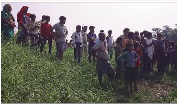
घटनास्थल पर जमा स्थानीय लोगों की भीड़।

बना हुआ है। सुत्रों के मुताबिक इस जगह का उपयोग अपराधियों द्वारा अपराध की घटना को अंजाम देने के बाद शव को ठिकाने लगाने में किया जाता है। आशंका जताई जा रही है कि बरामद शव बेलानौबाद पंचायत के ही किसी गांव का हो सकता है। चर्चा के मुताबिक यह ऑनर किलिंग का मामला हो