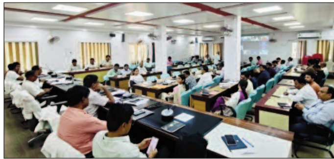
बैठक करके जिलाधिकारी कौशल कुमार।

दरभंगा (एनएसबी)। जिलाधिकारी दरभंगा कौशल कुमार की अध्यक्षता में उनके कार्यालय व्यवस्था को अधिक सुव्यवस्थित, सुरक्षित एवं सुगम बनाने को लेकर समीक्षा बैठक आयोजित की गई। बैठक में नगर क्षेत्र में बढ़ते यातायात दबाव, सड़क अतिक्रमण तथा आपातकालीन सेवाओं के निर्बाध संचालन पर विस्तृत समीक्षा की गई। बैठक के दौरान जिलाधिकारी ने कपूरती चौक से दोनार चौक तक वन-वे यातायात व्यवस्था लागू करने का निर्देश संबंधित अधिकारियों को दिया। इस व्यवस्था का उद्देश्य