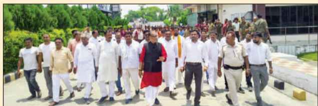
निरीक्षण करते सांसद।

मोतिहारी (एनएसबी)। प्रधानमंत्री नरेंद्र मोदी के नेतृत्व में केंद्र सरकार के 12 वर्ष पूर्ण होने के उपलक्ष्य में आयोजित 'प्रगति पथ यात्रा' कार्यक्रम के तहत सांसद एवं पूर्व केंद्रीय पि एवं किसान कल्याण मंत्री राधा मोहन सिंह ने सोमवार को हरसिद्धि स्थित हिंदुस्तान पेट्रोलियम कॉर्पोरेशन लिमिटेड (एचपीसीएल) के एलपीजी बटलिंग प्लांट का निरीक्षण किया। निरीक्षण के दौरान सांसद श्री सिंह ने कहा कि मोदी सरकार ने तेल एवं गैस क्षेत्र में व्यापक नीतिगत सुधार करते हुए गैस पाइपलाइन नेटवर्क के विस्तार, एलपीजी की पहुंच बढ़ाने, निजी निवेश को प्रोत्साहन देने तथा ऊर्जा सुरक्षा को सुदृढ़ करने का कार्य किया है। उन्होंने कहा कि इन प्रयासों से भारत आत्मनिर्भर और आधुनिक ऊर्जा अर्थव्यवस्था की दिशा में तेजी से आगे बढ़ रहा है। उन्होंने बताया कि हरसिद्धि स्थित यह अत्याधुनिक एलपीजी