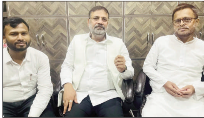
बैठक में उपस्थित लोग।