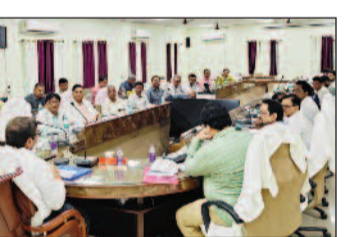
बैठक में प्रमंडलीय आयुक्त एवं अन्य।