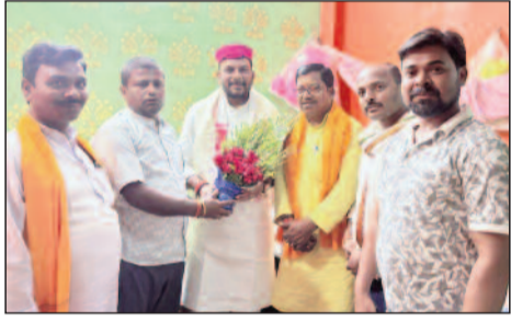
विधानपरिषद का अभिनंदन बीजेपी कार्यकर्ता

सहरसा शहर (एनएसबी)। प्रधानमंत्री श्री नरेंद्र मोदी के कुशल नेतृत्व में केंद्र सरकार के सफलता 12 वर्ष पूर्ण होने के उपलक्ष्य में भारतीय जनता पार्टी द्वारा चलाए जा रहे जनसंपर्क अभियान के तहत भाजपा कार्यकर्ता लगातार समाज के विभिन्न वर्गों से संवाद स्थापित कर रहे हैं और सरकार की उपलब्धियों, विकास कार्यों एवं जनकल्याणकारी योजनाओं की जानकारी जन-जन तक पहुंचा रहे हैं। इसी क्रम में भाजपा जिला उपाध्यक्ष राजीव रंजन साह के गांधी पथ स्थित आवास पर आयोजित आत्मीय मिलन कार्यक्रम में तांती पान समाज की मजबूत आवाज, समाज के लोकप्रिय नेता एवं माननीय भाजपा विधानपरिषद लाल मोहन गुप्ता तांती जी का आममन हुआ। इस अवसर पर भाजपा जिला उपाध्यक्ष राजीव रंजन साह ने विधानपरिषद का अंतिम, पाग एवं पुष्पगुच्छ भेंट कर आत्मीय स्वागत एवं सम्मान किया। कार्यक्रम के दौरान संगठन की मजबूती, जनसंपर्क अभियान की गति एवं समाज के अतिम व्यक्ति तक सरकार की योजनाओं का लाभ पहुंचाने को लेकर सकारात्मक चर्चा हुई। कार्यक्रम में भाजपा जिलाध्यक्ष साजन शर्मा, जिला महामंत्री अनमोल भगत, मीडिया प्रभारी