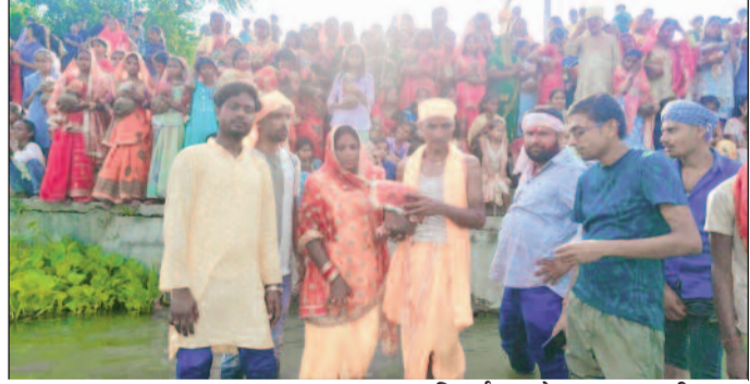
कलश विसर्जन करते ब्राह्मण, कुमारी कन्या

सहरसा शहर (एनएसबी)। जिले के सौरबाजार प्रखंड क्षेत्र के भवटिया गांव स्थित नाथ बाबा स्थान में मलमास अधिकमास या पुरुषोत्तम मास के अवसर पर आयोजित 30 दिवसीय अखंड श्री श्री 108 सीताराम नाम जाप महायज्ञ सोमवार को वैदिक रीति-रिवाजों के साथ संपन्न हो गया। समापन अवसर पर हवन-पूणाहुति, कलश विसर्जन एवं भंडारे का आयोजन किया गया, जिसमें बड़ी संख्या में श्रद्धालुओं ने भाग लिया। महायज्ञ के अंतिम दिन आचार्यों के वैदिक मंत्रोच्चार के बीच हवन, पूजन, होम-जाप एवं पूणाहुति संपन्न कराई गई। इसके बाद श्रद्धालुओं ने गाजे-बाजे और जयघोष के साथ कलश शोभायात्रा निकाली। शोभायात्रा में शामिल श्रद्धालु भक्ति गीतों और सीताराम नाम के संकीर्तन के साथ निर्धारित स्थल तक पहुंचे, जहां धार्मिक विधि-विधान के अनुसार कलश का विसर्जन किया गया।