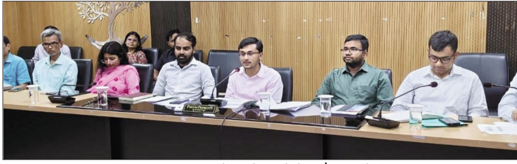
पंचायत विकास दिवस के आयोजन को लेकर बैठक करते डीएम।

सदस्य, पंचायत सचिव, विकास मित्र, जीविका समूह, आंगनवाड़ी सेविका-सहायिका, आशा कार्यकर्ता तथा विभिन्न विभागों के पदाधिकारी एवं कर्मचारी इसमें भाग लेंगे। राष्ट्रपिता महात्मा गांधी के 'ग्राम स्वराज' के सपने को साकार करने में ग्राम पंचायतों की महत्वपूर्ण भूमिका है। भारतीय संविधान के 73वें संशोधन के तहत पंचायतों को संवैधानिक अधिकार और दायित्व प्रदान किए गए हैं। ग्राम पंचायत ग्रामीण क्षेत्र के सामाजिक, आर्थिक और सांस्कृतिक विकास का सबसे महत्वपूर्ण मंच है। इसी सोच को आगे बढ़ाते हुए पंचायत विकास दिवस की शुरुआत की जा रही है ताकि पंचायत स्तर पर विकास योजनाओं की समीक्षा, जनभागीदारी और परदर्शिता को बढ़ावा मिल सके। पंचायत विकास दिवस में ग्राम पंचायत के विकास से जुड़े विभिन्न मुद्दों पर चर्चा होगी। पंचायत द्वारा