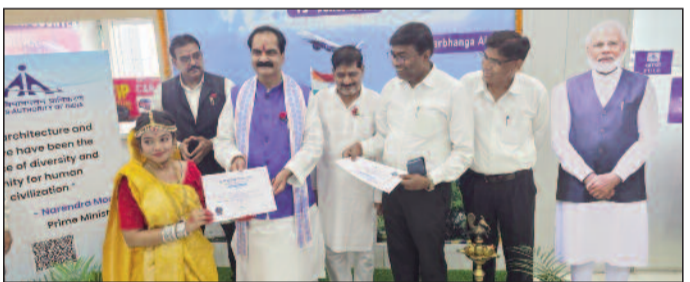
कार्यक्रम में सांसद डॉ. गोपाल जी ठाकुर एवं अन्य ।

दरभंगा (एनएसबी)। दरभंगा हवाई अड्डे पर यात्री सुविधा दिवस 2026 का आयोजन किया गया। स्थानीय सांसद सह एयरपोर्ट सलाहकार समिति के अध्यक्ष डॉ गोपाल जी ठाकुर ने एयरपोर्ट के अधिकारियों तथा सलाहकार समिति के सदस्यों के साथ दीप प्रज्वलित कर कार्यक्रम का उद्घाटन किया तथा दरभंगा एयरपोर्ट पर आने वाले यात्रियों को गुलाब का फूल देकर स्वागत किया। यात्री सुविधा दिवस के अवसर पर मिथिला की पारंपरिक शिक्षिया सहित अन्य तरह की लोकनृत्य एवं सांस्कृतिक उत्पादों को प्रदर्शित करने का माहौल उत्साहपूर्ण बना रहा।