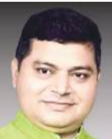
डॉ. राजभूषण निपाद