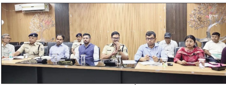
मुहर्रम पर्व के मद्देनजर जिला शांति समिति की बैठक करते डीएम व एसएसपी।