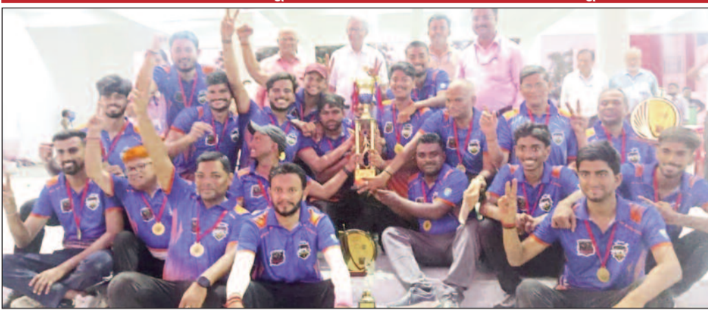
विजेता टीम के साथ पदाधिकारी।