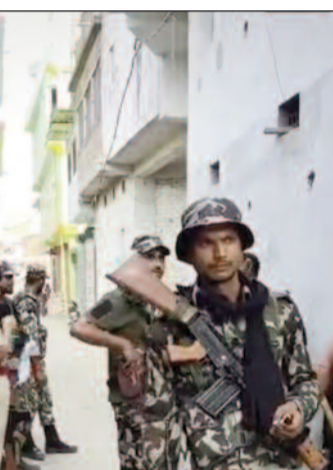
छापेमारी की कार्रवाई को अंजाम देती पुलिस।

सहरसा कार्यालय (एनएसबी)। शहर के रिपयुजी कॉलोनी चैक स्थित मेहमानजी गेस्ट हाउस में पुलिस ने एक कथित सेक्स रैकेट का भंडाफोड़ किया है। गुप्त सूचना के आधार पर की गई छापेमारी में एक महिला सहित कुल 6 लोगों को हिरासत में लिया गया है। मामले की गंभीरता को देखते हुए फॉरेंसिक साइंस लैब की टीम भी मौके पर पहुंचकर सबूत जुटा रही है। पुलिस को गेस्ट हाउस में अनेक गतिविधियों के संचालन की गोपनीय जानकारी मिली थी। जानकारी के वेरिफिकेशन के बाद सहरसा सदर थाना पुलिस ने एक विशेष टीम गठित कर छापेमारी की कार्रवाई को अंजाम दिया। छापेमारी के दौरान गेस्ट हाउस से लगभग 40 साल की एक महिला और 5 युवकों को हिरासत में लिया गया। पुलिस सभी हिरासत में लिए गए लोगों से अलग-अलग पूछताछ कर रही है, ताकि इस नेटवर्क और इसमें शामिल अन्य व्यक्तियों के बारे में जानकारी जुटाई जा सके। इस कार्रवाई में सहरसा सदर