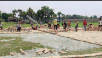
चकोटी मठ का निरीक्षण किया। इस दौरान अधिकारियों ने मुख्यमंत्री के आगमन से लेकर प्रस्थान तक की संपूर्ण व्यवस्थाओं की समीक्षा की तथा संबंधित पदाधिकारियों को आवश्यक दिशा-निर्देश दिए। निरीक्षण के दौरान अधिकारियों ने हेलीपैड की सुरक्षा, बैरिकेडिंग, पार्किंग व्यवस्था, वीआईपी मूवमेंट, आम श्रद्धालुओं की सुविधा, यातायात नियंत्रण तथा कानून-व्यवस्था से जुड़े विभिन्न बिंदुओं पर विस्तार से चर्चा की। साथ ही चकोटी मठ परिसर में श्रद्धालुओं की भीड़ को देखते हुए अतिरिक्त सुरक्षा बलों की तैनाती एवं निगरानी व्यवस्था को लेकर भी आवश्यक निर्देश दिए गए।