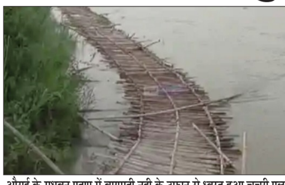
औराई के मधुवन प्रताप में बागमती नदी के उफान से ध्वस्त हुआ चवरी पुल।

औराई प्रखंड के मधुवन प्रताप घाट पर बना चवरी पुल बागमती की तेज धारा में ध्वस्त हो गया। पुल टूटने के कारण इलाके के कई गांवों का औराई प्रखंड मुख्यालय से संपर्क टूट गया है। अब ग्रामीणों को अपने जरूरी कार्यों से औराई प्रखंड मुख्यालय पहुंचने के लिए 20 से 25 किलोमीटर अतिरिक्त दूरी तय करनी पड़ रही है। बताया गया है कि मधुवन प्रताप में बना चवरी पुल ध्वस्त होने की खबर से आसपास के गांवों में अफरा-तफरी का