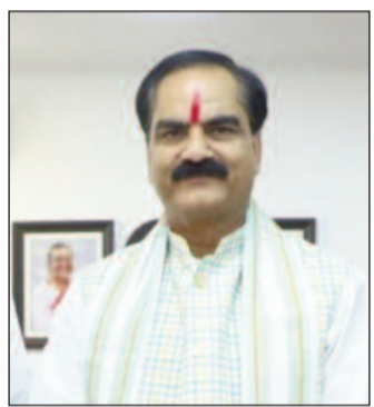
डॉ. गोपाल जी ठाकुर सांसद दरभंगा।

दरभंगा (एनएसबी)। पटना-पूर्णिया एक्सप्रेसवे बिहार का पहला पूर्ण एक्सप्रेसवे बनेगा जो बिहार के लिए ऐतिहासिक साबित होगा। राष्ट्रीय एक्सप्रेसवे-9 के रूप में 6 लेन की इस सड़क का दरभंगा सहित छह जिलों से सीधा जुड़ाव रहेगा जो आने वाले समय में रोजगार व्यापार तथा पर्यटन के लिए गेम चेंजर साबित होगा। दरभंगा जिले में इस प्रस्तावित सड़क के निर्माण कार्य की औपचारिकताओं को शीघ्र पूरा करने के लिए राष्ट्रीय राजमार्ग के बिहार के अधिकारियों को निर्देशित किए गए हैं। स्थानीय सांसद सह लोकसभा में भाजपा सचेतक डा गोपाल जी ठाकुर ने एनएचआई के अधिकारियों को दूरभाष से निर्देशित करते हुए कहा है कि हर एंटी से इस सड़क की उपयोगिता आने वाले समय में वरदान साबित होनेवाला है इसलिए इस परियोजना से जुड़ी सभी औपचारिकताओं को पूरा किया जाय। डाई सौ किमी के विशाल कनेक्टिविटी में यह एक्सप्रेसवे पूरे तरह से आधुनिक तकनीक