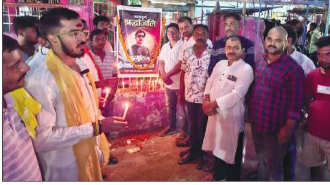
कोईलवर में आयोजित श्रद्धांजलि सभा में शामिल लोग।