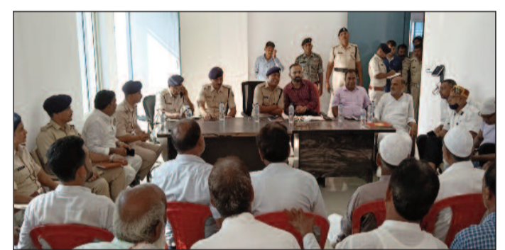
शांति समिति की बैठक में उपस्थित पदाधिकारी।