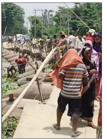
नदी के जल दबाव से कटरा पीपा पुल क्षतिग्रस्त, बंद हुआ वाहनों का परिचालन।

कटरा प्रखंड मुख्यालय से संपर्क कट गया है। अब लोगों को प्रखंड कार्यालय पहुंचने के लिए 40 से 45 किलोमीटर तक का लंबा चक्कर लगाना पड़ेगा। स्थानीय लोगों का कहना है कि पुलों के ध्वस्त होने से सबसे अधिक परेशानी मरीजों, छात्रों और किसानों को हो रही है। इमरजेंसी की स्थिति में लोगों को अस्पताल पहुंचाने में भी भारी दिक्कतों का सामना करना पड़ सकता है। बिना बरसात के ही क्षेत्र में बाढ़ जैसी स्थिति उत्पन्न होने से परेशान क्षेत्र के ग्रामीणों ने प्रशासन से वैकल्पिक व्यवस्था करने और प्रभावित क्षेत्रों में राहत एवं सुरक्षा के पुख्ता इंतजाम करने की मांग की है। फिलहाल नदी का बढ़ता जलस्तर लोगों के लिए चिंता का विषय बना हुआ है और पूरे इलाके में भय और अनिश्चितता का माहौल कायम हो गया है।