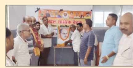
कार्यक्रम में उपस्थित लोग।