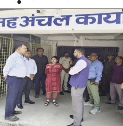
प्रखंड मुख्यालय पहुंच स्थानीय अधिकारियों से विकास कार्यों की जानकारी लेते जिलाधिकारी।

मुजफ्फरपुर (एनएसबी)। जिलाधिकारी कुमार गौरव ने मंगलवार को जिले के विभिन्न प्रखंडों का भ्रमण कर विकास एवं जनकल्याणकारी योजनाओं के प्रभावी क्रियान्वयन, प्रशासनिक व्यवस्था तथा बाढ़ आपदा की तैयारियों का जायजा लिया। इस दौरान उन्होंने साहेबगंज, पारु एवं सरीया प्रखंड का निरीक्षण किया और संबंधित अधिकारियों को कई महत्वपूर्ण निर्देश दिये। भ्रमण के दौरान जिलाधिकारी ने प्रखंड कार्यालयों में कार्यरत अधिकारियों एवं कर्मियों की उपस्थिति, कार्य