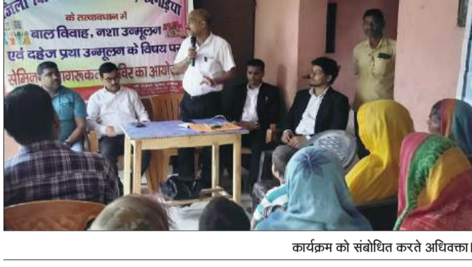
कार्यक्रम को संबोधित करते अधिवक्ता।

होता है दंड का भागी होगा। बाल विवाह के मामले में दीपियों को 2 वर्ष का कारावास तथा 100000 जुर्माना अथवा दोनों हो सकता है। उन्होंने कहा कि बच्चों का विवाह कम उम्र में हो जाने के कारण कई सारी कठिनाइयों का सामना उन्हें करना पड़ता है। बच्चों का भविष्य