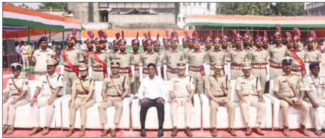
प्रशिक्षु सिपाहियों के दीक्षांत समारोह में भाग लेते जिला एवं पुलिस के वरीय पदाधिकारी।

दरभंगा जिला में प्रशिक्षण प्राप्त कर रहे 230 प्रशिक्षु सिपाहियों का दीक्षांत समारोह-सह-पारण परेड सम्पन्न