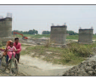
13 सालों की उपलब्धि 5 पिलर।

लोगों का जीवन आसान हो जाएगा। किसानों को अपनी फसल बाजार तक ले जाने में सहाय्यत होगी, विकास का मार्ग प्रशस्त होगा और लोगों के जीवन स्तर में बदलाव आएगा। लेकिन, 13 सालों में सरकारी कार्य प्रणाली के कारण लोग टगा महसूस कर रहे हैं। जब पाया निर्माण बंद हुआ, तब लोगों को जानकारी मिली कि बिना जमीन अधिग्रहण के ही पुल का निर्माण शुरू कर दिया गया था। जब जमीन के स्वामियों ने इसका विरोध किया, तो करोड़ों रूपय खर्च कर 5 पिलर बनाने के बाद पुल का निर्माण रोक दिया गया। यहां सवाल यह है कि, आखिर बिना जमीन अधिग्रहण किए पुल का निर्माण 2013 में कैसे शुरू किया गया? अब तो जो पिलर बनाए गए, उसका सरिया अब खराब हो गया है। अब नये सिरे से पुल का निर्माण करना होगा। अखाड़ा घाट पर पुल बनने से समस्तीपुर के साथ ही बेगूसराय के लोगों को फायदा मिलता।