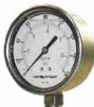
3 | Manômetro