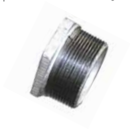
1 | Bucha de Redução