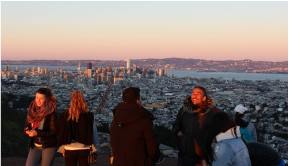
Étudiant-es HEIG-VD à San Francisco

Horaires pour les étudiant-es : lundi, mardi, mercredi, jeudi ou sur rendez-vous