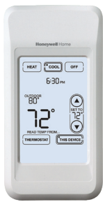
Portable Comfort Control™