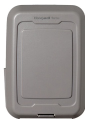
Détecteur de température de l'air extérieur sans fil