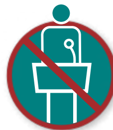
Ontzeggen van het gebruik van openbare of particuliere ruimtes