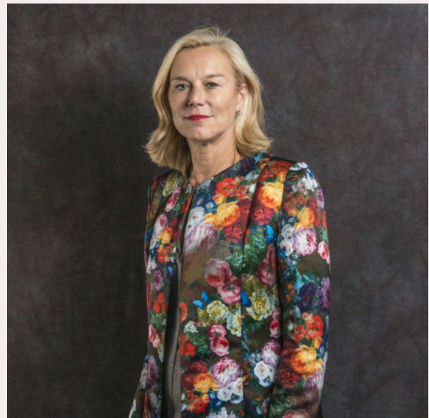
Voormalig minister van Buitenlandse Zaken Sigrid Kaag.

De lastercampagne tegen Kaag werd nog persoonlijker toen Geert Wilders een foto tweette van de D66-politica, haar man, vier kinderen en 'PLO-terrorist Yasser Arafat', aldus Wilders.