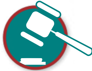
Dreigen met rechtszaken