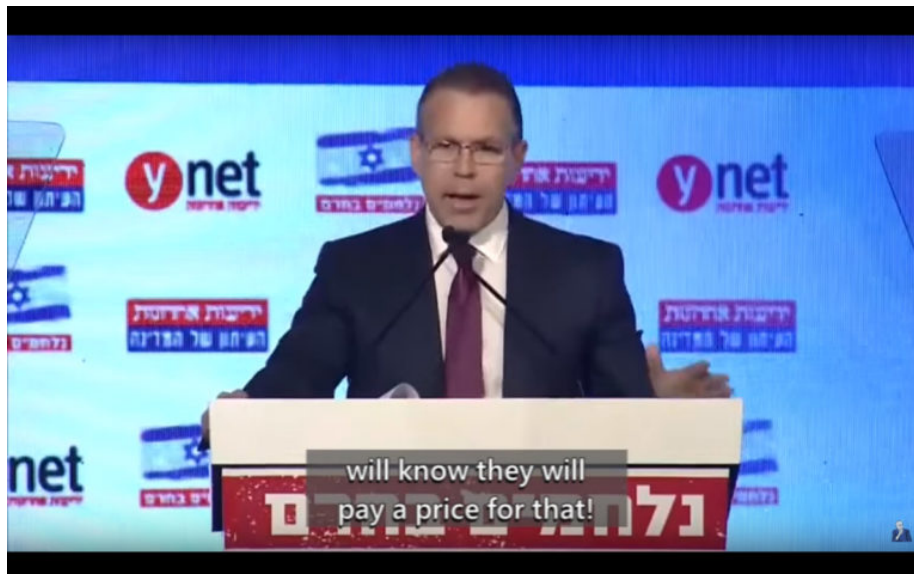
Minister van Strategische Zaken Gilad Erdan bedreigt BDS-activisten. YouTube.

als gepaste reactie op het Israëliësche apartheidsregime.