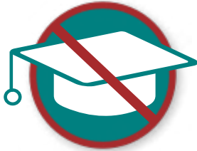
Inperken van academische vrijheid