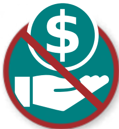
Aanvechten van fondsen en subsidies