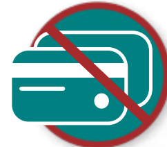
Toegang tot financiële diensten beperken

Israël en de Palestijnen en daarover met elkaar in gesprek te gaan. Pro-Israël groepen organiseerden lastercampagnes om universiteitsbesturen ertoe te bewegen geen ruimte te bieden aan evenementen over de Israëlische onderdrukking van Palestijnse rechten en de studentengroepen die deze evenementen organiseerden. In drie gevallen waren de pro-Israël-groepen succesvol en werden de studentengroepen gedwongen een alternatieve locatie voor hun evenementen te zoeken (zie Casus 5). In de twee andere gevallen weerstond het universiteitsbestuur de druk en konden de evenementen doorgaan zoals gepland (zie Casus 6).