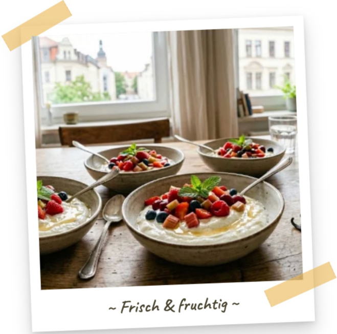
~ Frisch & fruchtig ~