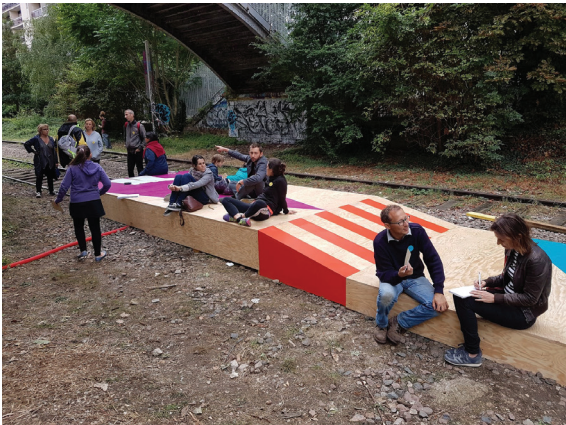
des “jolies bancs décorés et non ceux de la Ville de Paris” coulée verte ou petite ceinture