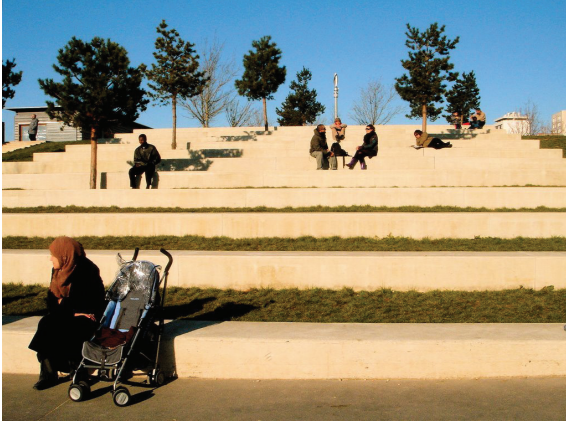
“des niveaux” jardin d'Eole