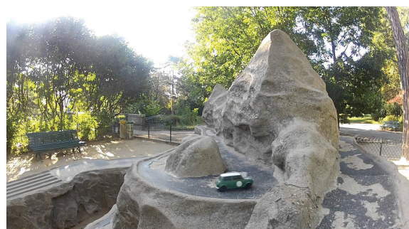
parcours de billes au parc de Montsouris