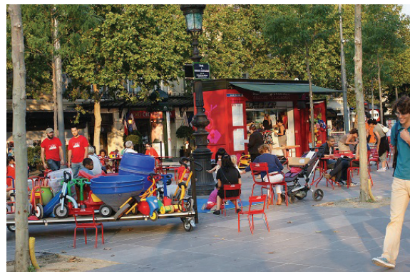
espace ludothèque place de la République