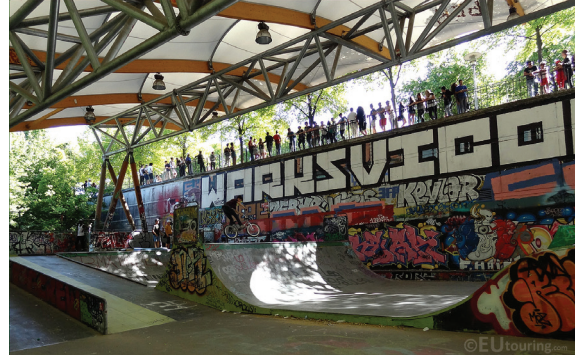
skatepark, parc de Bercy