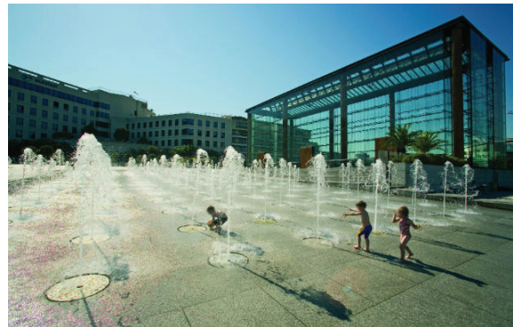
fontaine pour les enfants, parc André Citroën