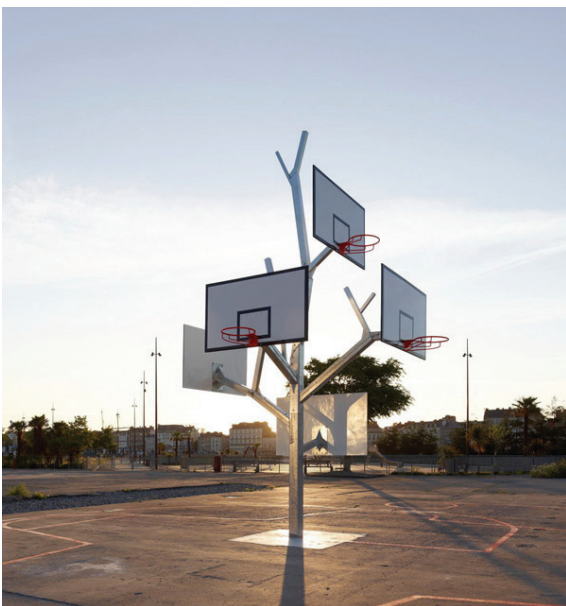
panier de basket à plusieurs hauteurs