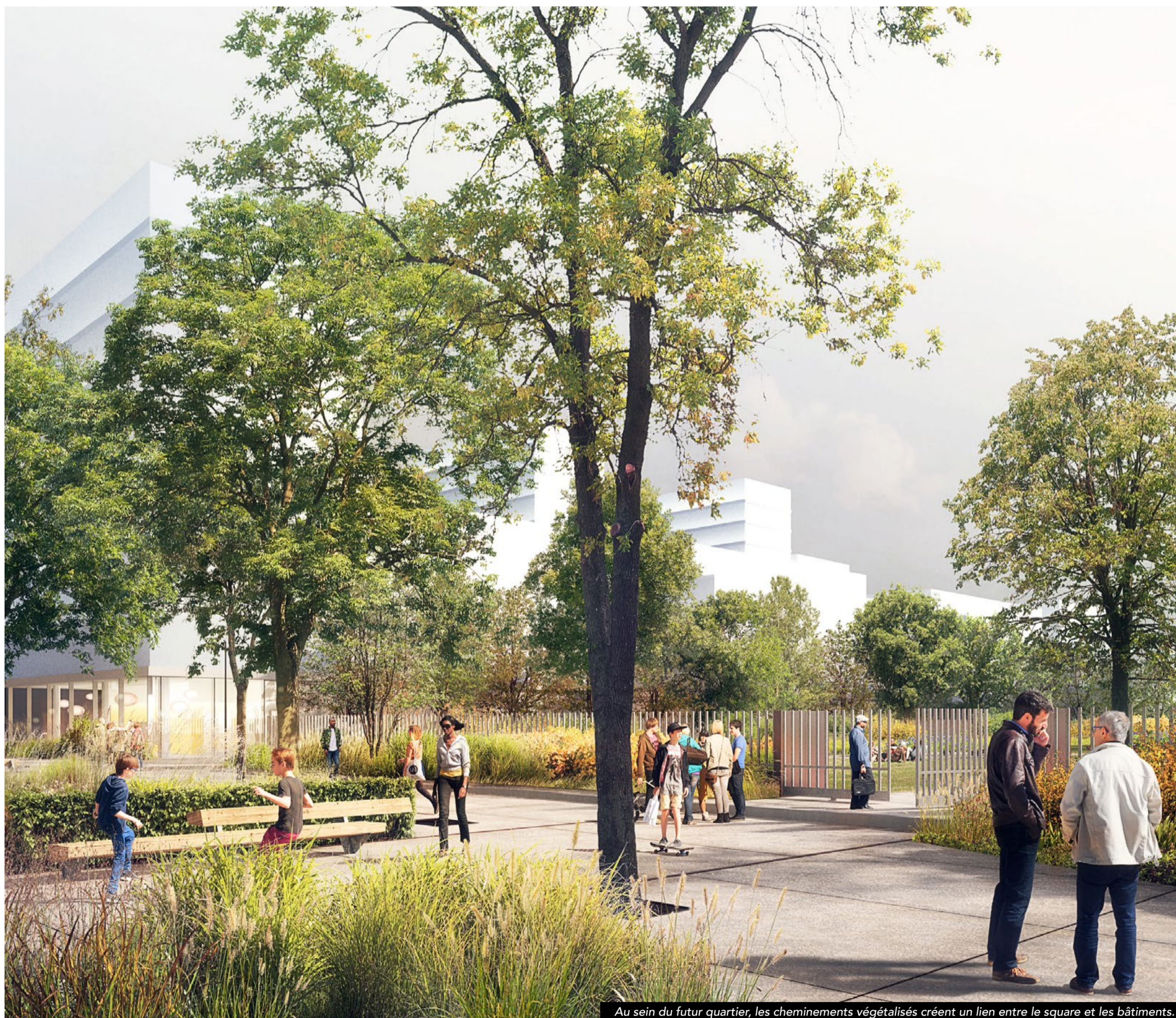
Au sein du futur quartier, les cheminements végétalisés créent un lien entre le square et les bâtiments.