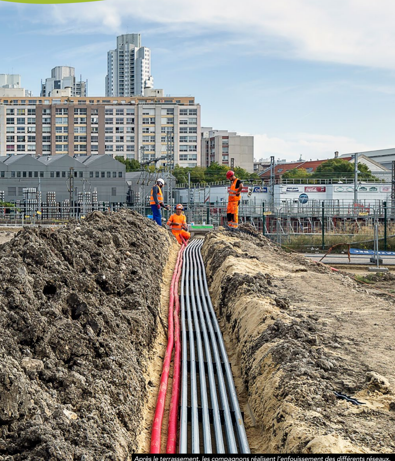
Après le terrassement, les compagnons réalisent l'enfouissement des différents réseaux.

À partir de 2024, les opérateurs immobiliers construiront les premiers bâtiments. Enfin, dernière étape, les travaux des futurs espaces publics qui commenceront en 2025. Nous finaliserons ainsi les chaussées et les trottoirs, créons les espaces verts et les aires de jeux, puis installerons le mobilier urbain et l'éclairage. C'est à partir de 2026 que vous pourrez découvrir ces nouveaux espaces de vie !