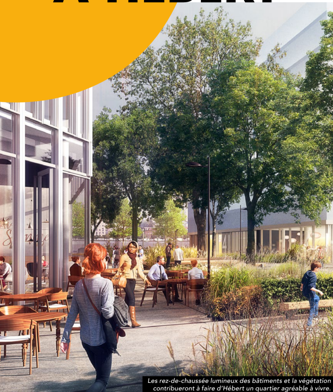
Les rez-de-chaussée lumineux des bâtiments et la végétation contribueront à faire d'Hébert un quartier agréable à vivre.

“ Le projet Hébert a toujours intégré la question du cadre de vie dans son identité, et ce depuis son lancement en 2017. ”