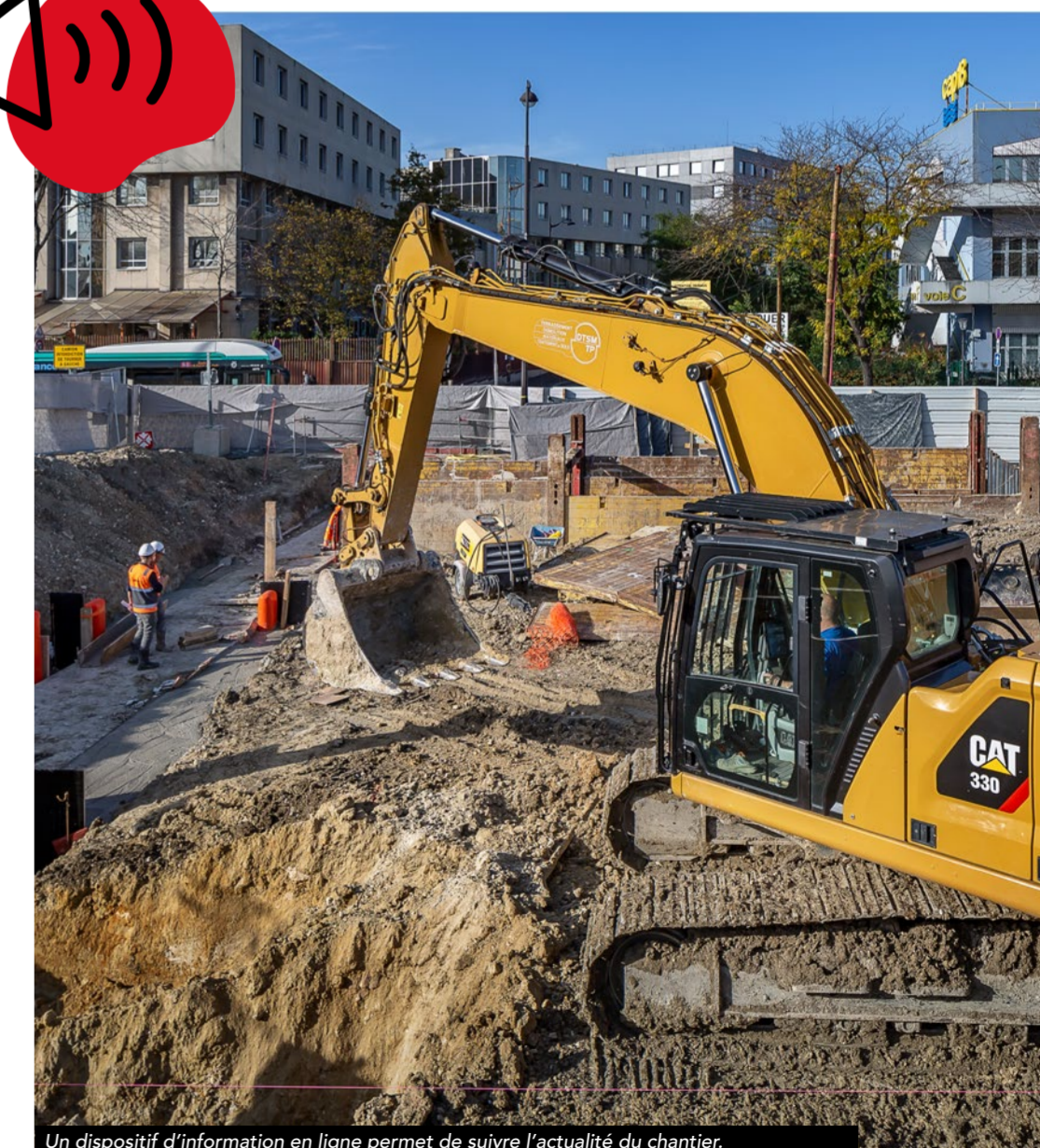
Un dispositif d'information en ligne permet de suivre l'actualité du chantier.

Parallèlement, un système d'information baptisé « Météo des Chantiers » a été mis en place sur le site internet du projet. Il informe les riverains de l'actualité des chantiers, et affiche le niveau de nuisances sonores et vibratoires à venir sur 10 jours. Ce dispositif est doté de capteurs qui mesurent les niveaux sonores, dont les courbes sont consultables en temps réel. Il est complété par une caméra embarquée permettant de visualiser les sources des nuisances. Cet outil offre également la possibilité de s'inscrire pour être informé et faire des signalements.