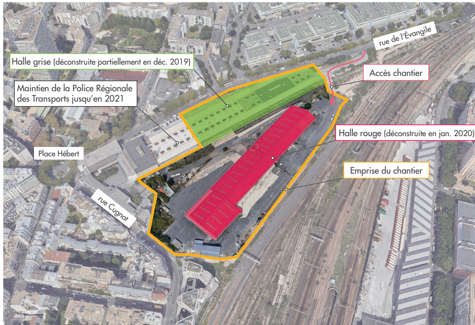
Le plan des déconstructions

rouge » : anciennement occupée par les entreprises Tafanel (limonadier) et Paris Distribution (logistique). La partie « halle grise », d'abord occupée par le magasin Point P puis par l'Aérosol, sera elle aussi déconstruite.