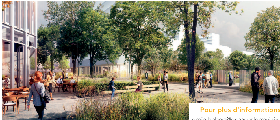
Vue du cœur du projet

avec un impact environnemental limité, et notamment des constructions privilégiant des matériaux massifs et biosourcés comme le bois, qui permettent le stockage carbone.