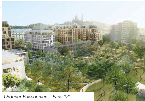
Ordener-Poissonniers - Paris 12 e