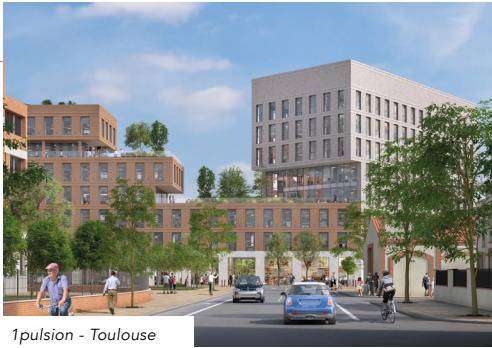
1pulsion - Toulouse