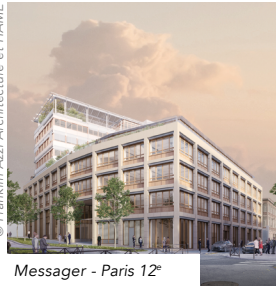
Messenger - Paris 12 e