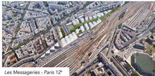
Les Messageries - Paris 12 e