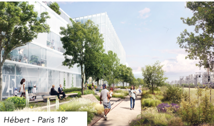
Hébert - Paris 18 e