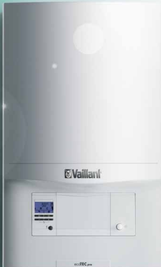
■ ecoTEC pro

The good feeling of doing the right thing.