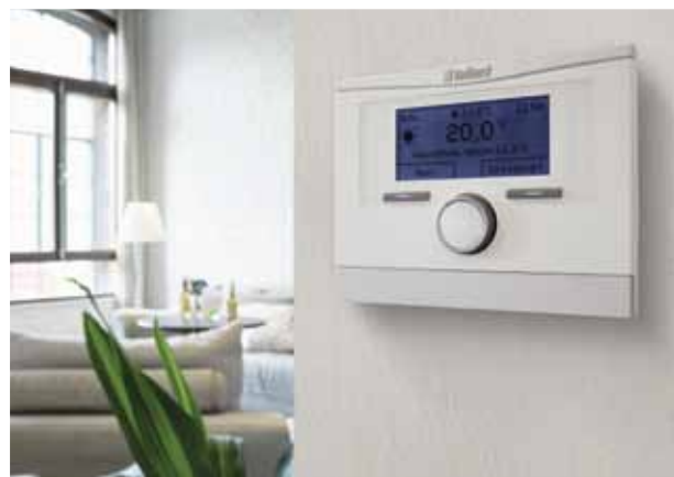
multiMATIC VRC 700

Du kan også sende os en e-mail på salg@vaillant.dk .