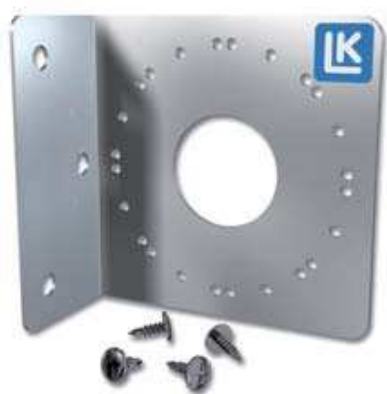
LK Väggdosfäste - 1