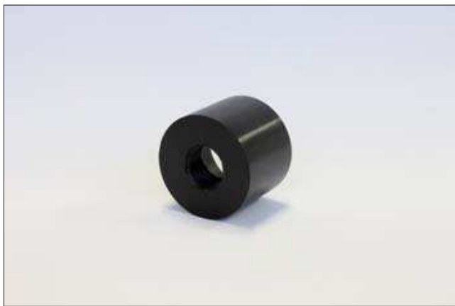
LK Förstärkningshylsa UNI (RSK 187 81 78).

LK Förstärkningshylsa Uni (RSK 187 81 78), se bild nedan, använd då blandaren behöver maximalt stöd. Hylsan har en invändig gänga 1/2" som gängas på anslutningskopplingen. Anslutningskopplingen gängas därefter på väggdosans vinkelkoppling.