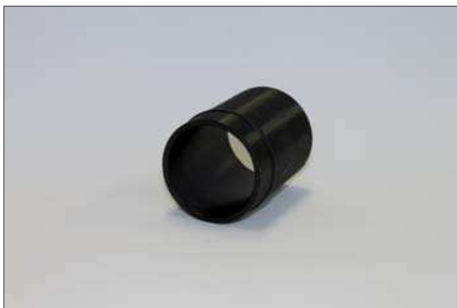
Längd 65 mm. LK Förlängningshylsa UNI (RSK 187 81 79).

LK Förlängningshylsa UNI (RSK 187 81 79) användes vid platsgjutna betongväggar. När LK Väggdosa friläggs ur betongväggen trycks denna förlängningshylsa in i dosan. Applicera därefter tätskiktet alternativt tätningsmanschett runt förlängningshalsen, LK Rörmanschett 48 (RSK 481 43 86) kan användas. Hylsan kan efter färdig vägg kortas med LK Dosfräs UNI (RSK 187 64 94). Tätningsmanschett eller motsvarande levereras och monteras normalt av tätskiktstentreprenören.