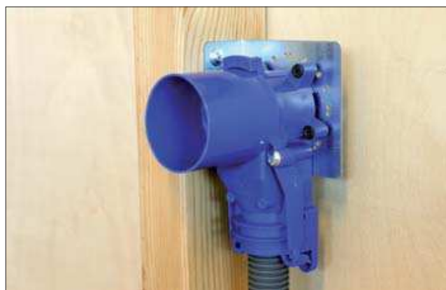
LK Väggdosfäste - 1 monterad på stående regel.