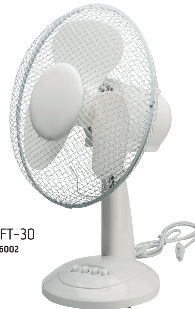
Model FT-30 Varenr. 976002