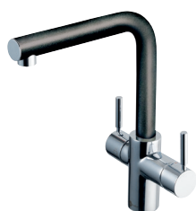
L-hane antracit Varenr. sæt: IN-3N1LAN