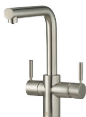
L-hane stål-look Varenr. sæt: IN-3N1LSL