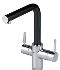
L-hane sort Varenr. sæt: IN-3N1LSO