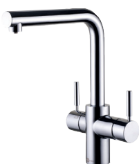
L-hane krom Varenr. sæt: IN-3N1LKR