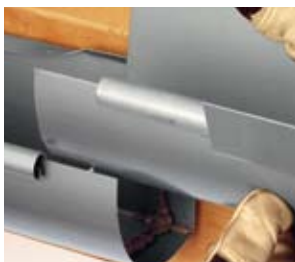
Renden lægges i.