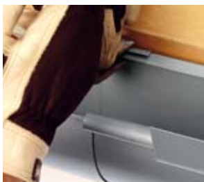
Bagvulst bukkes om.