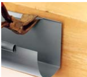
Bagvulst bukkes om.

Tagrende med ekspansion monteres på samme måde som almindelige tagrender uden. Der indbygges ekspansion for hver 15 m. Ved geringer dog for hver 6 m.