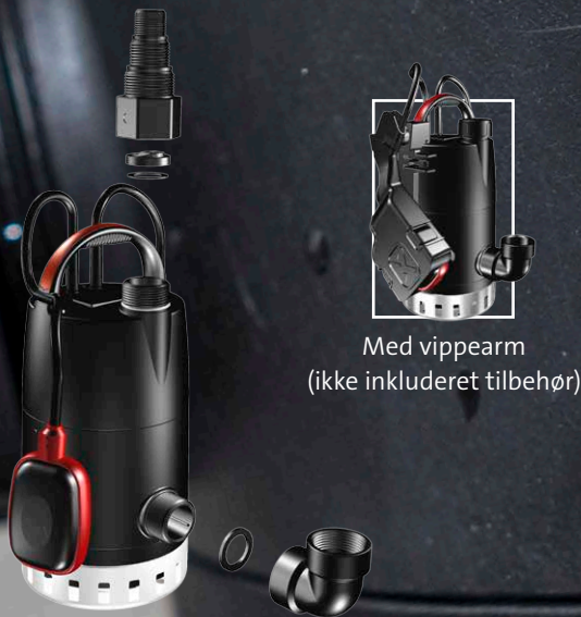
Med vippearmer (ikke inkluderet tilbehør)