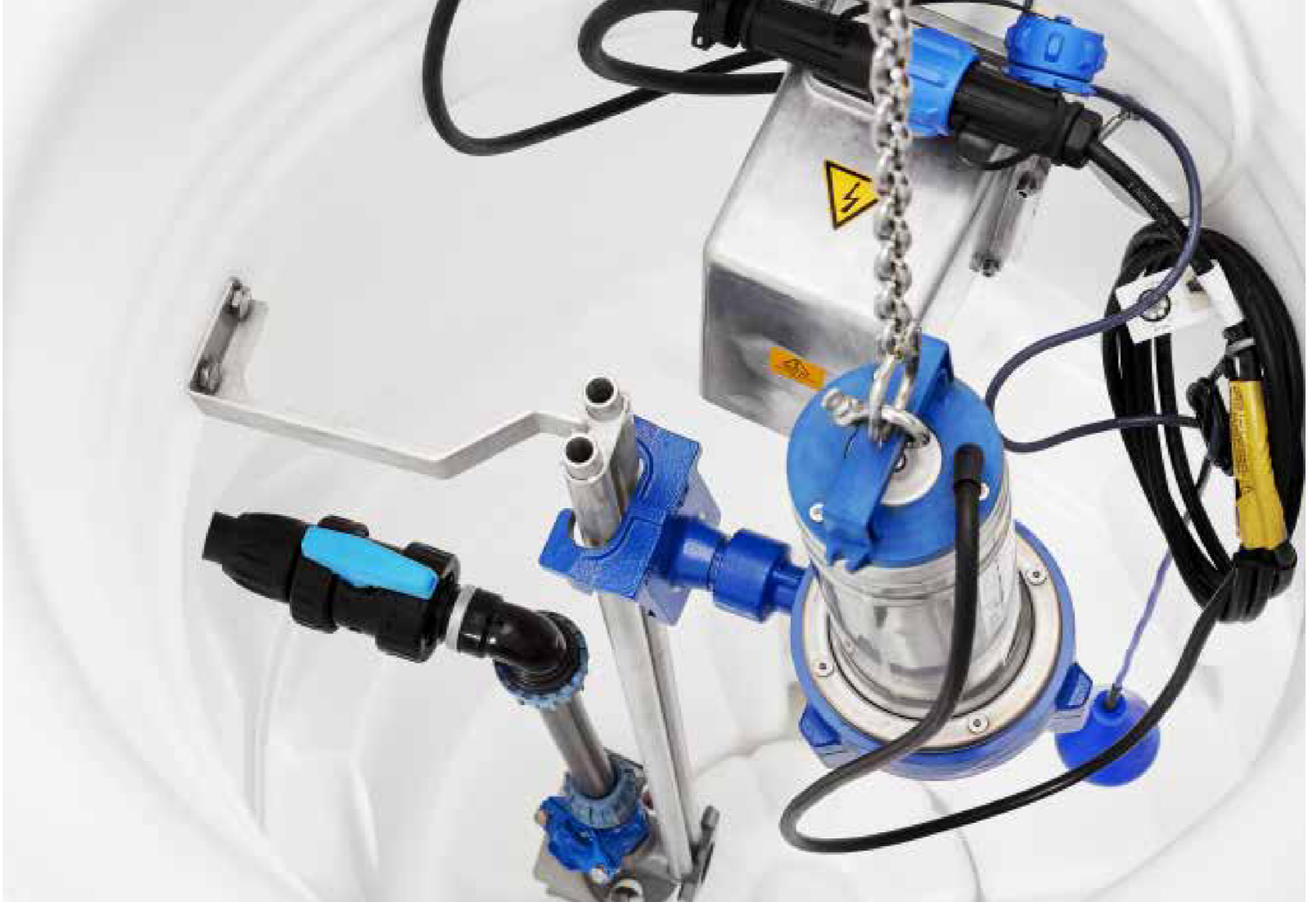
Compit 901 med pumpar i hängande montage, H alternativt med gejdör och bottenmonterad kopplingsfot s k P-montage