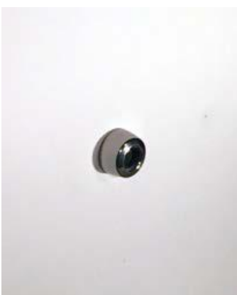
Skub på plads