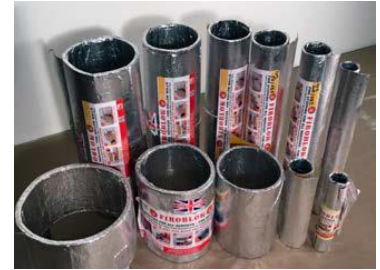
KARFA Brand-Luk til alle størrelser og dimensioner

Du kan let installere PAK-Bøsning med Brand-Luk ved at følge denne anvisning: