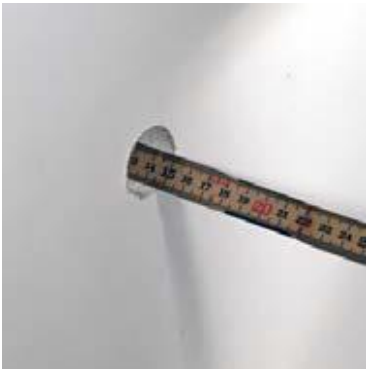
Mål dybden på væg/dæk

Du kan let installere PAK-Bøsning med Brand-Luk ved at følge denne anvisning: