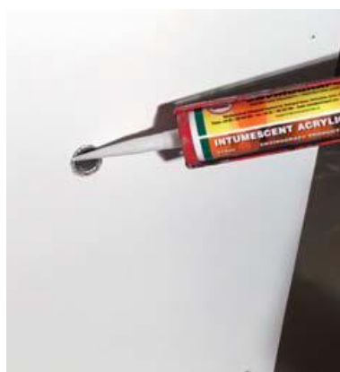
Fug på bagsiden omkring rør med KARFA Brand-Mastik P58, så der er røgtæt