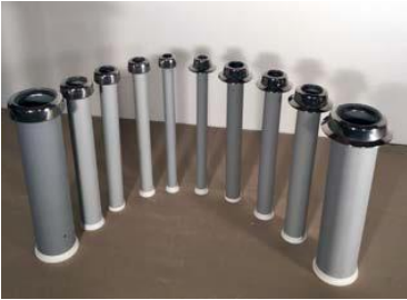
KARFA PAK-Bøsninger i alle størrelser og dimensioner