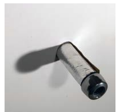
Indsæt PAK-Bøsning med KARFA Brand-Luk i hullet