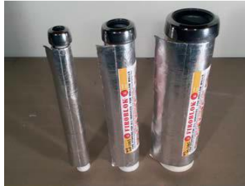
PAK-Bøsning med KARFA Brand-Luk