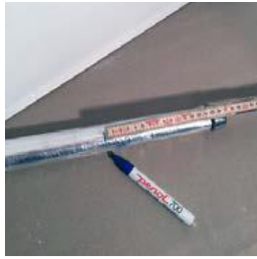
Afmærk på bøsning, og skær det overflødige væk