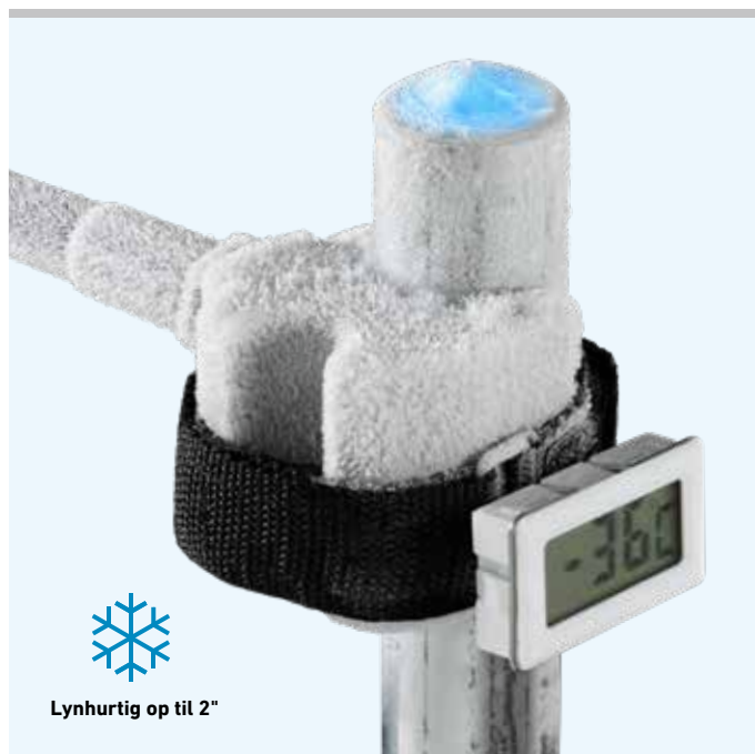
Lynhurtig op til 2"

LCD-digital-termometer med klips, til nøjagtig temperaturvisning direkte på indfrysingsstederne.