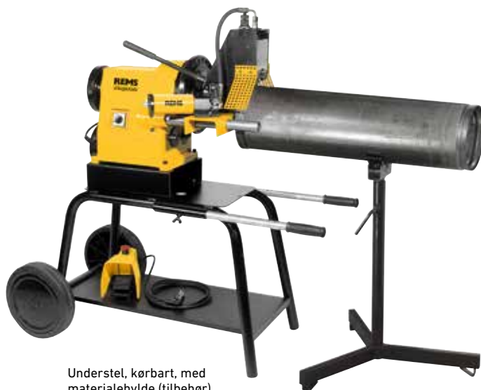
Understel, kørbart, med materialehylde (tilbehør)