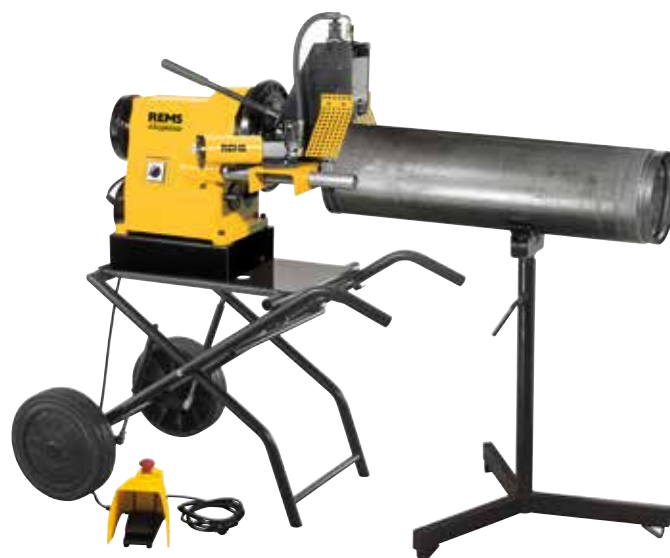
Understel, klap- og kørbart (tilbehør)