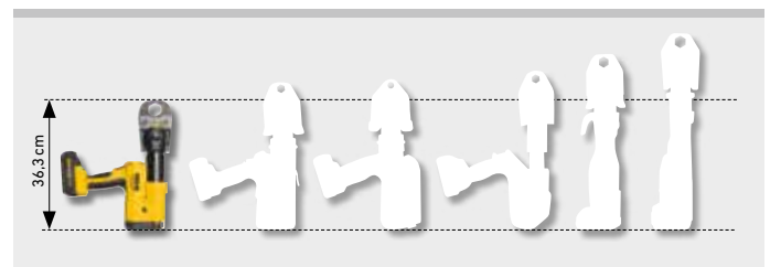
Den lille blandt de store. Kun 3,4 kg.

REMS Li-Ion 22V Technology, se side 20–25. Ekstremt højt belastbare akkuer Li-Ion 22V med 2,5, 4,4, 5,0 eller 9,0 Ah kapacitet for lang driftstid. Let og effektiv. Akku Li-Ion 22V, 2,5 Ah, 54 Wh til ca. 210 presninger, 4,4 Ah, 95 Wh til ca. 370 presninger, 5,0 Ah, 108 Wh til ca. 420 presninger, 9,0 Ah, 194 Wh til ca. 750 presninger af Viega Profipress DN 15 pr. akkuladning*. Trindelt ladetilstandsindikator med farvede LED. Arbejdstemperaturområde –10 til 60 °C. Ingen memoryeffekt for maksimal akkueffekt. Hurtiglader 100–240V, 90W, 22V eller 290W, 22V, for kortere opladningstider, som tilbehør. Strømforsyning 220–240V, 22V, 15 A afgivet, til netdrift i stedet for genopladeligt akku Li-Ion 22V, som tilbehør.