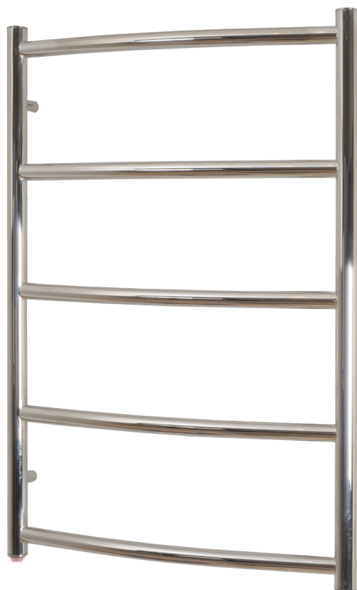
SN6543PE (45Watt) 800x530mm (HxB)