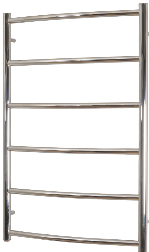
SN8053PE (60Watt) 800x530mm (HxB)

Følgende produkter er omfattet af nærværende dokument