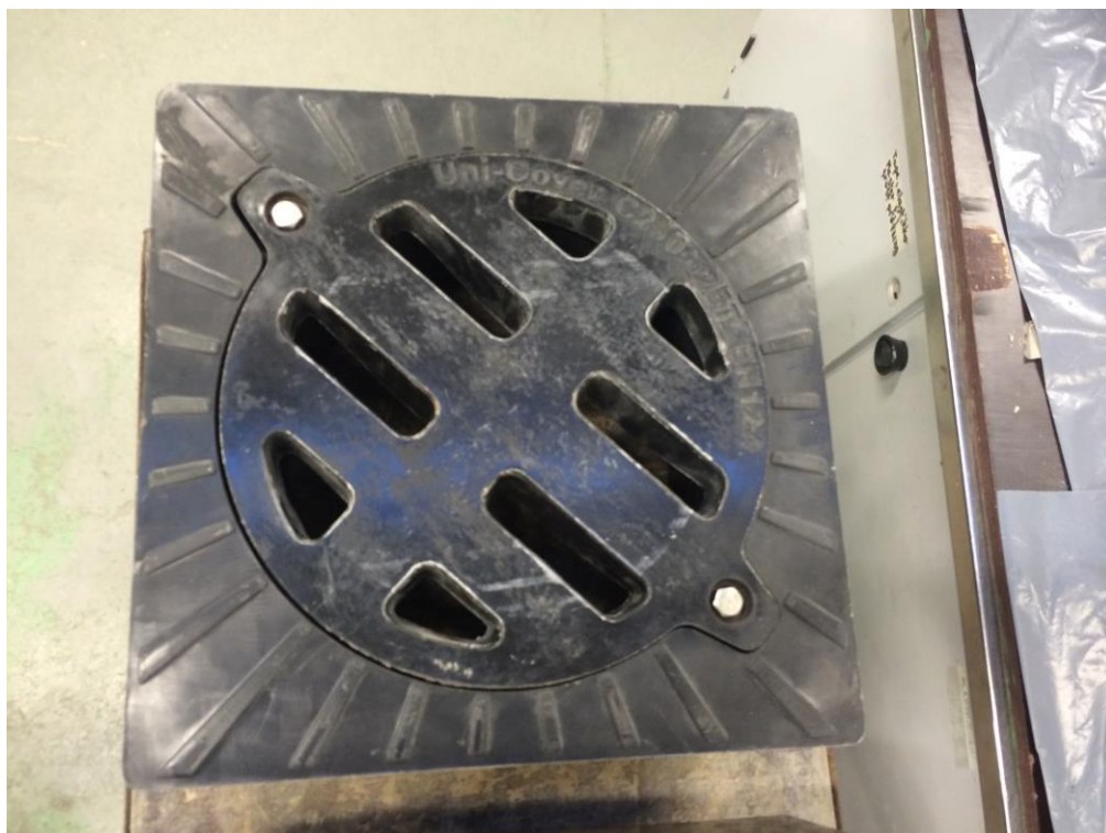
Uni-seals dæksel, C250-25