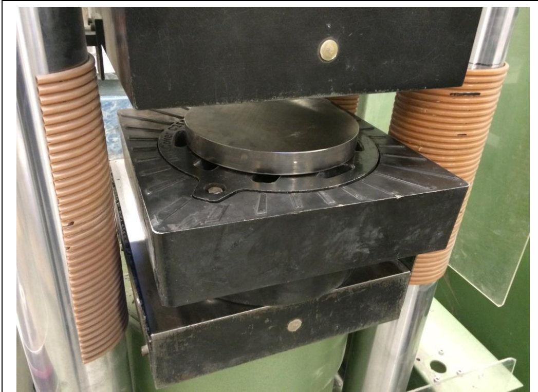
Uni-seals dæksel, C250-25T