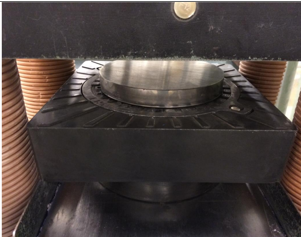
Uni-seals dæksel, D400-40T