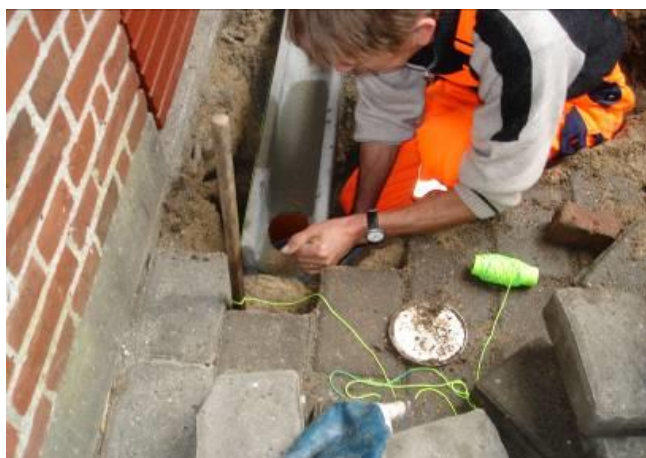
Beton lægges i, start med renden med hul i. Monter så afløb.