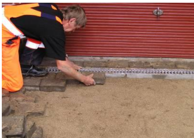
Belægningsstenene lægges igen. Ristene lægges i.