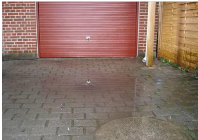
FØR – irriterende vandpytter foran og i garagen.