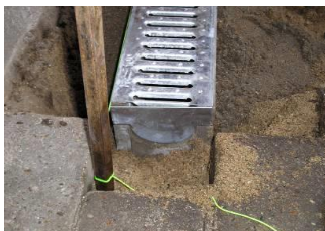
Rendeelementerne placeres efter hinanden, endevægge monteres.