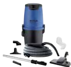
Nilfisk DIY Alt-i-1 150 Manuel Bestillingsnr.: 42000508