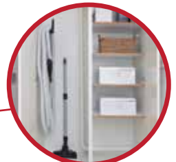
Rørinstallation i skab