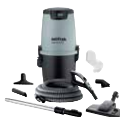
Nilfisk Alt-i-1 LCD Deluxe Bestillingsnr.: 42000507