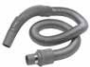
Fleksibel slange, 1-6 m Bestillingsnr.: 42000122

Med en trådløs centralstøvsuger kan alle funktioner - tænd/sluk, sugestyrke, status for støvsugerposen o.s.v. - styres og kontrolleres direkte via displayet på rørbøjningen. Dette afhænger dog af, hvilken type håndtag man vælger. Nilfisk tilbyder flere forskellige håndtag, hvoraf to har tovejskommunikation, et har lysdioder, og et har LCD-display.