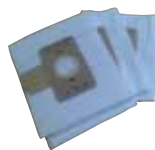
Polyester poser 10-liters Bestillingsnr.: 107401158