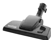
Kombimundstykke Bestillingsnr.: 107408042