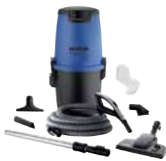
Nilfisk DIY Alt-i-1 150 Wireless+ Bestillingsnr.: 42000509