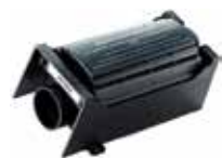
HEPA filter Bestillingsnr.: 42000480