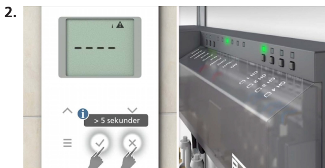
Vælg kanal på kontrolenheden og tilmeld rumtermostaten.