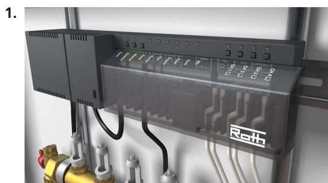
Monter kontrolenheden og tilslut termomotorene.

Med Touchline installerer du rumtermostater i bygningens rum meget enkelt. Med kun to tryk har du meldt rumtermostaten til.